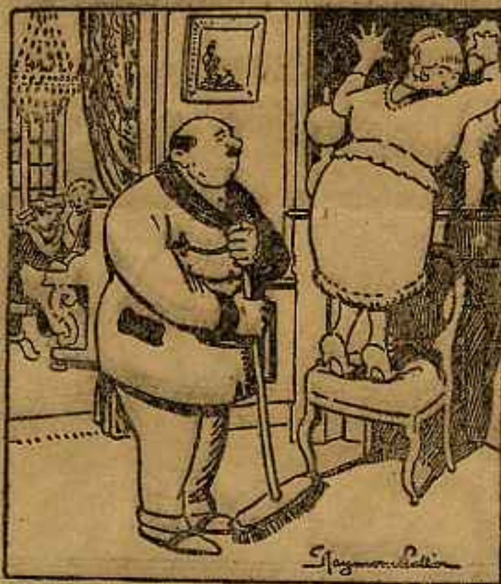
— Não faças tanto barulho que incomodas a lição de piano da nossa criada!