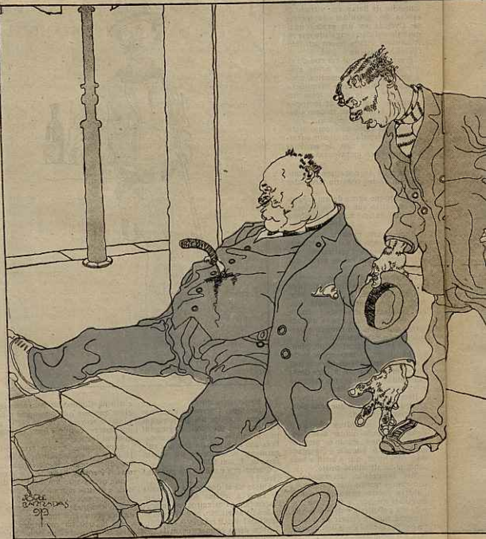
— O cavalheiro desculpe, mas a ge tem

Ao seu lado, um negro de turbante agita com ambas as mãos uma ventarola de penas de jacaré, segurando na outra uma lança envenenada. No chão acocorados só-