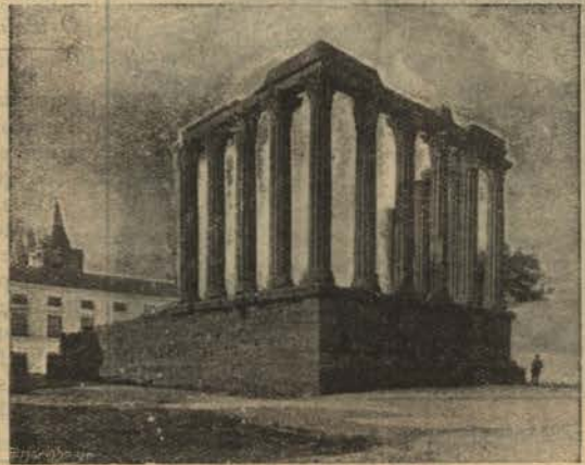
EVORA - O Templo de Diana

São tambem muito interessantes: os bustos de S. Pedro e S. Paulo em marmore, a capela do Esporão, a porta da sacristia, o crucifixo da ca-