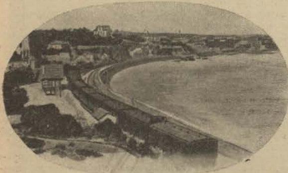
ESTORIL.—Um aspecto da praia