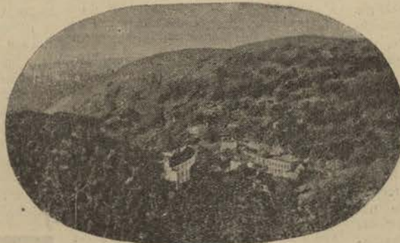
CALDAS DE MONCHIQUE.—Um aspecto da paisagem

tanta desesperada esperança, vêr fim, com infinita alegria, definitivamente aniquilada a grande barreira que separou, durante penosos anos, a feliz infancia d'outr'ora do memoravel e nunca esquecido exito d'agora.