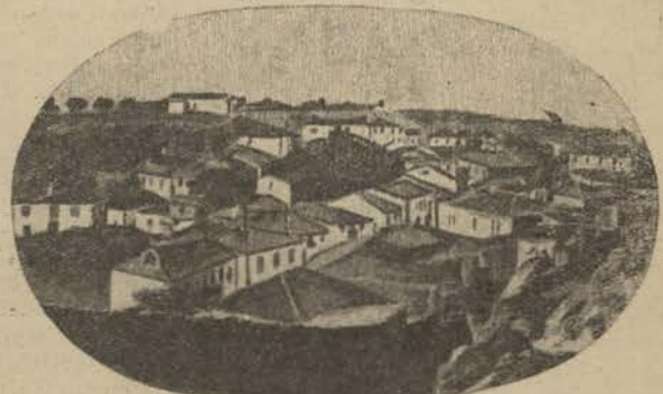
GUARDA.—Uma parte da cidade

a victoria, que a seguir nos permitimos a liberdade de transcrever, traduzindo-a literalmente.