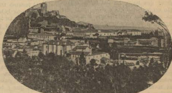
LEIRIA—Um aspecto da cidade

veia, que Pedro Botto Machado, está povoando de lindos chalés, outeiros encimados por bastas cupulas de pinheiras, como o Seixoso, Edens, encantados, cortados de rios murmurando, com nascentes a jorrar agua a ferver, como S. Pedro do Sul, que só por si dariam um aquecimento-central natu-