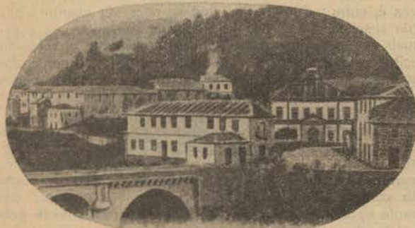
S PEDRO DO SUL—O local das thermas

divino do Algarve, montanhas vestidas de arvoredo secular como o Busaco, quebrados de serras, com largos horisontes, como o Farvão, em Gou-