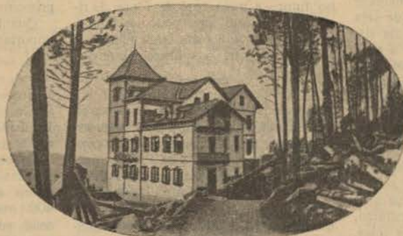
Edifício do Sanatorio de Seixoso

beira mar, entre rochedos, como a Praia da Rocha; vales apertados entre montanhas de arvoredo selvagem, como Monchique, encostas aquecidas ao sol