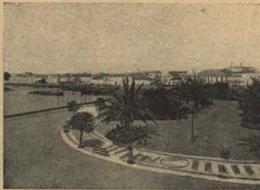
FARO - Avenida do Caes

bem educada. O nosso automovel parou para um dos companheiros fazer uma pequena visita; durante essa curta espera, um grupo de curiosos aproximou-se de nós, e no momento de partirmos abriu alas, e todos á a tiraram os seus chapéus envolvendo-