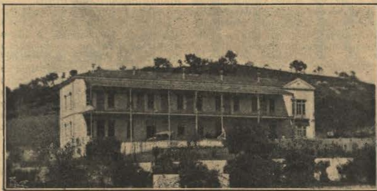
S. BRAZ DE ALPORTEL — Sanatorio Carlos Porto

A vista que do terraço do palacio se disfructa, e que vae até ao mar, é alguma coisa de interessante e de belo, pois o panorama que se alastra a nossos pés, é uma vasta planície de amendoeiras e figueiras em alinhamentos