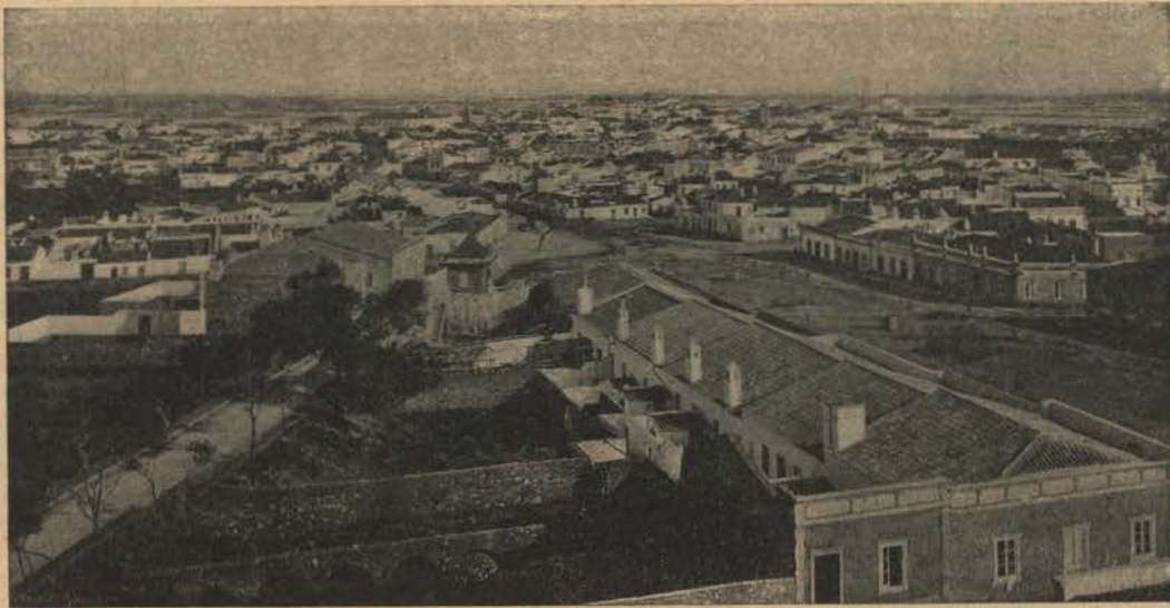
FARO — Vista Geral

Era para mim uma viagem agradável, tanto mais que tinha de S. Braz d'Alportel uma saturada recordação d'um desconhecido, que em Beja almoçando comigo, gastou todos os seus entusiasmos a exaltar a ridente vila algarvia.