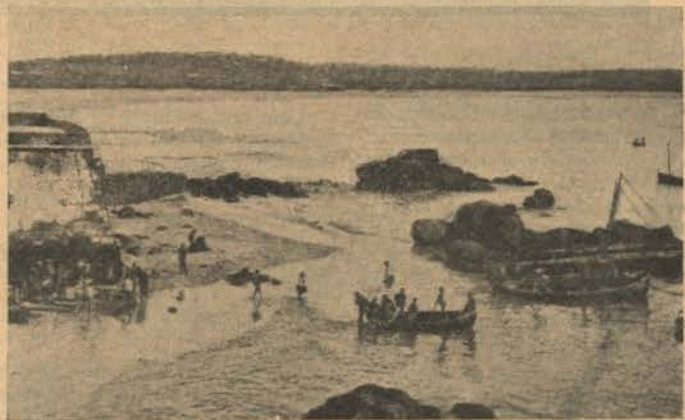
LAGOS - Vista da esplendida bahia

lindas mulheres do Algarve. Se assim é, é porque estavam recolhidas, pois em toda a feira não vimos um só typo de beleza de tantos que o Algarve possui. Em compensação visitamos a casa do sr. Visconde de Estoy, um museu de maravilhas de arte, mas arrumadas pelas impias mãos d'uma salaia.