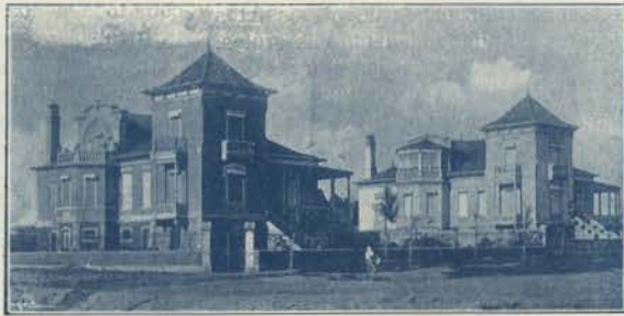
ESPINHO—UM TRECHO DAS NOVAS EDIFICAÇÕES