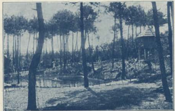
ESPINHO - UM TRECHO DA VILA MARIA