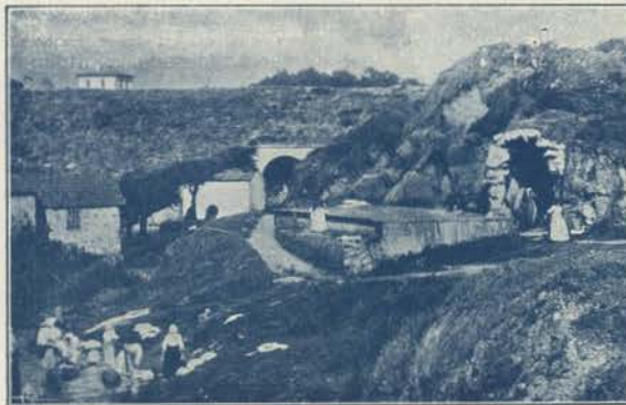
ESPINHO - FONTE DO MÔCHÓ

E' aqui que a linha ferrea do Vale do Vouga tem o seu termo, proporcionando assim aos banhistas das re-