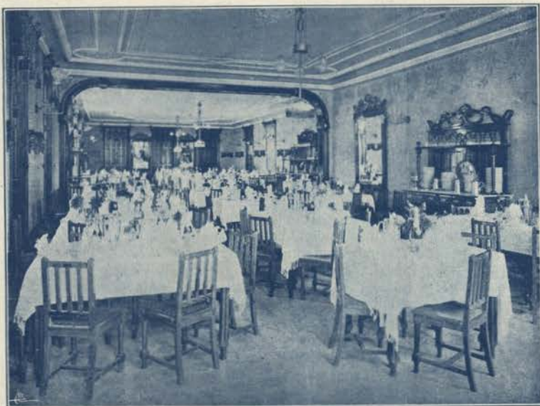
ESPINHO—INTERIOR DA SALA DE JANTAR DO GRANDE HOTEL E CASINO

As suas noites tomam taes proporções de phantasia, que nos transportam aos doces dominios da Chimera e