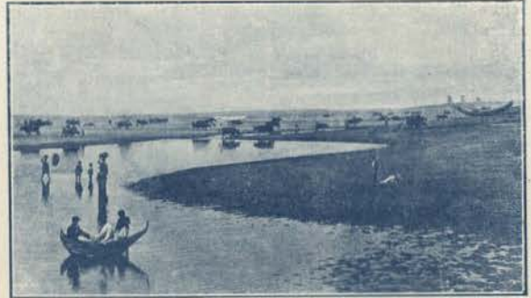
ESPINHO - A ARRASTA DA RÊDE

fui convidado, convite amavel que muito me honra e ao qual, apenas, posso corresponder com oportunidade, cantando com a minha voz debil, orphã da melodia que seduz, desirmada da harmonia que atrai e sem arrebatamentos que encantam, a belesa d'esta seductora praia — tão socegada e tranquila, a remirar-se donairoza no lucido espelho das aguas do mar, embevecida e silenciosa escutando as meloeias dolentes do mesmo em bonança, ou o bramir clamoroso do seu eterno porfiar.