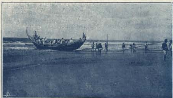
ESPINHO—BARCO DE PESCA entrando para o mar

giões proximas, conjuntamente com a linha da Companhia Portugueza, meios de condução facil.