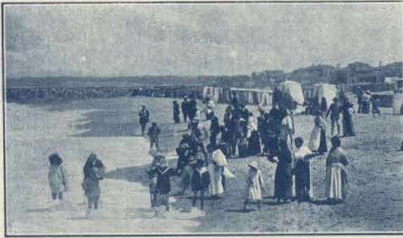
ESPINHO - ASPECTO DA PRAIA

Em Espinho tudo fala; as inspirações brotam do seu suave socego, como a agua crystalina nasce nas fontes. O seu aspecto é senhoril, sorrindo gentilezas a cada estranho que a visita; grandioso e encantador, flo-