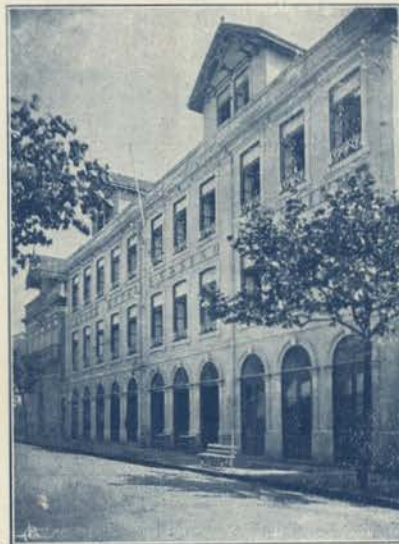
ESPINHO - GRANDE HOTEL E CASINO

Espinho, que o mar impetuoso, certa manhã de tormenta invadiu, derru-