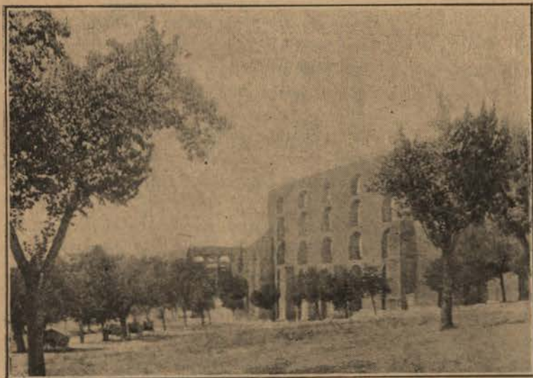
ELVAS—O AQUEDUCTO DA AMOREIRA

NÃO ha exactas noticias sobre a sua primitiva construcção: prova evidente da sua muita antiguidade. Ocupando o cume do monte em que a cidade está edificada, presume-se que teria sido um castro, que os phenicios, ou