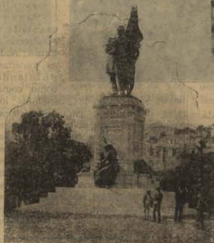
LISBOA - MONUMENTO A SÁ DA BANDEIRA

Isto é a vida intensa que Lisboa hoje oferece, como primeiro aspecto a qualquer observador. Poder-se-ha mesmo dizer que ele constitue o manto diaphano da fantasia com que encobre a nudez forte da verdade ; porque sous le balcon ha outros as-