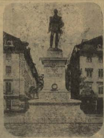
LISBOA - MONUMENTO AO DUQUE DA TERCEIRA

Sim. Tudo isso e mais alguma coisa, é que lhe dão atractivos que nos impellem insensivelmente para os seus folguedos, para a agitação febril e enervante dos dramas conjugaes e das