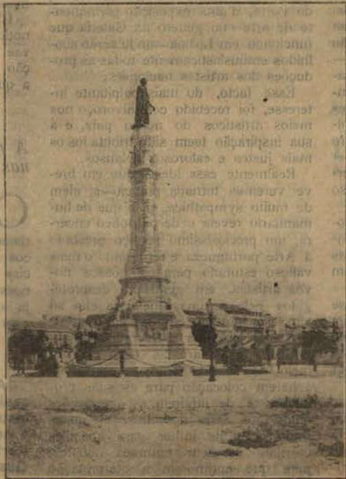
LISBOA — MONUMENTO A AFONSO D'ALBUQUERQUE

E' se bem que os interesses particulares sejam, até certo ponto, atendíveis, os geraes é que,