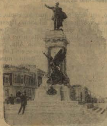
LISBOA - MONUMENTO A SALDANHA

palco imenso onde a astucia do homem, já attingindo um grau su-