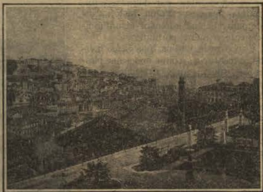
LISBOA - Vista tirada de S. Pedro d'Alcantara

palco imenso onde a astucia do homem, já attingindo um grau su-