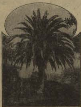
LISBOA — Jardim Botânico

Iluminando grandemente as paginas d'esta Revista, reproduzimos varios