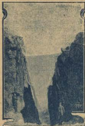
SERRA DA ESTRELA. — UMA GARGANTA

“E Padre Soeiro, com o seu guarda-sol sob braço, recolheu á Torre, vagarosamente, no silencio e doçura da tarde, rezando as suas Ave-Marias, e pedindo a paz de Deus para Gonçalo, para todos os homens, para os campos e casas adormecidos e para a terra formosa de Portugal, tão cheia de graça amavel, que sempre bemdita fosse entre as terras...”