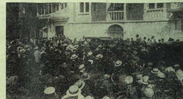
A manifestação popular em frente do palácio da presidência

A data de 5 de Outubro foi ruidosamente comemorada pela policia e juntas de freguezia. O povo político limitou-se a uma manifestação de simpatia ao