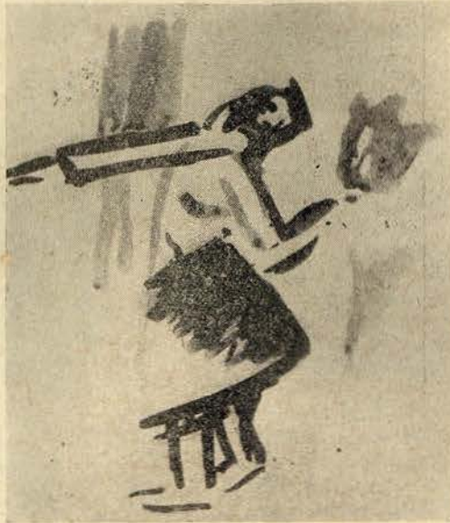
Mulher com uma tulipa Quadro de Aurel Bernath Exposição Der Sturm, de Berlim

A suposta arte moderna, exaltação do capitalismo, do industrialismo, do individualismo, — agoniza. O Salão de Outono, que acaba de inaugurar-se em Paris é disso a prova. A esse certame concorreram artistas da vanguarda vindos de todas as partes do mundo e a vasta produção artística que encerra não é mais do que a reabilitação da grande arte eterna, da grande arte classica — como afirmou um crítico — rejuvenescida pela impressão moderna.