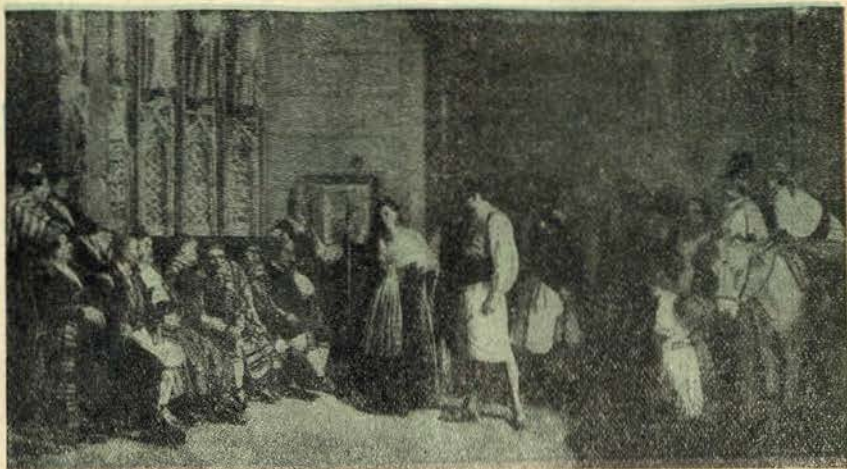
Tribunal das Aguas, por Ferrandiz (Museu de Bordeus)

Na mitologia, tambem a água teve cultos. Os árias afirmavam ser Varuna, o pai de todas as águas celestes e igual conceito faziam os irânicos da deusa Ardvicura. O gigantesco rio Nilo, segundo os egipcios, era navegado pelos deuses, e só os deuses conheciam os astros e as fontes da Terra. O Nilo servia também de leito a um deus bissexual. Os egipcios usavam das águas dêste rio para os seus ritos. Os germanos chamavam o senhor das aguas ao deus Nix, génio dos rios, arroyos e estanques. O culto, que os índios da América prestavam, significava que a água fecundava a terra. São numerosos os mitos dos gregos e dos romanos: Pontos, filho de Goa, personificava o mar, Níreos, filho de Pontos, o movimento das águas e