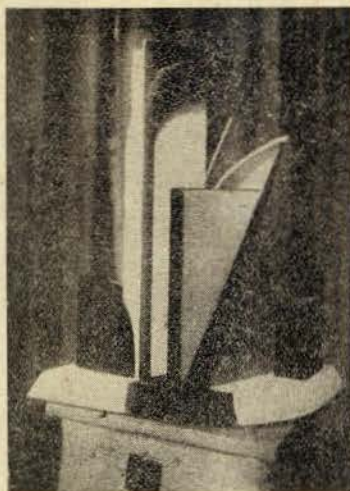
Plástica luminosa por Nicolaus Braun

Outro factor que impeliu o desvio da sensibilidade artistica, no sentido do disparate e do extravagante, do irrisório e do monstruoso, foi a hipertrofia da individualidade o excessivo egoismo disfarçado em egotismo, a ausência de ideias, mascarada de estranha misteriosa revelação... E os «artistas» aparentando um ridículo esoterismo passaram a ser todos subjectivos e deram-se a produzir mamarrachos como os que «ilustram» esta pagina.