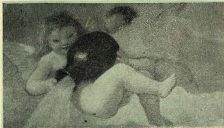
A Agua. Sobreporta do palácio Celesia, por Barabino (Genova)

Tornou-se bíblica a tortura desta cidade de paralelepípedos e lixo. No verão, dá-se ao pobre consumidor — água pela barba. A praga dos aguadeiros, que divinizam Carlos Pereira, caiu sobre a capital de um país sem civilização. Pedem nma fortuna por dez litros de uma água contaminada dos germens de tifo, extraída, em fontes impuras, de uma canalisação que cruza com os esgotos. Esgotados ficam os recursos do consumidor ao terceiro barril que o aguadeiro lhe impinja, e passa a apelar para o fogo, na ânsia de uma gota de água. Quando arde um predio, todo o bairro tem agua abundante — razão poderosa que pode levar o lisboeta a exigir