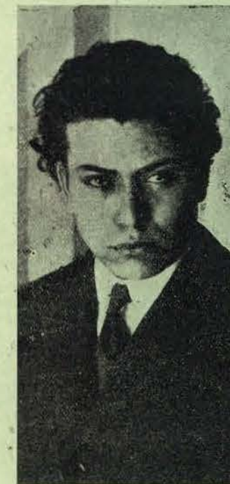
Ferreira de Castro

Spartacus. Neste livro, o autor apreciado de Carne Faminta , Êxito fácil , Sangue negro e Metamorfose , alicerça solidamente o seu lugar primacial entre os novos escritores, pela originalidade do seu temperamento e pela audácia dos seus conceitos filosóficos e sociais.