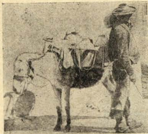
Aguadeiro cordovez (Espanha)

De resto, os aguadeiros são fontes principais das populações sem água e sem civilização. Que saibamos, os aguadeiros só medram na Espanha medieval, no Marrocos premievo, entre os nómadas do Cairo e de Jerusalém, no México e em Portugal. Nos países adiantados, nem sequer se vendem capilés ou copos com água. Em Lisboa, pois, os aguadeiros são as fontes publicas, mas o habitante é que escorre com uns atribulados escudos, se quere ter um pote cheio de água. As Águas Livres foram captadas por um gigantesco e inútil aqueduto que per-