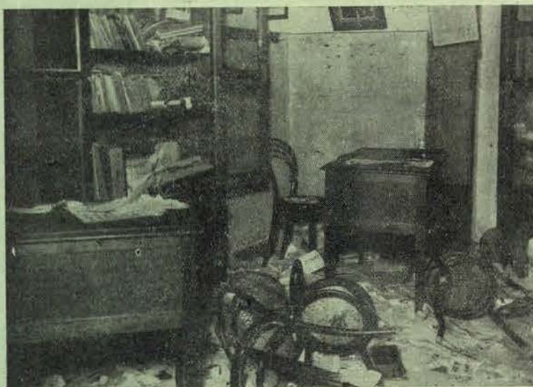
Os destroços causados pela polícia no gabinete dos Impressores tipográficos

Não foram, porém, só estes, que os leitores aqui vêem, os destroços cau-