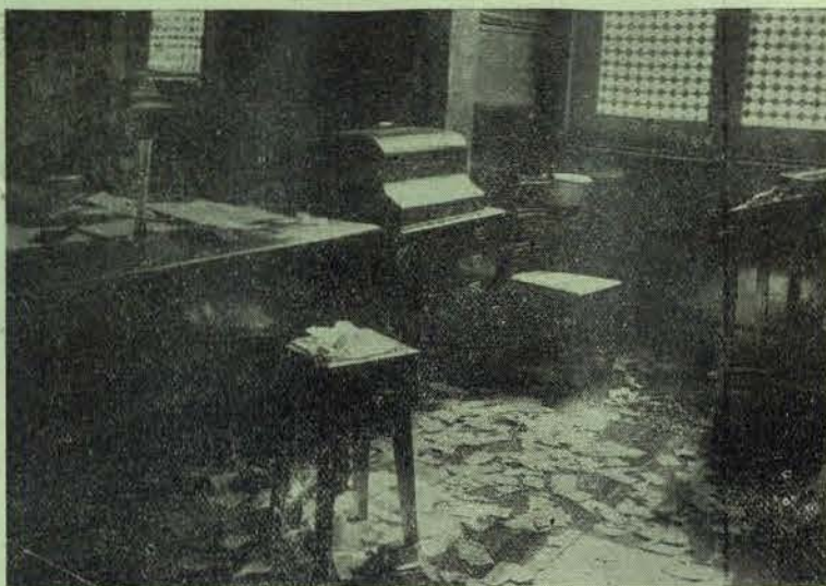
A devastação feita pela polícia no gabinete do Conselho Técnico da Construção Civil

Causou a maior indignação popular o assalto, sem nenhuma justificação, feito à sede da C. G. T. pela polícia que ali deixou da sua passagem os sinistros vestígios que estas gravuras mostram.