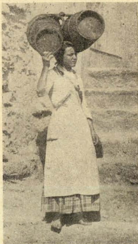
Uma aguadeira napolitana

corre o vale de Alcântara. A captação do Alviela, rio que nasce — contraste ironico — na serra da Mendiga, próximo de Santarem, não supre as necessidades da população de Lisboa. Fala-se, às vezes, no recurso das chuvas; mas quem está pedindo chuva, com vendaval desfeito de gente ardendo em cólera, são os altos responsáveis que mergulharam no sono de um suborno bem retribuido.