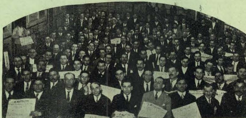
A assistência ao 1.º Congresso Confederal