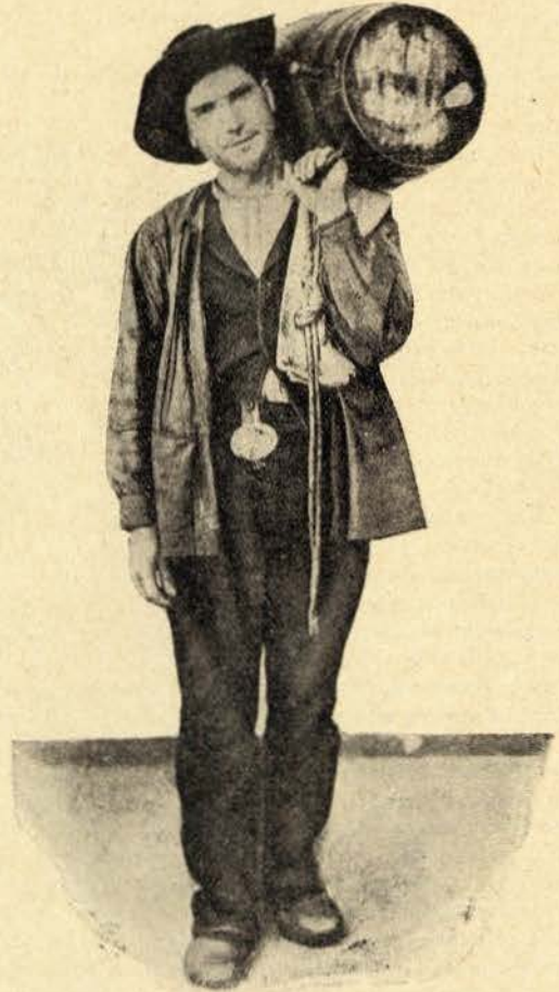
O aguadeiro português