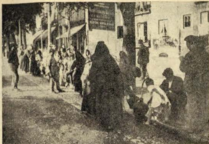
Bicha a uma fonte pública em Lisboa

que arda um bairro inteiro para que a cidade mate a sede e lave os pés, ao menos, uma vez na sua vida.