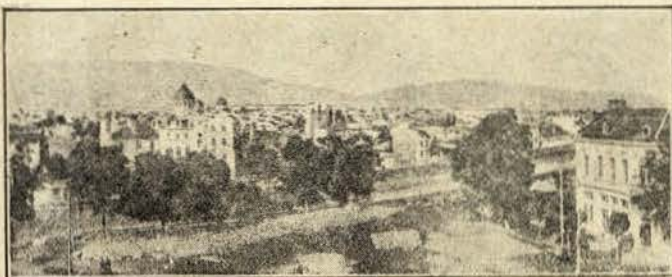
Uma vista de Sofia

A ignorância mais vergonhosa consiste em ter como verdadeiro o que se ignora, e o serviço que se pode prestar á razão é livrá-la de um erro.