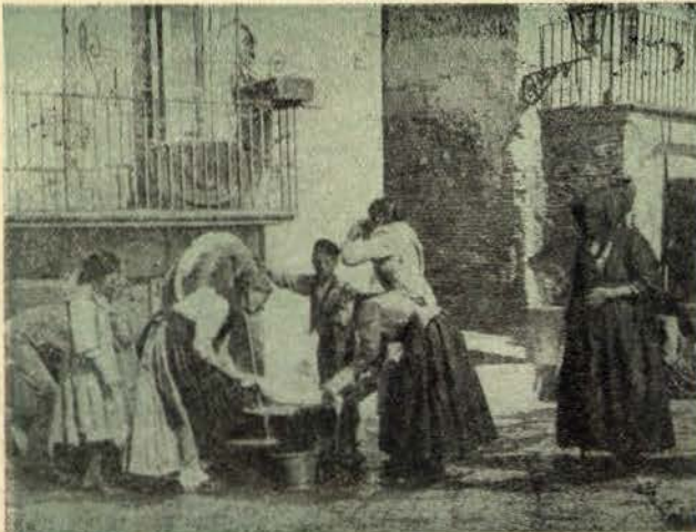
Num chafariz em Nápoles

de grossas quantias, que vão inundar, acima de todos os níveis, os cofres do potentado.