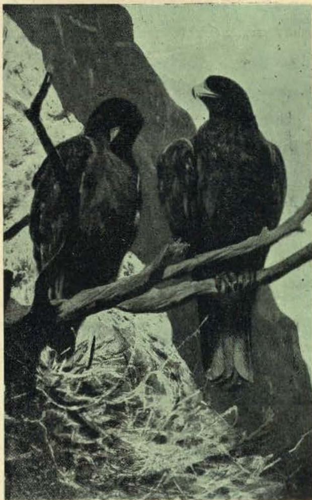
A águia real

ânciança de emanciparem o espírito, procuravam emancipar-se da própria espécie e tornavam-se pouco humanos. A fraternidade, aspiração ainda por realizar, fôra repudiada — e só o orgulho e altivez, cimentados por uma austera solidão, ba-