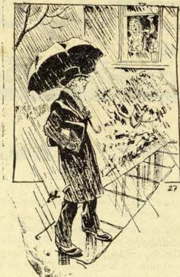
E' melhor voltares para casa maridinho. Vais estragar o guarda chuva novo.