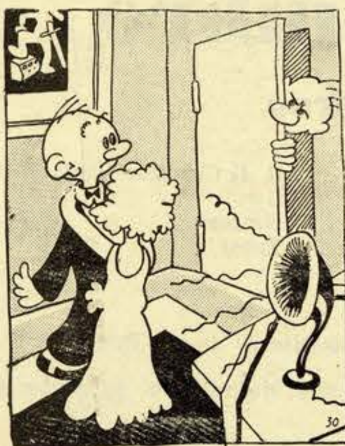
A voz do pai: Agora diz que estas dançando um tango.