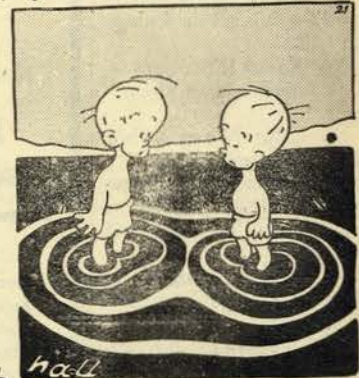
—A água está fria... —Está. Se não fosse a mamã proibir-me de tomar banho, nunca me tiuha metido nela.