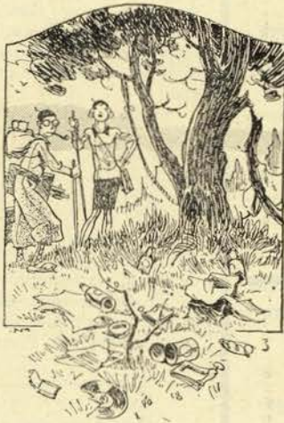
Ovalá que não nos tenho esquecido alguma coisa!...

tantes oito mancebos da selecção, tambem fizeram a diligencia por não acertar na borraeha.