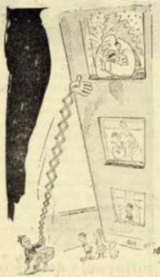
Novo processo de obter receita.