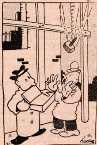
—Pôs para as dores de cabeça? Até agora foi coisa que nunca me doeu!