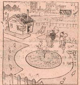
O jardineiro — Podem brincar no jardim mas não trepem á arvore, ontiram?

Pra sumana contulurraste. Ç idades é comprimentos. — ERRE ESSE.