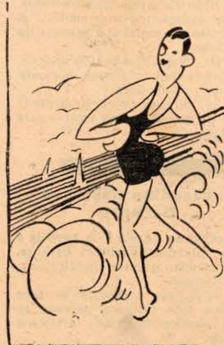
Gasparinho depois da fructa vai ao banho

Tem um «maillot» azul celeste, com reflexos doirados, que lhe fica a matar.