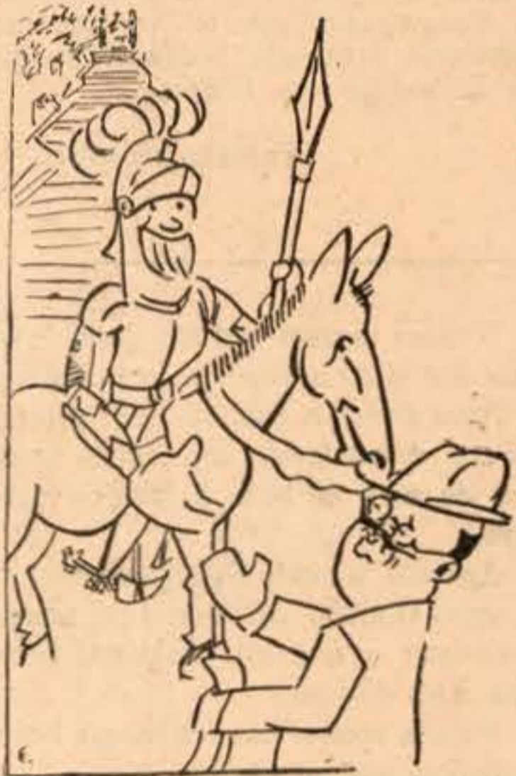
O Longinhos recebe-nos de lança em riste

Toca a meter dois colarinhos na mala, dois pares e meio de peúgas, um lençol para banho (que regressa virgem d'água...) uma escova para dentes, que também serve para o fato e para o calçado, um voluminho de prosa, o mesmo que se já levou no ano anterior, e com mais uns chinelos de liga que já não nos ligam nenhuma,—aí vai uma pessoa veraneiar, passear, aquar, flutuar, massajar e calotear por campos, termas e praias deste florido Portugal á beira-mar plantado... com o adubo químico da C. U. F.