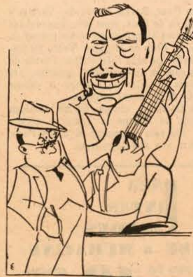
O Requite é a alma popular de Vizela

—«Ando assim macambúcio porque verifico que, de ano para ano, vai desaparecendo a mocidade alegre e viril que na minha casa se divertia até altas horas da noite. Os meninos d'agora são todos uns defuntos com cara d'enterro pago por a Associação de Socorros.