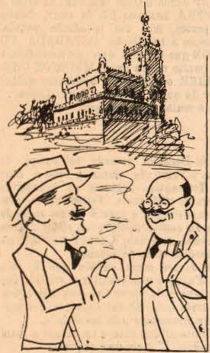
O Imperador dos Hotéis e o Csar do Turismo

Até ha quem confunda a Curia com a Cúria! Já vê de que força eles são!