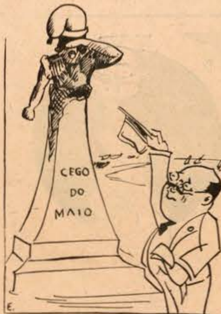
O Cego do Maio conhece o Pirolito de vista

Concordamos com o glorioso Cego e com os seus pontos de vista, abraçando-o comovidos numa despedida sincera e afectuosa.