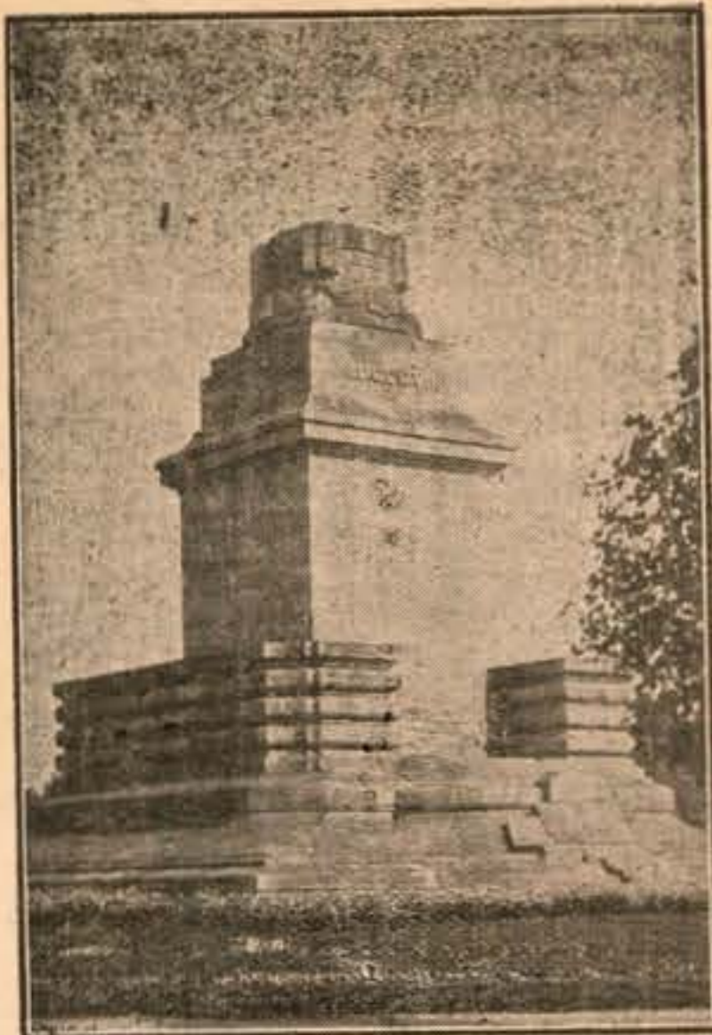
O Castiçal só, triste e pensativo

O que foi a cerimonia da sua inauguração, introdução e iluminação