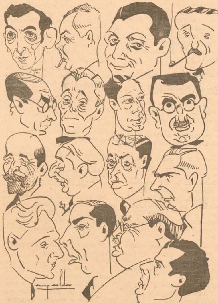
OS SOCIOS EFECTIVOS DO NOVO E FLORESCENTE ARROTARY-CLUB

Findo o almoço, foram aprovados por unanimidade os 132 pedidos de inscrição para sócios deste encantador Club, vindos dos mais afastados rincões da Peninsula Ibérica, tendo Sua Santidade enviado a benção apostólica.