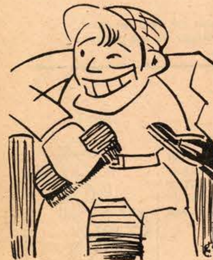
O REI DA GRAXA

A rapaziada da Graxa vai tambem ter a sua «Semana» e o seu Rei.