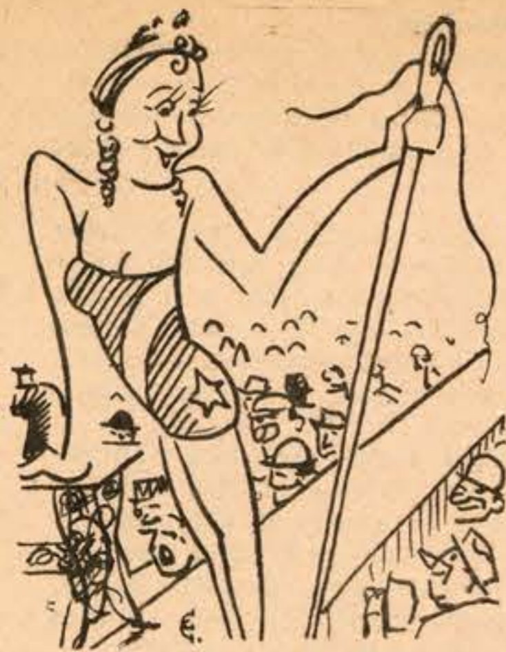
A RAINHA DA AGULHA

O nosso «Pirolito», rival do «Berliner Tagle-bate-que-bate», — a exemplo do que fazem os grandes periodicos estrangeiros que promovem maravilhosas festas, realizando «Semanas» que parecem mezes e concursos sem ursos e com ursos (mas com q'ursos!) — o nosso «Pirolito», repetimos, vai tambem tomar a iniciativa de promover na Invicta cidade da Tripa e do Castiçal deslumbrantissimas «semanas» e sensacionalissimos «concursos» :