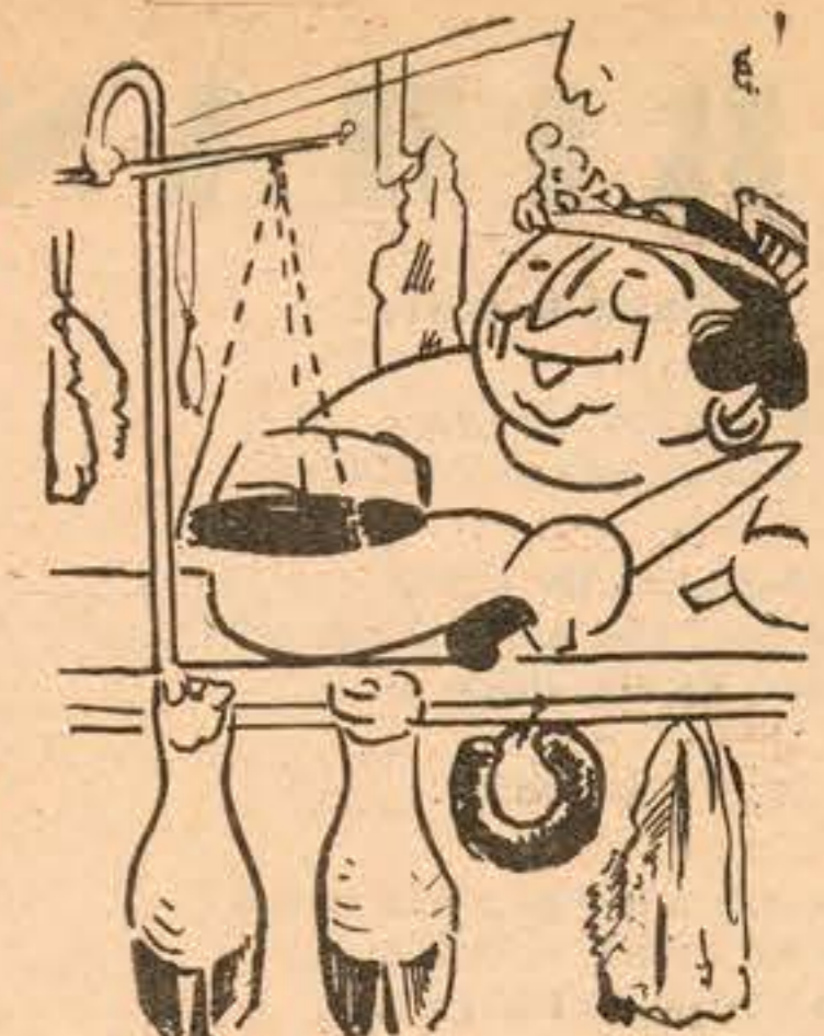
A RAINHA DAS FRESSUREIRAS