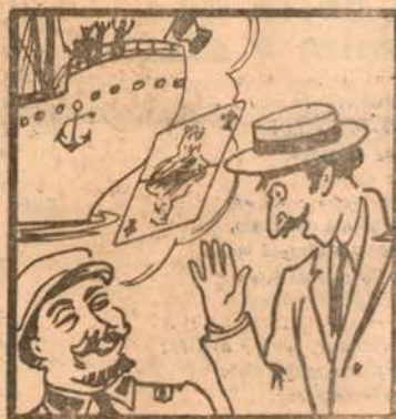
— «Pra que não haja quisitã, salto na dama em família!»