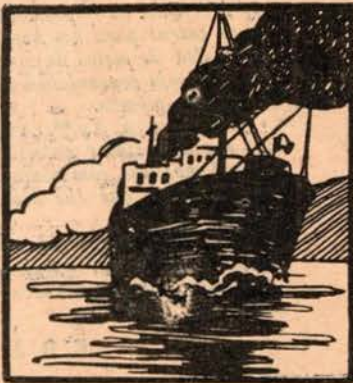
O vapor onde se joga, levanta ferro e já sega