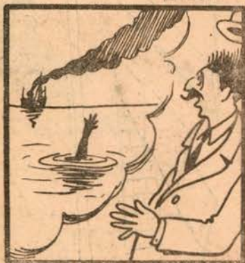
«Antes morrer afogado do que ficar depenado»