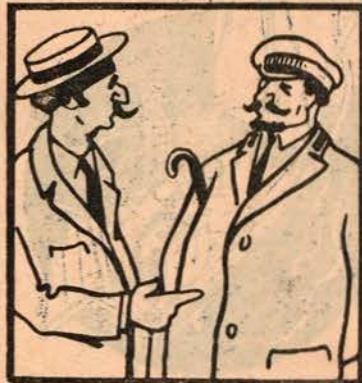
Um ponto perde o vapor; reponta co'o director