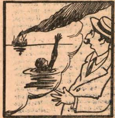
Foto como aquele ponto adelle-se a nado, e' id' prenda