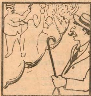
Nisto, a policia antipática faz uma rasga aquática...