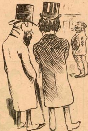
—Aquele tipo afirma que a criação do mundo foi obra dum sindicato.

Meu bom leitor, atenção! Vê se dás com isto tudo: A mulher tem-no na frente, Tendo-o algumas bem papudo.