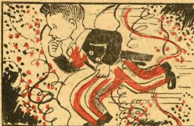
VII — Após tanta bisganada, muito furo, brada: — ah, sim?! e o Zeca corre ao jardim, levando a sua fisgada.