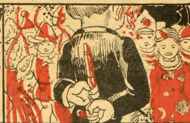
VIII — Dois minutos decorridos, volta de novo ao salão, com ar bastante pimpão, e modos muito atrevidos,