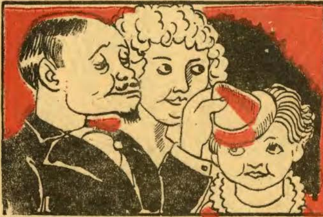
I — No grande baile infantil, no imponente palácio, do conselheiro Pancrácio e da Dona Eufrázia Gil,