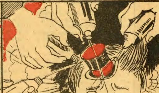
VI — Entre ditos e chataças, começam a bisnagá-lo. Nisto ele diz: — se me ralo, verão: — não sou para graças!