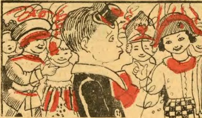
V — Assim tão mazombo, ao vê-lo, os restantes convidados, como são muito estouvados, combinam tirar-lhe o pêlo.