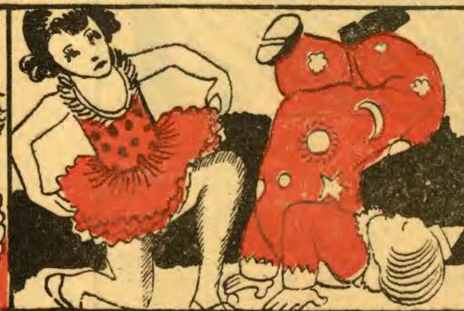
III — Mascarado de palhaço, dá cambalhotas o Juca, e, de bailarina, a Cuca dança com desembaraço.