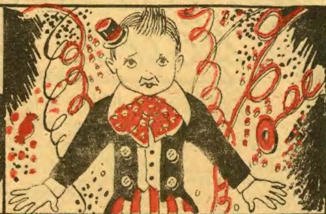
IV — O Zequinhas de Faz-Tudo tem vergonha e não faz nada; de expressãozinha amuada, mostra ser grande peludo.