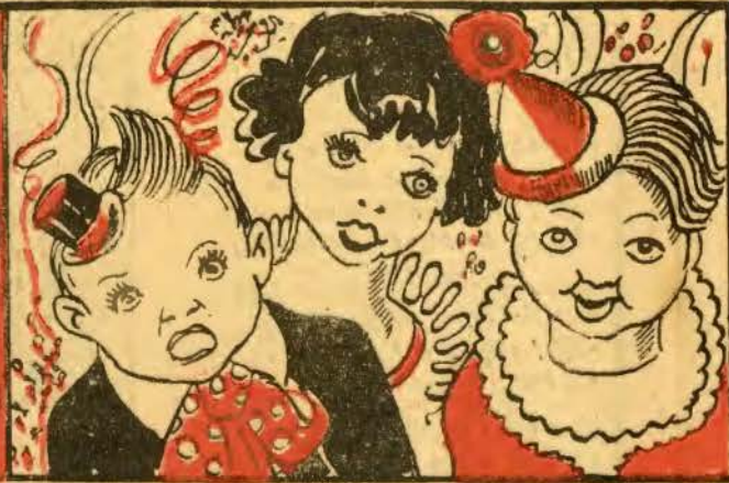
II — os filhos do Conselheiro, o Juca, a Cuca e o Zeca, que são levados da breca, fazem um grande berreiro.