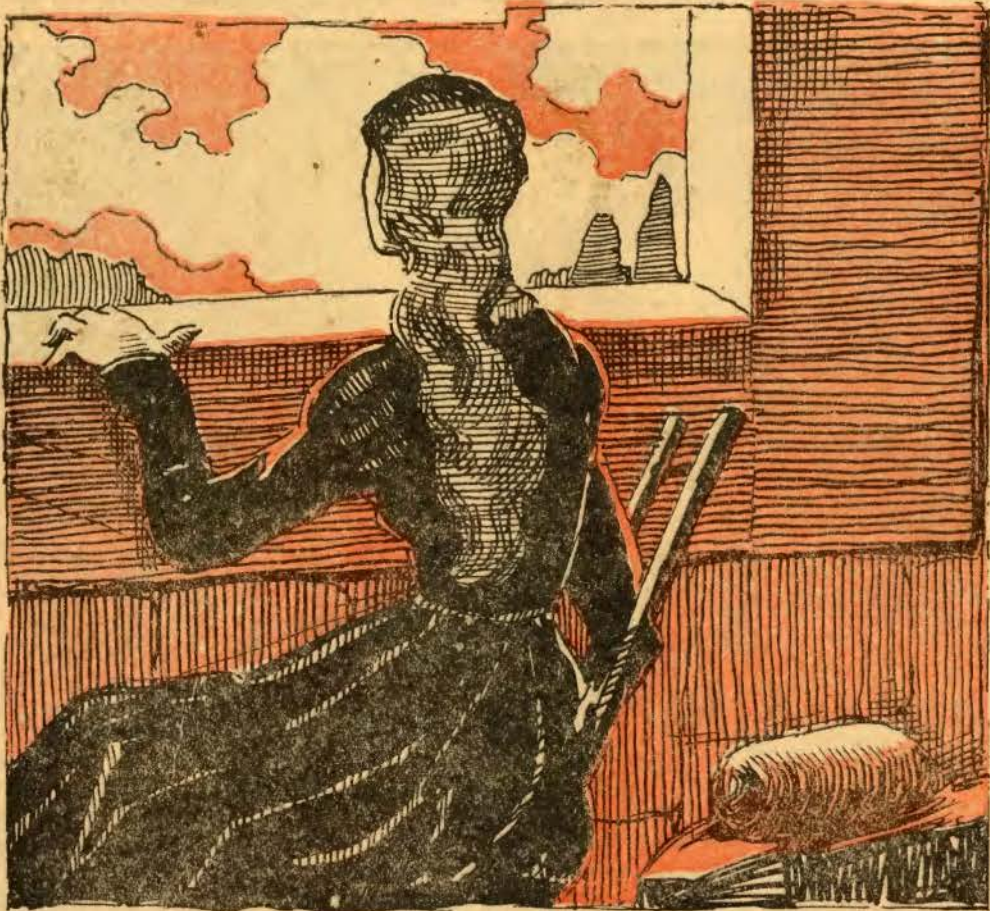
(Continuação da página 1)

lavadeiras dirigindo-se para o ribeiro que perto corria, acolá um grupo de garotos que, sem terem a noção do que praticavam, começavam a dispôr as armadilhas onde os pobres passarinhos viriam desastrosamente cair.