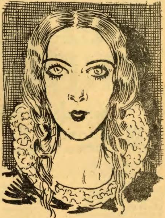
Onde está o avô desta menina?

Tenho dez amigos certos, com quem eu muito me dou; êles veem procurar-me, eu procurá-los não vou.