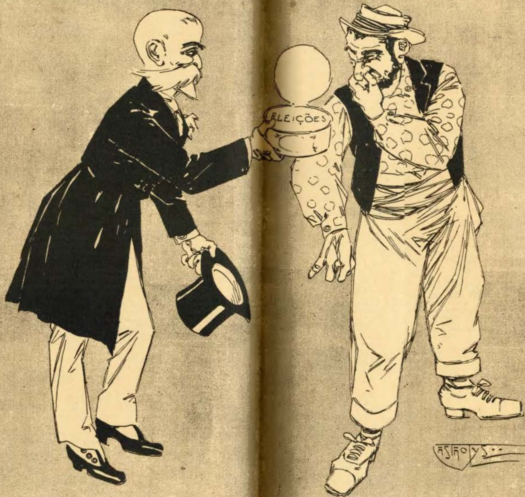
A BELLA MANTEIGA DE COURA — ZE: Comessa manteiga não como eu as minhas torradas...