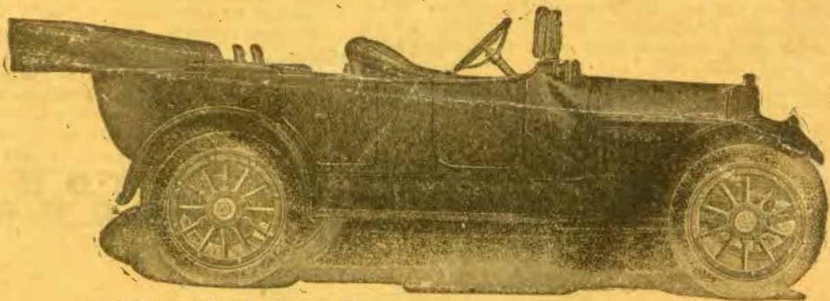
CADILLAC TORPEDO — 7 LOGARES — 40-50 HP

A CADILLAC MOTOR Co, fabrica 6 modelos de automoveis para 3-5-7 pessoas. Todas as peças, sem excepção, bem como as Carrosseries, são fabricadas nas suas vastas officinas com material de primeira ordem.