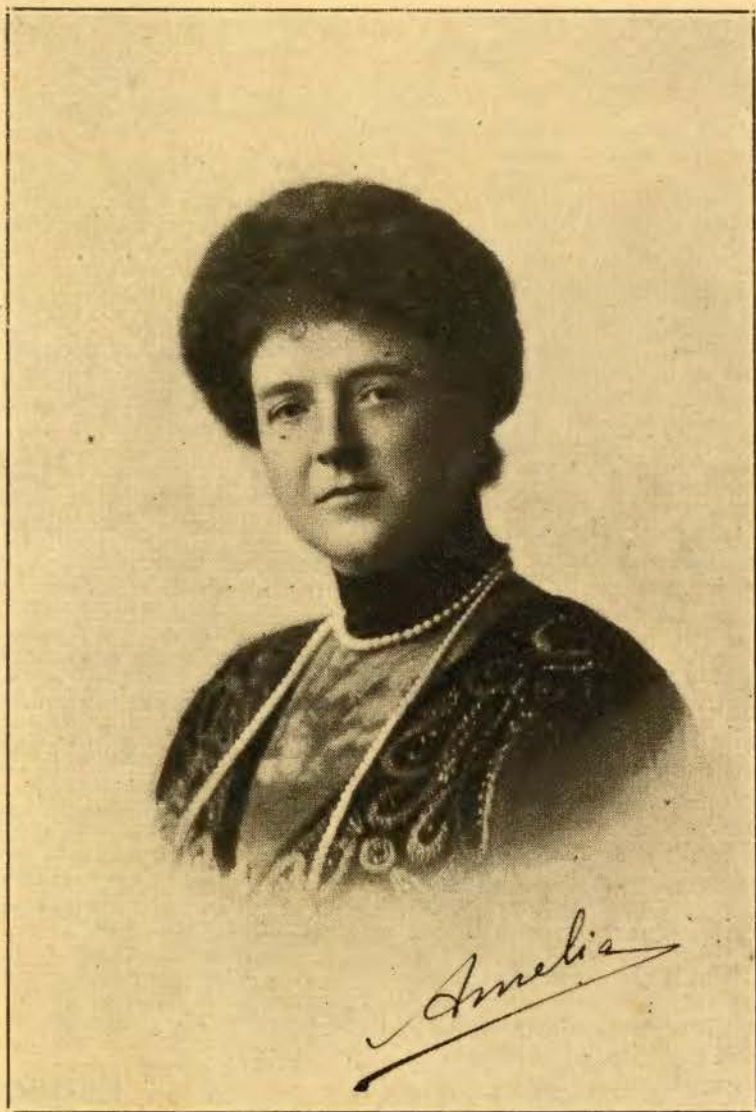
S. M. a Rainha D. Maria Amelia d'Orleans de Bragança