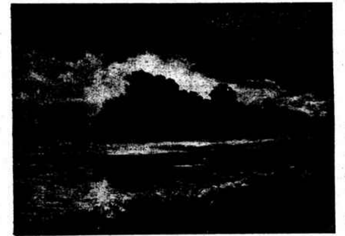
«ILLE-ET-VILAINE» (Redon) — Quadro de A. M. da Saude