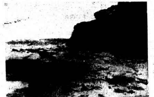
«TARDE NA PRAIA» — Quadro de A. Guedes