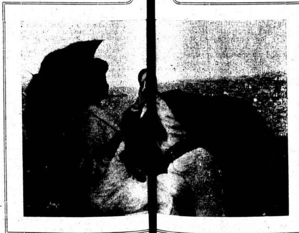
«ENCANTO» — Quadro de J. V. Salgado