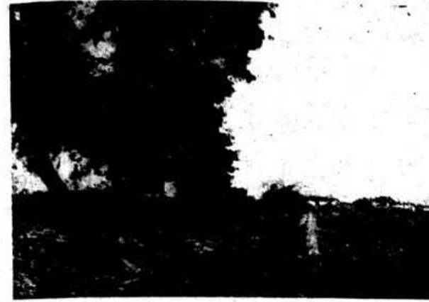
«SOL D'AGOSTO» — Quadro de João Reis