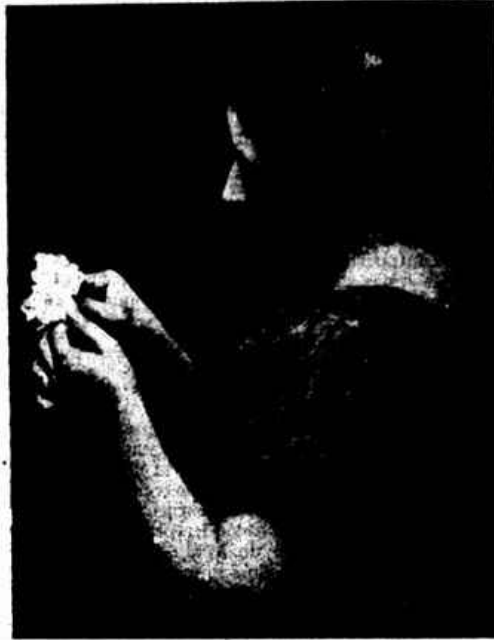
«FLORES» — Quadro de D. S. M. Ribeiro