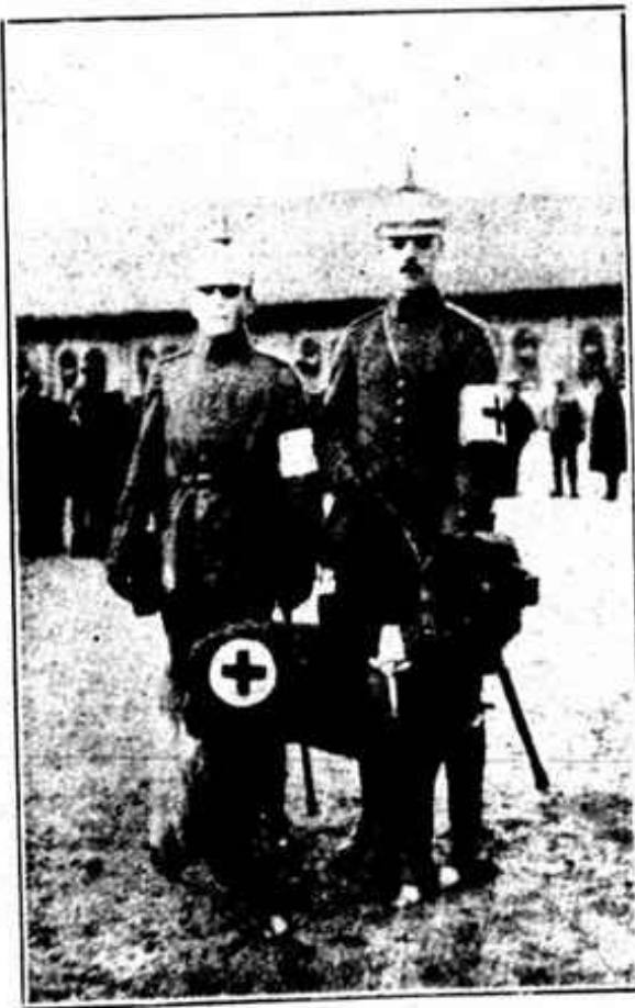
CÃO PERTENCENTE À CRUZ VERMELHA ALEMÃ, EQUIPADO CONVENIENTEMENTE PARA O SERVIÇO DA GUERRA

« Na estrada da vida » é uma obra que vem desvendar uma serie de verdades que todos deveriam conhecer. Todas as paginas revelam qualidades de fino escriptor e de profundo analysta. As sce-