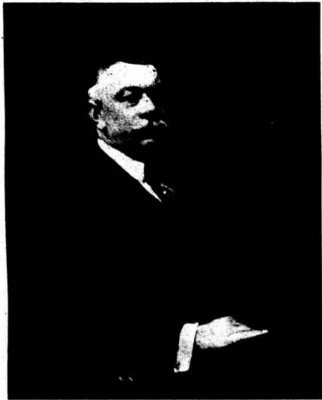
«RETRATO DO EX. mo SR. DUQUE DE PALMELLA» Quadro de Carlos Reis