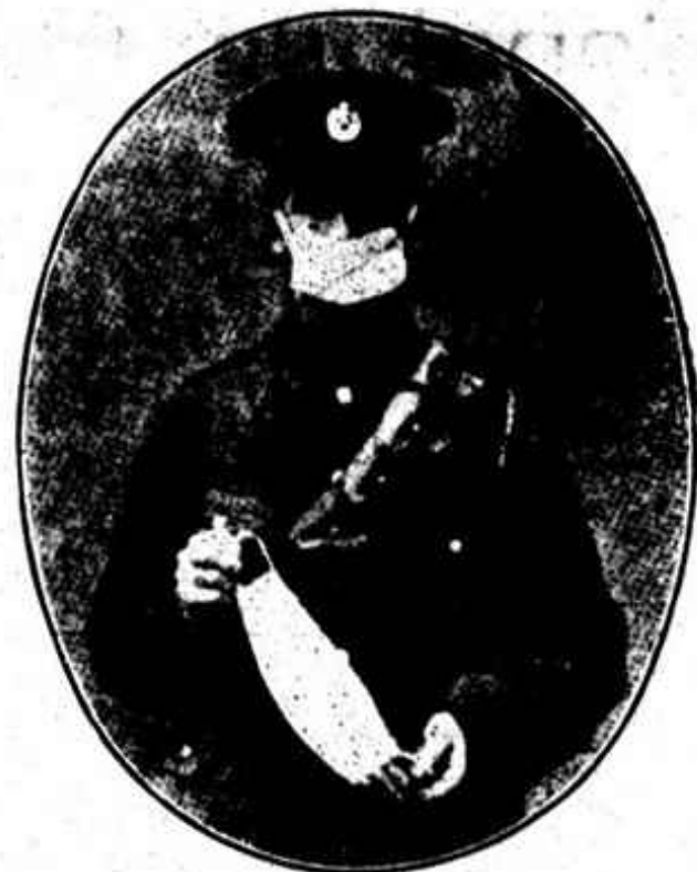
SOLDADO BRITANICO USANDO O APARELHO RESPIRATORIO CONTRA OS GAZES ASFIXIANTES

Mas voltemos a falar da nova contenda— a Italia. Ella reivindica o Tren-