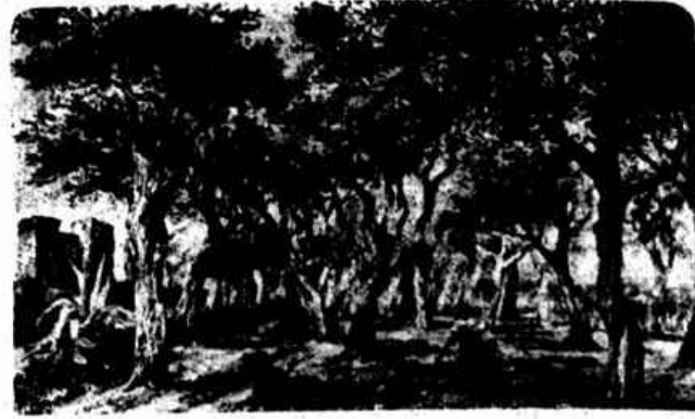
«VELHO OLIVAL DA JUNQUEIRA» (Paiol) — Quadro de R. Christino