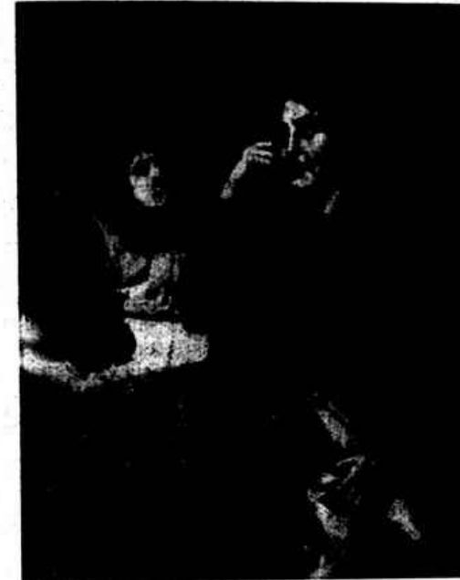
«QUANDO VEM O PAESINHO DA GUERRA?» Quadro de F. R. Esteves