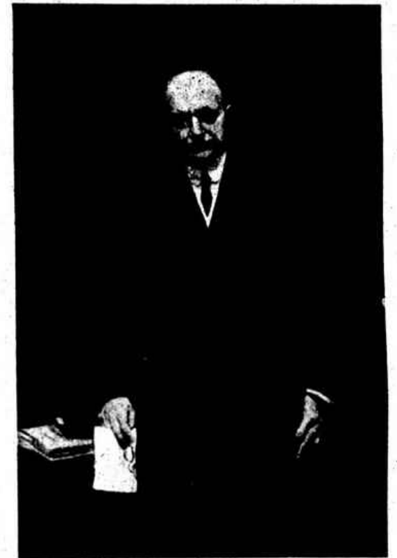
«RETRATO DE MEU PAI» — Quadro de L. de O. Burnay