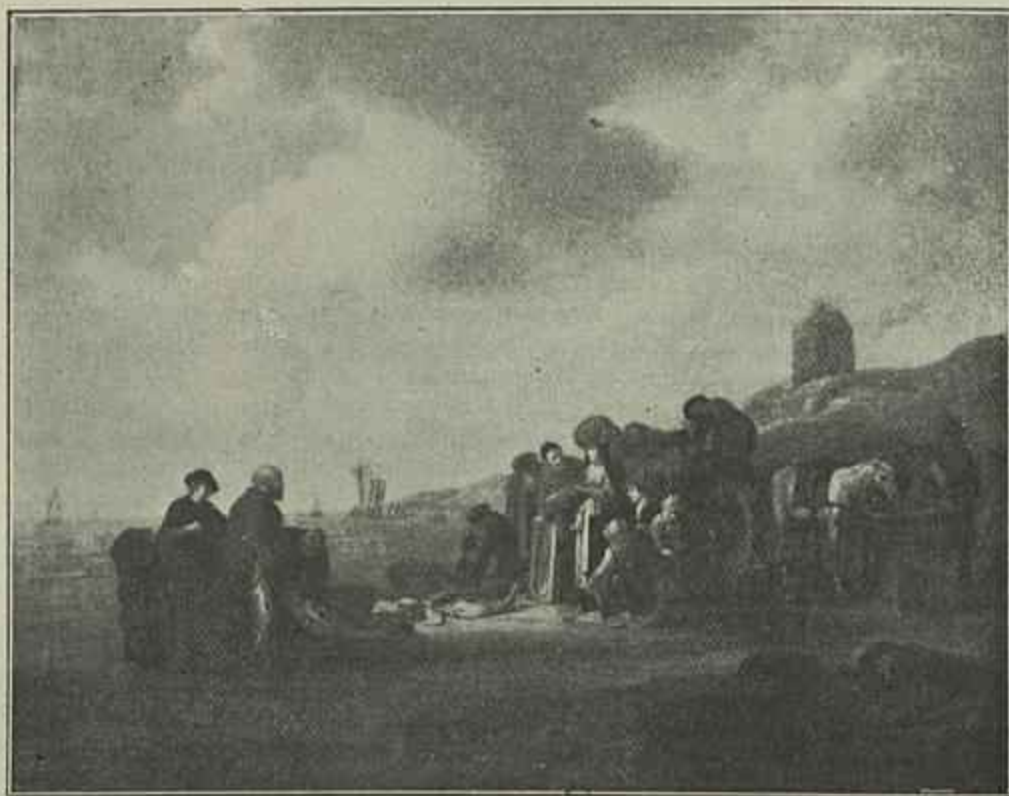
Mercado de Peixe