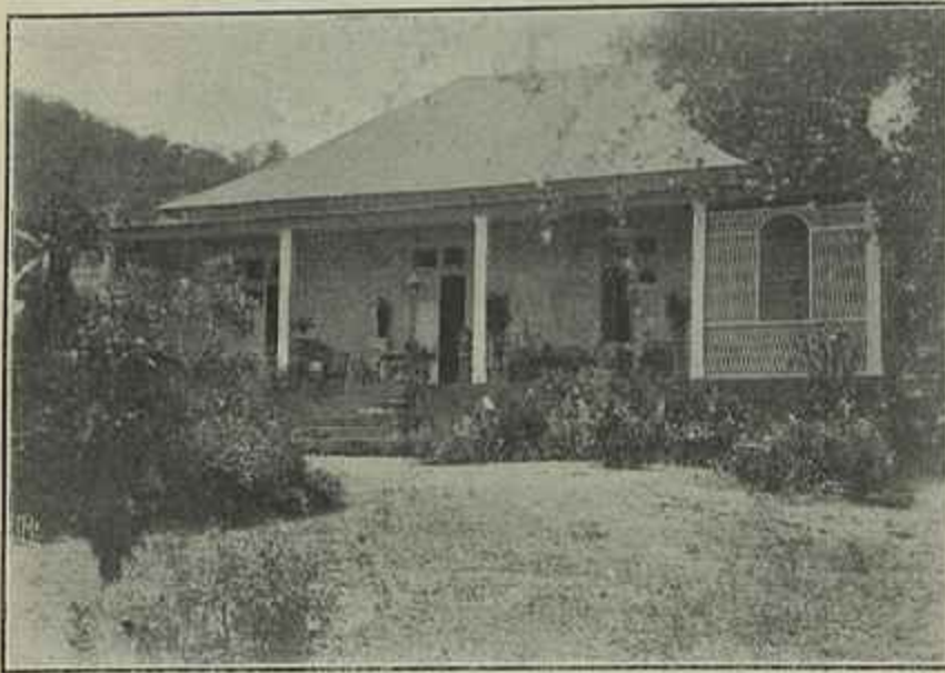
PALACIO DO GOVERNO DE TIMOR EM LAHANE— (Dilly)

Timor! aqui está um nome que faz apavorar os portuguezes!