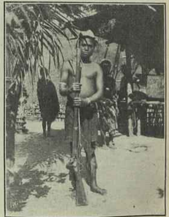
UM AUXILIAR INDIGENA

Mas no meio de tanta tristeza e miserias humanas, ha seculos acumuladas, a Natureza pa-