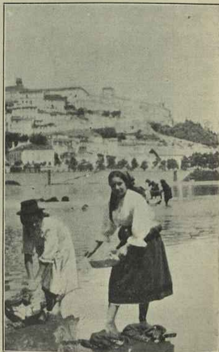
LAVADEIRAS NO MONDEGO (Coimbra)