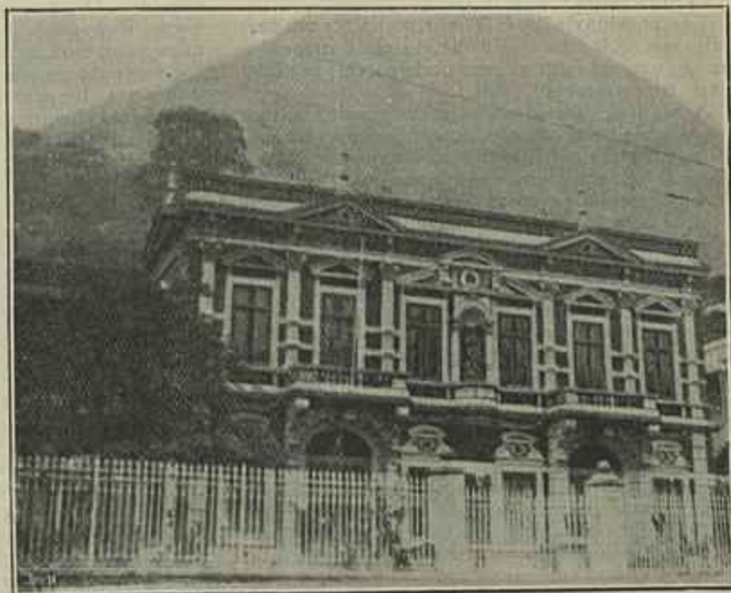
PALACIO DA EMBAIXADA PORTUGUESA, NO RIO DE JANEIRO