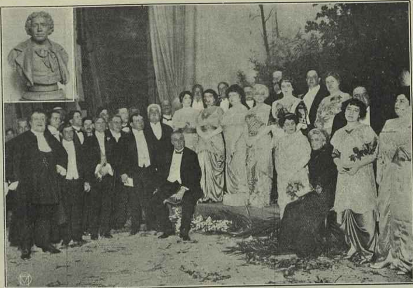
Busto de José Carlos dos Santos (Esculptura de Costa Motta Sobrinho)