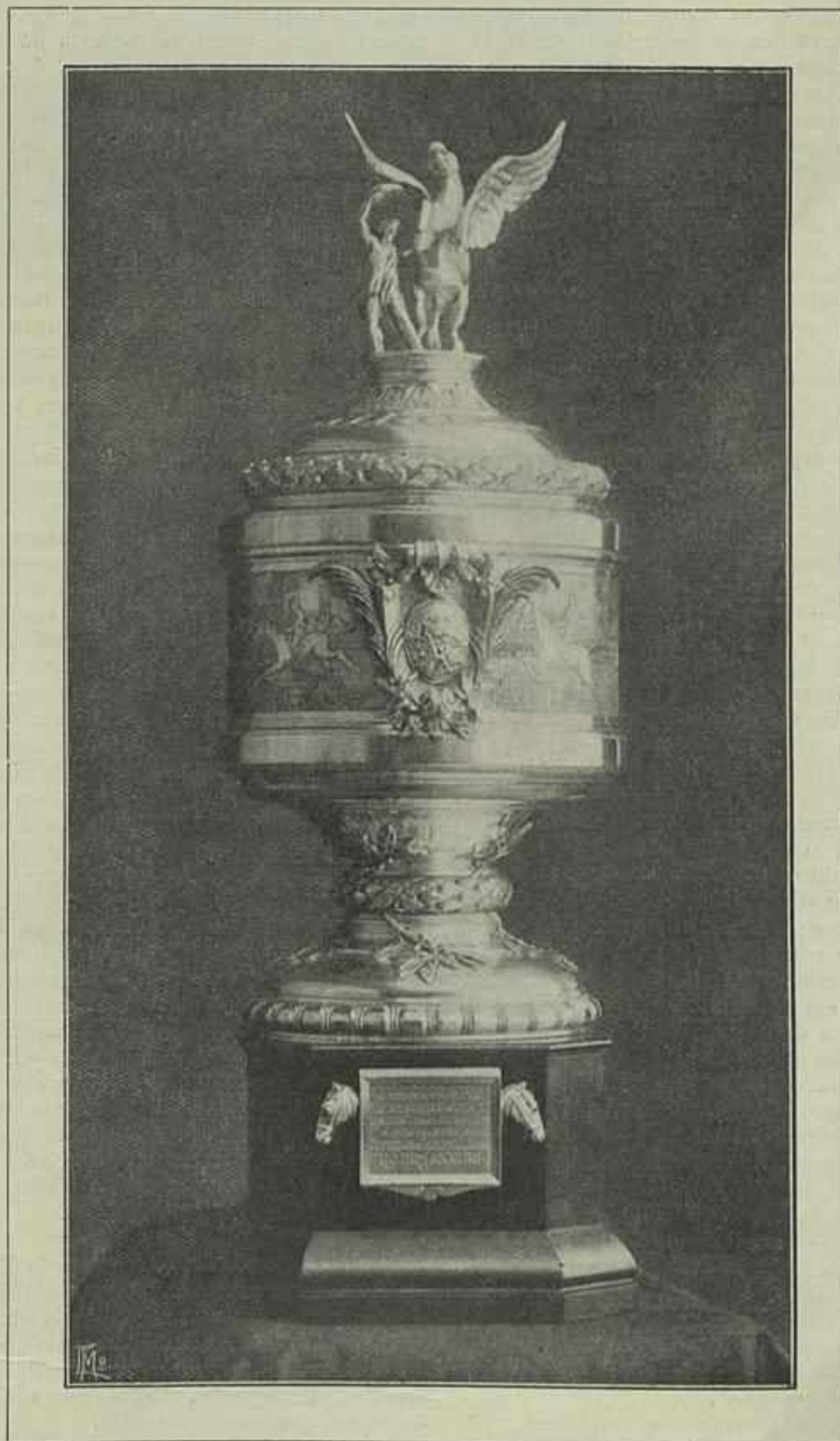
TAÇA DE HONRA OFERECIDA PELO JOCKEY CLUB DO RIO DE JANEIRO AO VENCEDOR DO PREMIO «ESTADOS UNIDOS DO BRASIL» NAS CORRIDAS DE BUENOS AYRES, A REALIZAR EM 19 DE JULHO DE 1914. (Executada nos ateliers dos srs. Leitão & Irmão, de Lisboa)

As alternativas desorientadôras do tempo contribuíram, por certo, em muito, nestes dias, para o apaziguamento mazor-