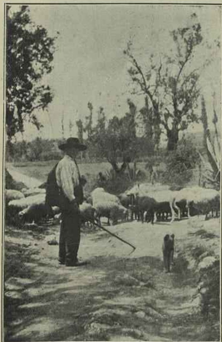
O REBANHO (arredores de Coimbra)