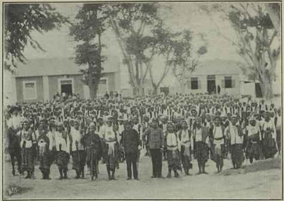
COMPANHIA DE BAUCOU EM PARADA, ANTES DE PARTIR PARA A CAMPANHA DE MANUFAHE (Dezembro de 1912)