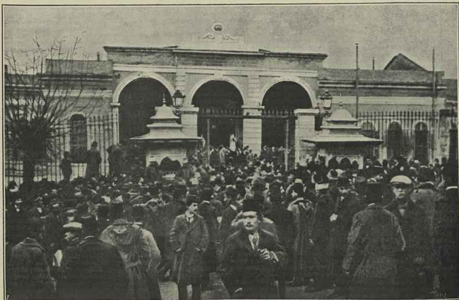
AS MANIFESTAÇÕES DOS JOVENS TURCOS EM FRENTE DA SUBLIME PORTA ONDE FOI ASSASSINADO NAZIM PACHA