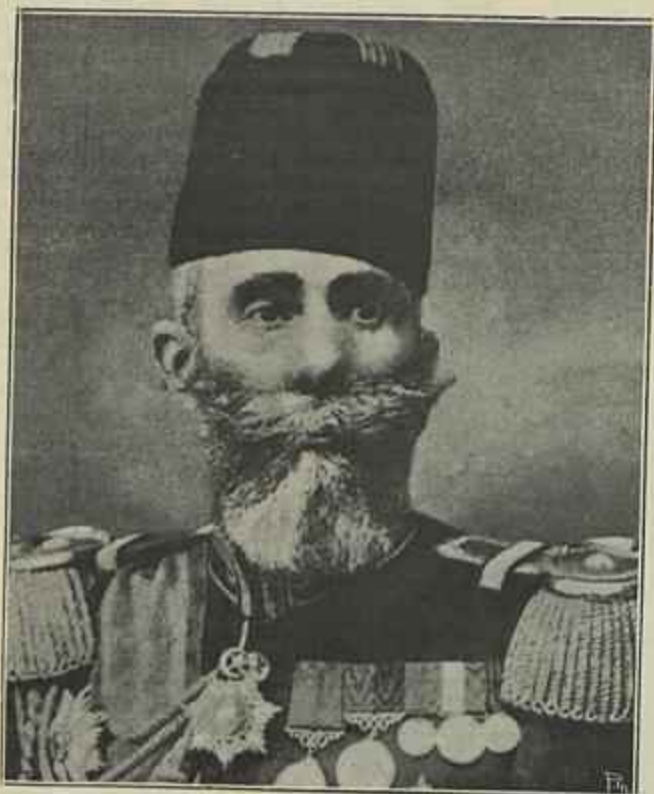
MAHMUD CHEVKET PACHA Grão-Viçir do novo governo e ministro da guerra