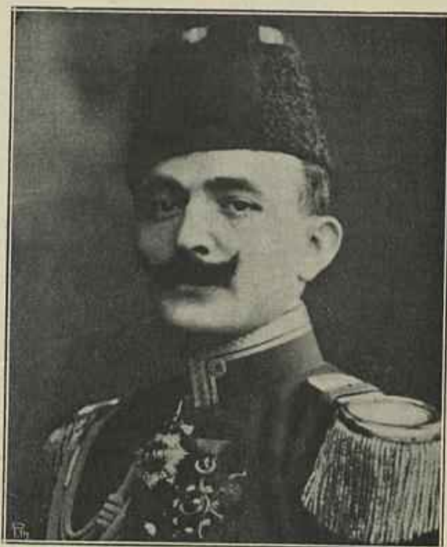
CORONEL ENVER BEY Chefe do movimento dos Jovens Turcos

Destas árvores da Liberdade existe ainda uma em Paris, no Aquario Louvosi, plantada em 1848, e cuja conservação o governo francês expressamente recomenda em seus decretos de proteção aos edificios, monumentos e sitios pitorescos.