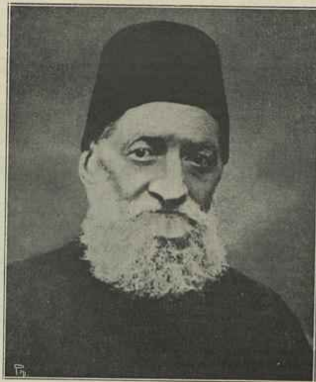
KIAMIL PACHA Grão-Viçir deposto pelos Jovens Turcos