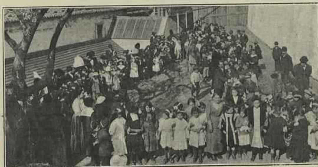
PLANTAÇÃO DA ARVORE PELAS CRIANÇAS DA PAROQUIA CAMÕES