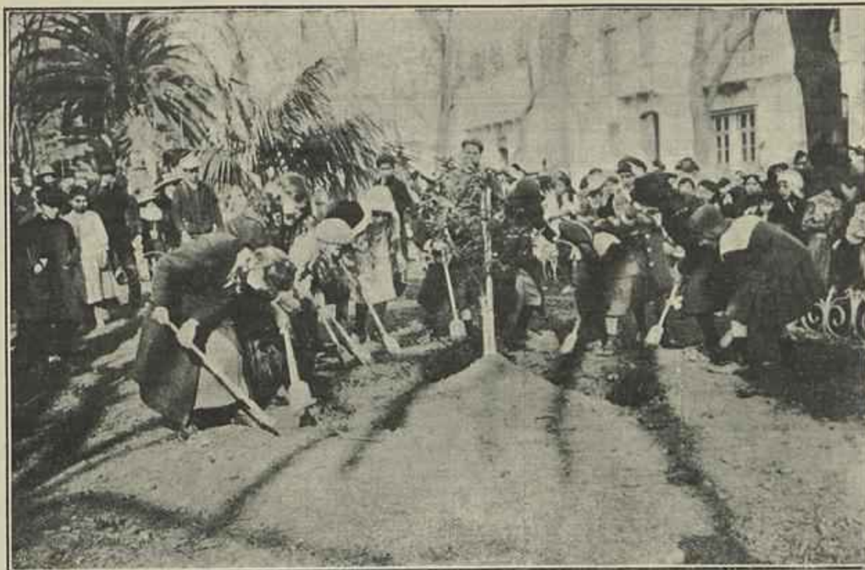
AS CRIANÇAS DAS ESCOLAS DE LISBOA PLANTANDO A ARVORE