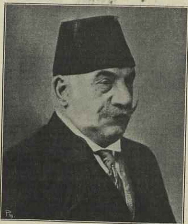
NAZIM PACHA Assassinado pelos manifestantes ao invadirem a sala do Conselho