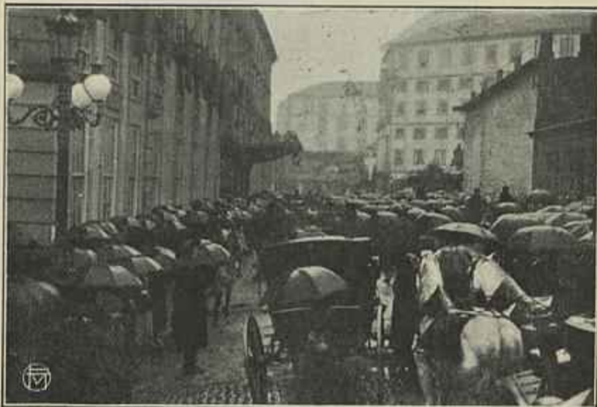
CHEGADA DE SUA EX.ª O PRESIDENTE AO PALACIO DA BOLSA

Foi no meio das mais calorosas aclamações que Sua Ex.ª regressou a Lisboa, eram 5 horas da tarde, acompanhado pelos srs. presidente do governo e ministro do interior.