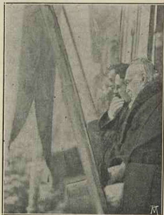
NO PORTO — A PASSAGEM DO CORTEJO NA PRAÇA DA REPUBLICA — SUA EX.ª O PRESIDENTE DR. MANUEL DE ARRIAGA, ASSISTINDO DUMA DAS JANELAS DA CAMARA, À PASSAGEM DO CORTEJO

as corporações da cidade, representadas por seus delegados, desde as scientificas até ás associações populares, flarmonicas e bandas regimentaes, batlhões voluntarios, e contingentes de forças militares. Este cortejo, organizado na praça da Republica, seguiu até o cemiterio do Repouso em continencia ao monumento das vitimas do 31 de Janeiro.