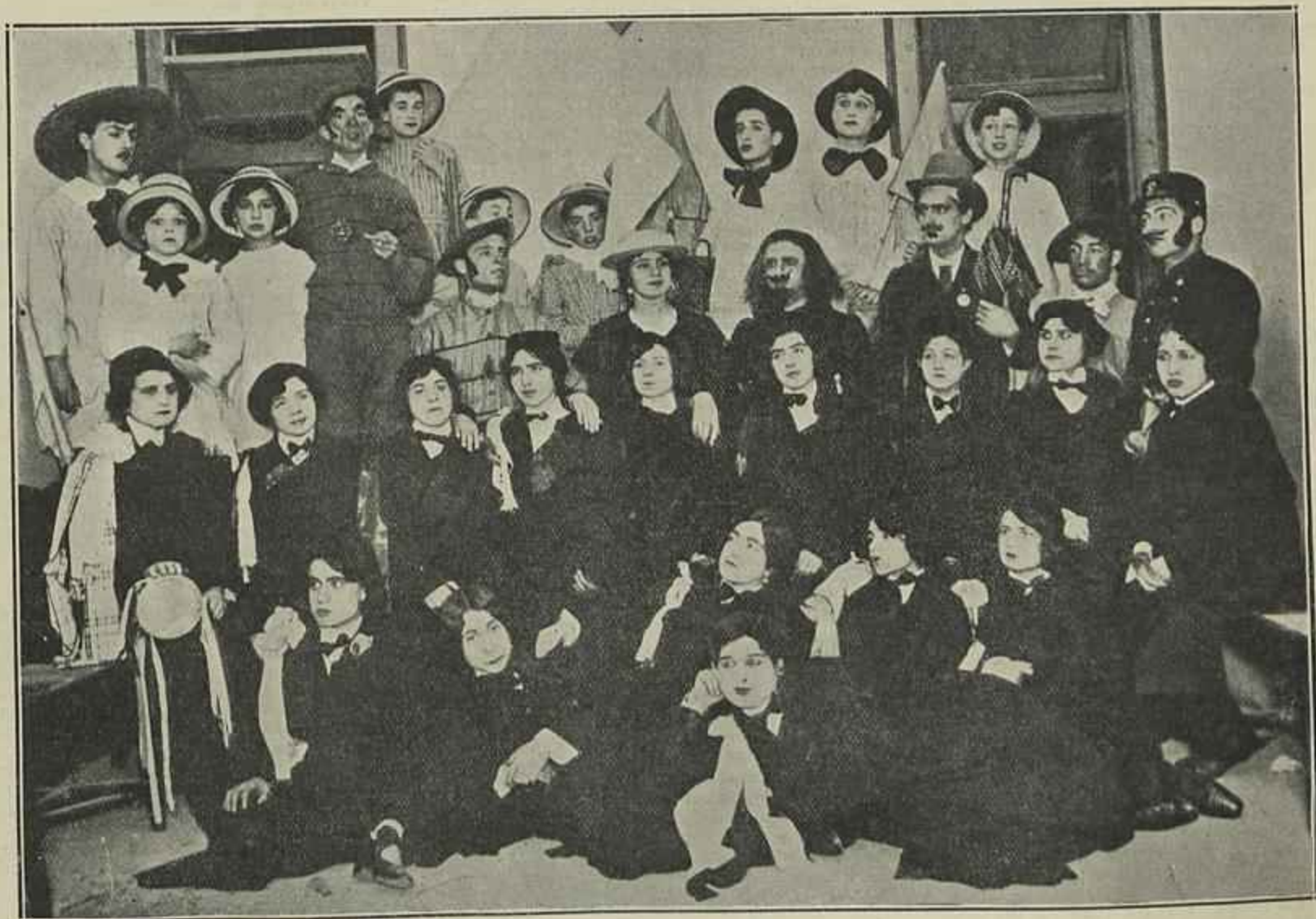
OS ALUNOS DA ESCOLA DE ARTE DE REPRESENTAR, NA PEÇA CARNAVALESKA «MEIA DESFEITA» — (Clichés A. Lima)

A maior parte da população veio para a rua gosar os lindos dias de uma primavera precoce, e saciar a curiosidade de ver as mascaras e as extensas filas de carruagens, automoveis e carros de toda a especie, enfeitados ou não, que desde o largo das Duas Igrejas desfilavam pelo Chiado, Rocio e Avenida até á Rotunda, numa continua