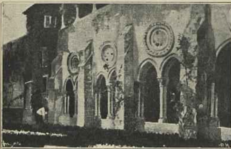
CLAUSTRO (SÉDE DE LISBOA)

Na opinião de Venizelos, a Grecia não pede territorios; exige apenas que seus filhos lhe entrem no seio, fazendo novamente parte do estado grego. As ilhas do Egeu são gregas desde os primeiros dias da sua historia e ficaram gregas desde a queda de Constantinopla. Actualmente ha naquellas ilhas 469.775 gregos, numa população de 498.585 habitantes, em que se comprehendem 4.158 judeus e estrangeiros e 24.652 musulmanos. Os habitantes das