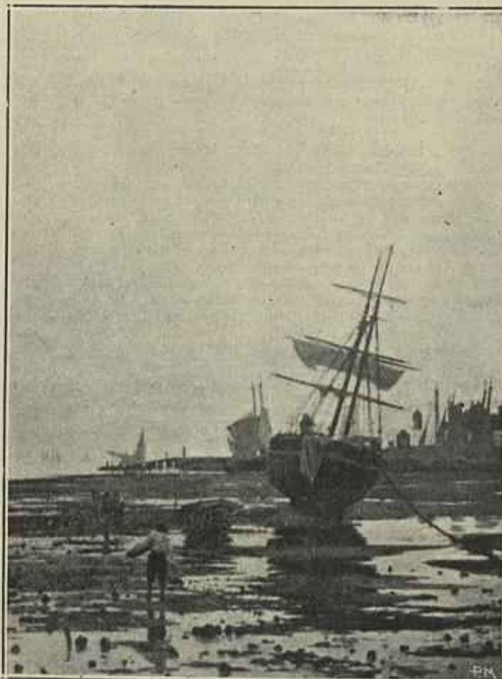
O VELHO CAES (SETUBAL)

5.º A Grecia quer viver em boas relações com a Turquia e em duradoura paz com os seus visinhos da Asia Menor, podendo assegurar a paz em taes regiões.