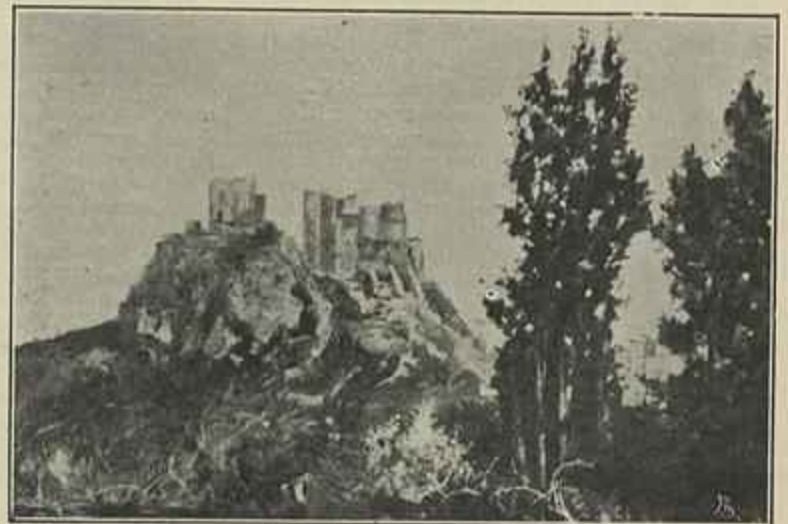
CASTELO DE LEIRIA

ultimo minarete da mesquita, depois de se ter prevenido contra uma queda fatal por meio d'umas azas ligadas aos hombros O engenho falhou, e o pobre Sinan morreu esphacelado no solo.