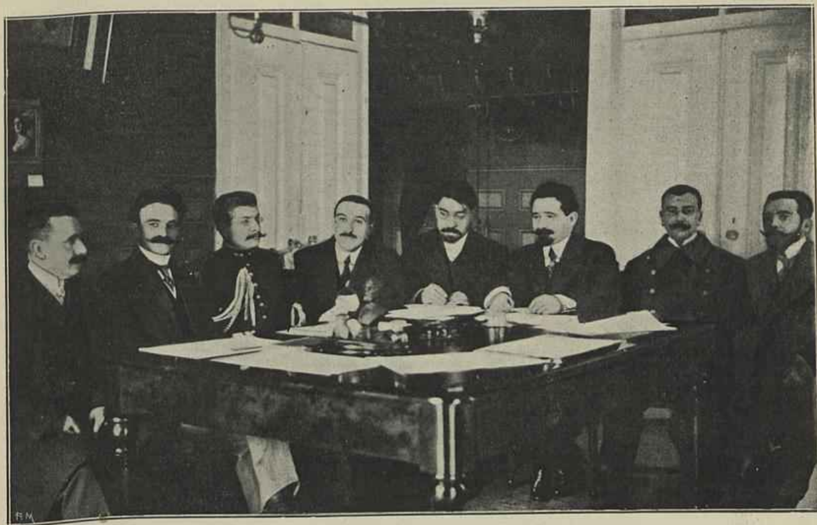
Da esquerda para a direita — Dr. Almeida Ribeiro, ministro das colonias; Dr. Antonio Macieira, ministro dos estrangeiros; Major Pereira Bastos, ministro da guerra; Capitão Dr. Alvaro de Castro, ministro da justiça, Dr. Rodrigo Rodrigues, ministro do interior; Dr. Afonso Costa, presidente e ministro das finanças; Freitas Ribeiro, ministro da marinha; Antonio Maria da Silva, ministro do fomento.