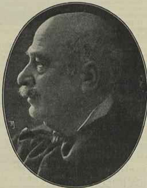
EDUARDO GARRIDO, EM 1908

A serie dos grandes successos que alcançaram os seus trabalhos começou pela Pera de Satanaz e Pomba dos ovos d'ouro , que obtiveram no theatro de Varietades o mais brilhante resultado.