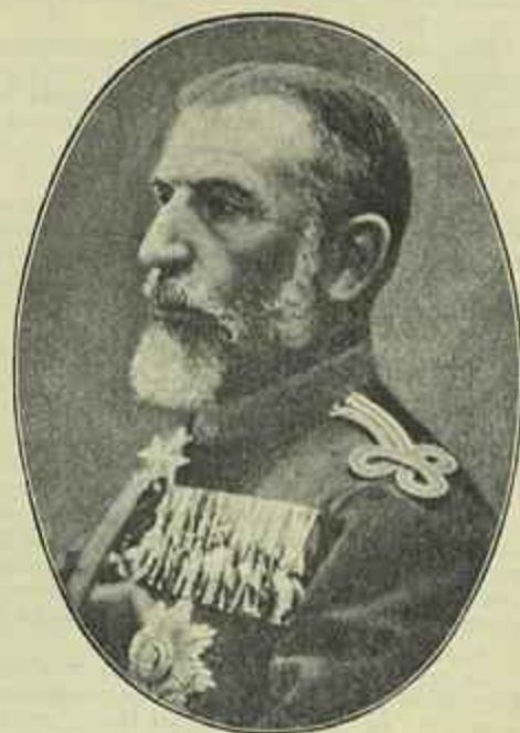
CARLOS I DA ROMANIA

Pedro I rei da Servia, nasceu em 1844 e foi coroado em 1904 — Fernando I rei da Bulgaria, nasceu em Vienne em 1861 e foi proclamado rei em 1887. — Jorge I rei da Grecia, nasceu em Copenhague, em 1845, filho segundo do rei Cristiano IX da Dinamarca, proclamado rei em 1863. — Nicolau I rei do Montenegro, nasceu em 1841, proclamado principe em 1860 e coroado rei, em 1910. — Carlos I rei da Romania, nasceu em Sigmaringen em 1839, principe de Hohenzollern, proclamado rei, em 1881.