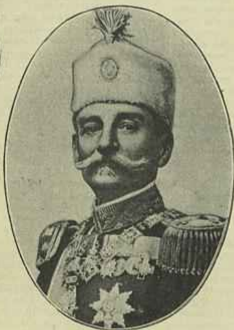
PEDRO I DA SERVIA