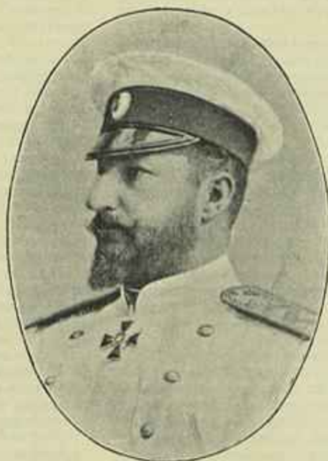
FERNANDO I DA BULGARIA