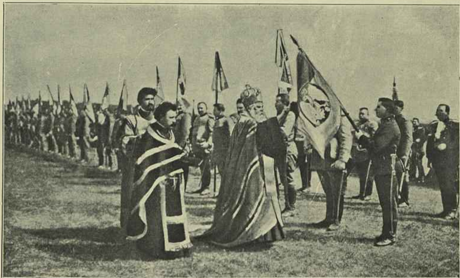
BENÇÃO DAS BANDEIRAS DO EXERCITO SERVIO ANTES DE PARTIR PARA A GUERRA

da Turquia, o entendimento dos christãos da Macedonia foi seguido d'uma approximação dos governos de Athenas, Sofia e Belgrado, separados até então por esperanças contradictorias.