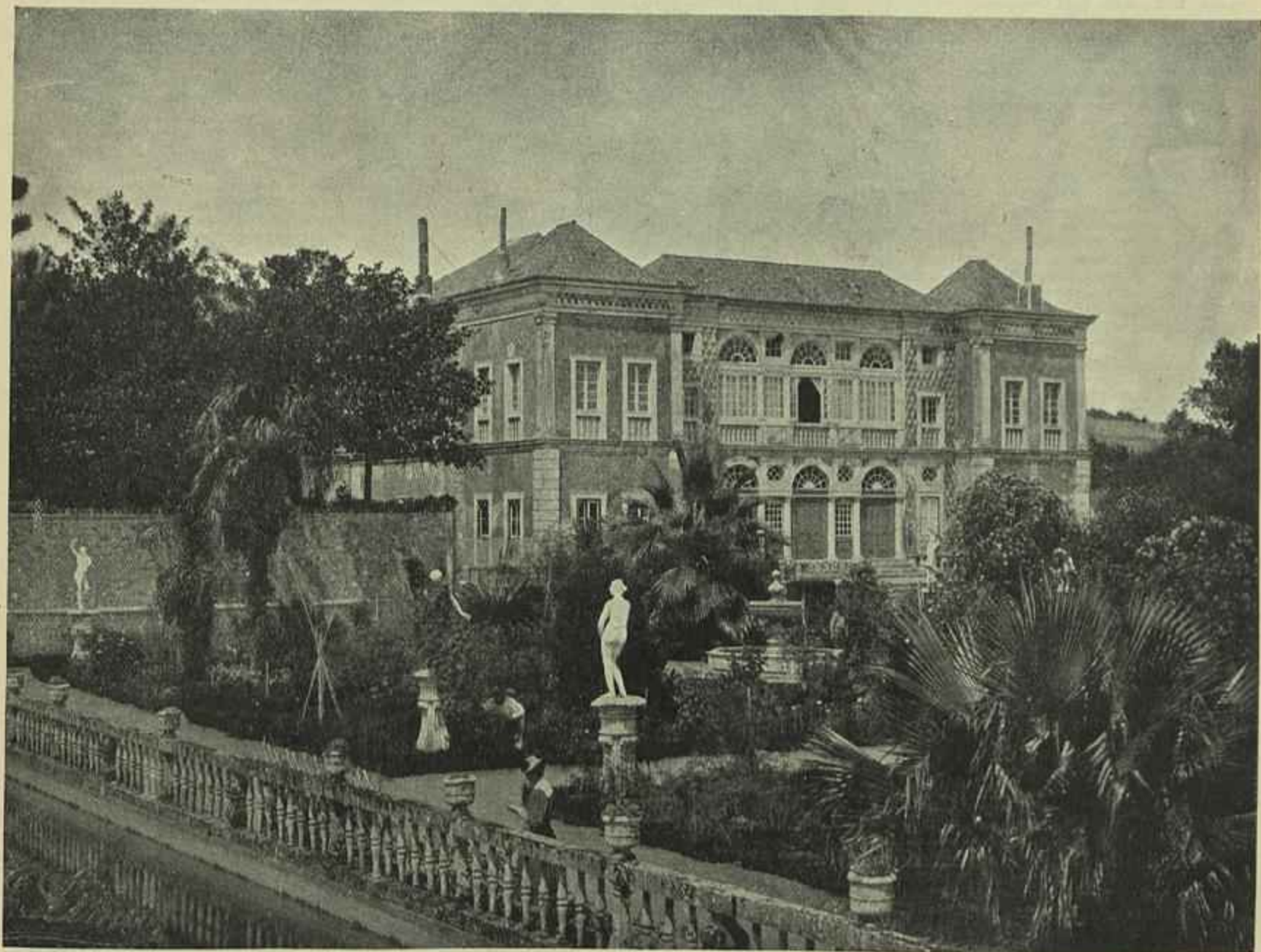
PALACIO DOS SRS. MARQUÊSES DE FRONTEIRA, EM BEMFICA

Sazonoff, ministro dos estrangeiros da Russia, Poincaré, presidente do conselho e ministro dos estrangeiros da França, e o conde de Berchtold, ministro dos estrangeiros da Austria, esforçam-se para impedir que se declare a guerra; mas o facto tem de consummar-se. No dia 30 de setembro os quatro países da liga baltica mobilizam os seus exercitos. A 1 de outubro a Turquia mobiliza o seu. No dia 2 as grandes potencias fazem, nas capitães dos estados balticos, representações a favor da paz; a 3 é apresentado