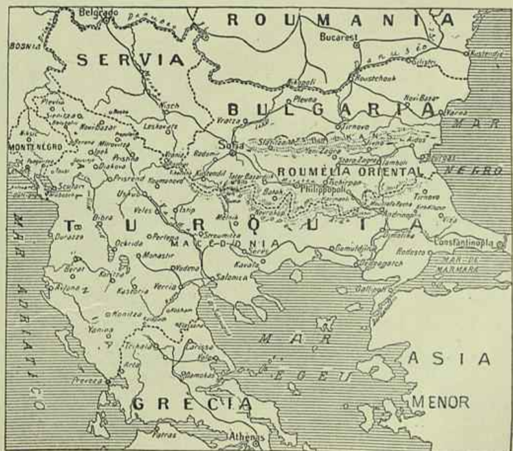
MAPA DOS ESTADOS DOS BALKANS E TURQUIA ONDE SE ESTÁ FERINDO A GUERRA

E' a partir d'esse momento, e sobretudo em 1911, que se produziu um facto consideravel e absolutamente novo na historia da questão da Macedonia. Foi a união dos christãos. Desde o momento em que elles adquiriram a certeza de que lhes era impossível contar para o futuro com um entendimento com os Jovens-Turcos, Servios, Gregos, Bulgaros; comprehenderam, além d'isso, que a lucta de propaganda nacional entre elles estava exgotada, visto que cerca de 150.000 Sla-