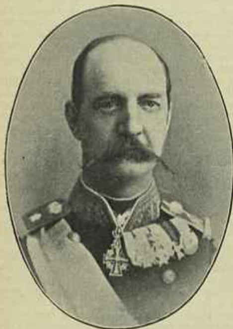
JORGE I DA GRECIA