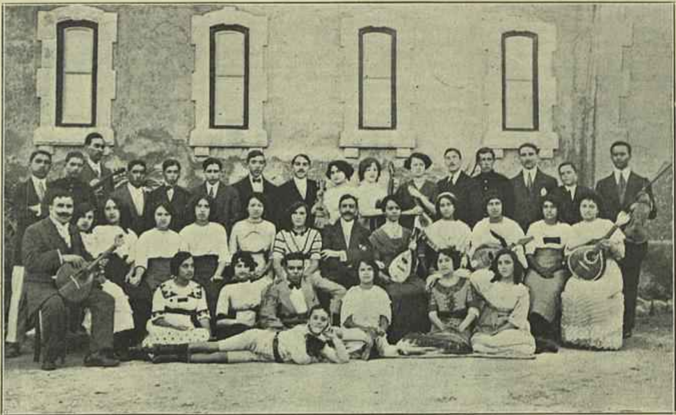
UMA FESTA NO CLUB DA POÇA DE S. JOÃO DO ESTORIL — GRUPO DOS AMADORES QUE TOMARAM PARTE NA RECITA E CONCERTO