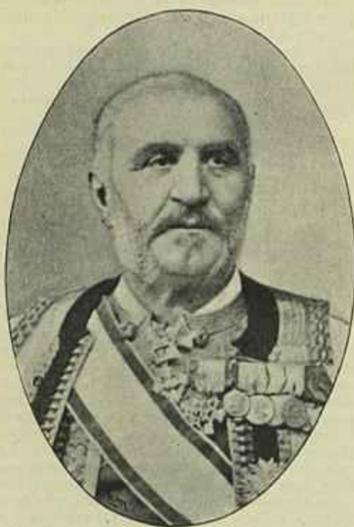
NICOLAU I DE MONTENEGRO SOBERANOS DOS BALKANS