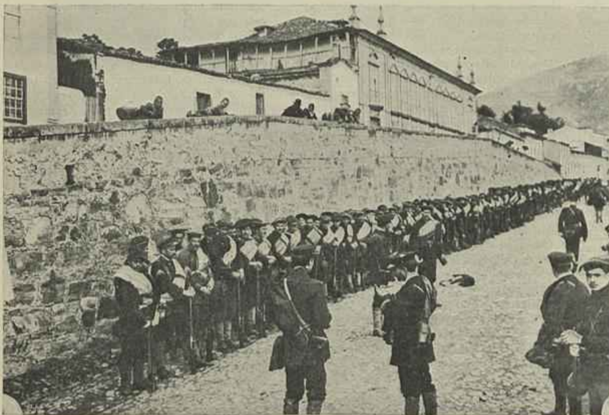
CHEGADA DAS FORÇAS DE MARINHA A BRAGANÇA

historia, todos os logares que hoje estão sendo teatro dos ultimos acontecimentos o fôram tambem nesses periodos.