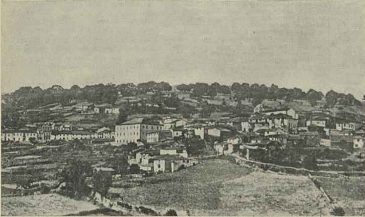
A VILA DE VINHAES

e na regencia de D. João VI. Foi em tempo praça de guerra, estando guarnecida pelos povos das freguezias proximas pelo que tinham o privilegio de não dar soldados para o exercito. Teve papel importante nas guerras com Espanha e na primeira invasão franceza.