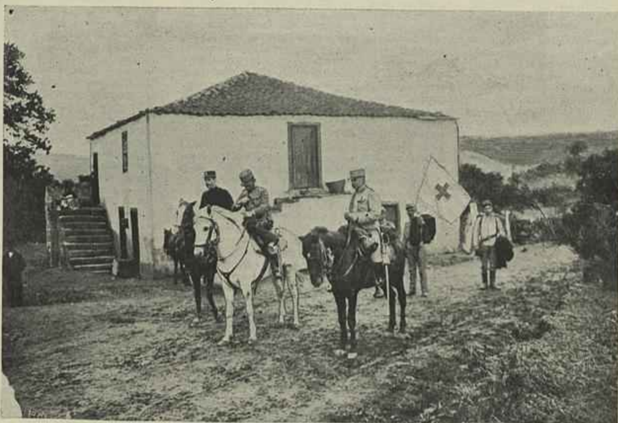
EM SALGUEIROS — O ESTADO-MAIOR DAS FORÇAS EM OPERAÇÃO E A CRUZ VERMELHA

É uma aldeia do Minho, na freguezia de Vilarinho comarca e concelho de Vila Verde, 15 kilometros ao N. de Braga e 375 de Lisboa. Antiga via militar romana que de Braga ia a Astorga, é hoje a linha divisoria que ali passa entre a provincia do Minho e a Galliza. Ainda lá se conservam muitos marcos miliarios e se vêem restos de uma trincheira com sua contra escarpa construida por D. João I, reedificada por D. João IV