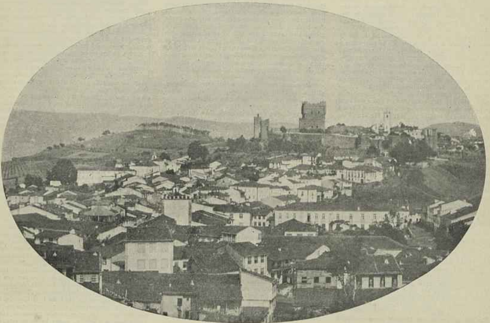
A CIDADE DE BRAGANÇA

dro (o da Alfarrobeira) o qual o deu a título de ducado a seu irmão D. Afonso, conde de Barcelos, que foi o primeiro duque de Bragança.