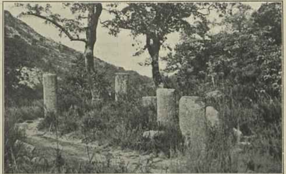
PORTELA DO HOMEM, OS MARCOS MILIARIOS

Por isto se vê que, nos periodos mais agitados da nossa