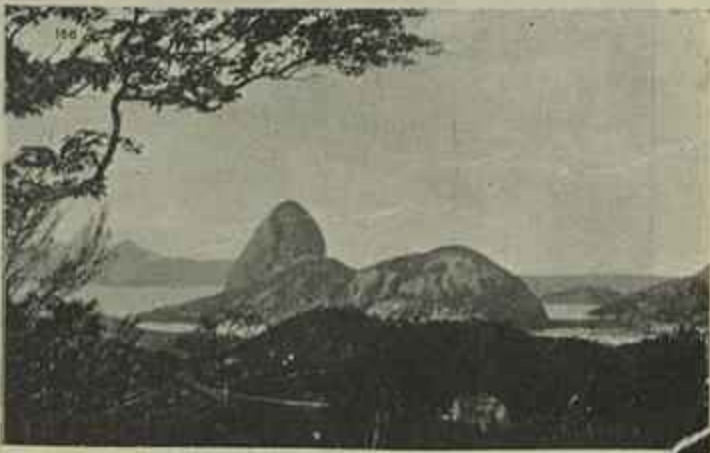
ENTRADA DO RIO DE JANEIRO

Depois, do Cabo Frio começámos a communicar com o Rio de Janeiro, prevenindo o Ministro de Portugal da nossa proxima chegada. Ao entrar