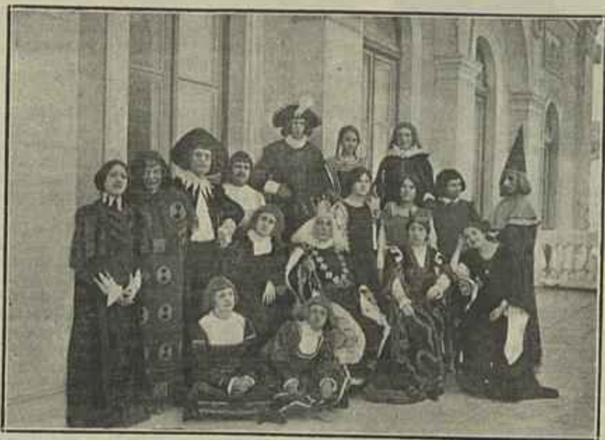
OS INTERPRETES DO «EL-REI SELEUCO»

Por ordem do Presidente conduziu-nos o sr. Pareja ao novo e luxuoso hotel—Parque-Hotel—situado na praia Ramirez onde nos foi offerecido um chá. Visitámos o Club Uruguay, d'onde fomos feitos socios honorarios e á noite convidaram-nos para uma soirée no Parque Hotel. Durante a nossa permanencia em Montevideo o nosso consul convidou-me todos os dias a mim e