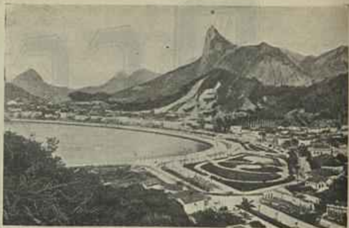
RIO DE JANEIRO—A ENSEADA DO BOTAFOGO