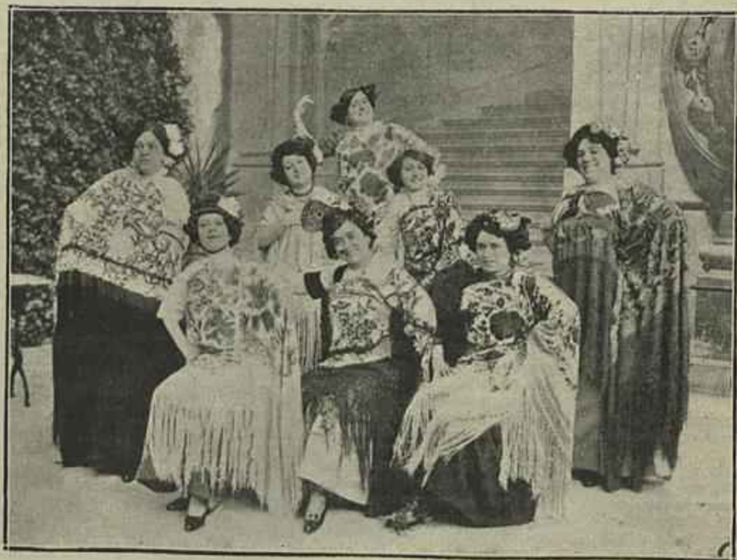
TEATRO DA REPUBLICA — GRUPO DAS «TIPILES» DA COMPANHIA DE ZARZUELA