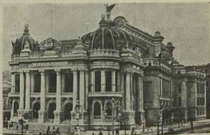
TEATRO MUNICIPAL DO RIO DE JANEIRO