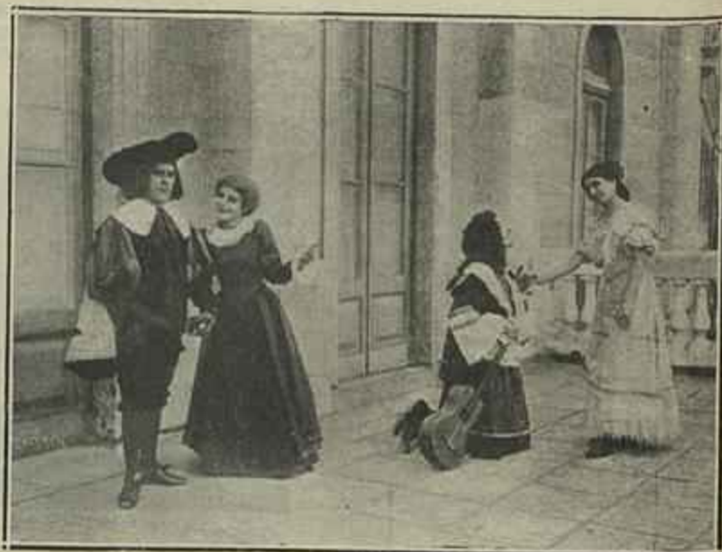
CENAS DO «FIDALGO APRENDIZ» DE D. FRANCISCO MANUEL DE MELLO

a dois officiaes para jantar. No dia 2 fomos a um baile de mascaras nos Pocitos para o qual foram convidados por uma Commissão de Senhoras que o organisou, todos os officiaes e aspirantes do S. Gabriel .