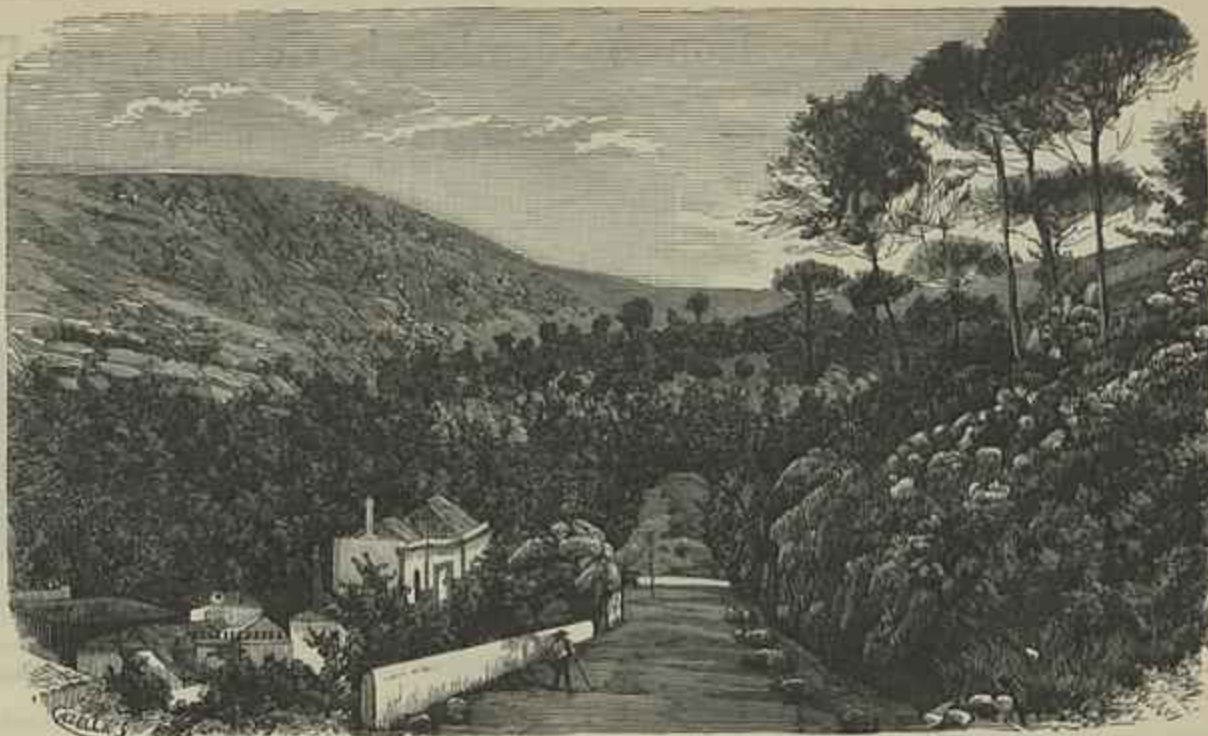
A ESTAÇÃO THERMAL DE MONCHIQUE

A vertente de uma das serras de Monchique alteia-se á direita e n'ella divisam-se pelas encostas varios casaes rodeados de terrénos cultiva-