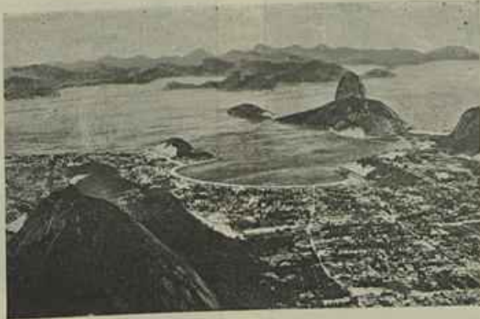
A CIDADE VISTA DO CORCOVADO