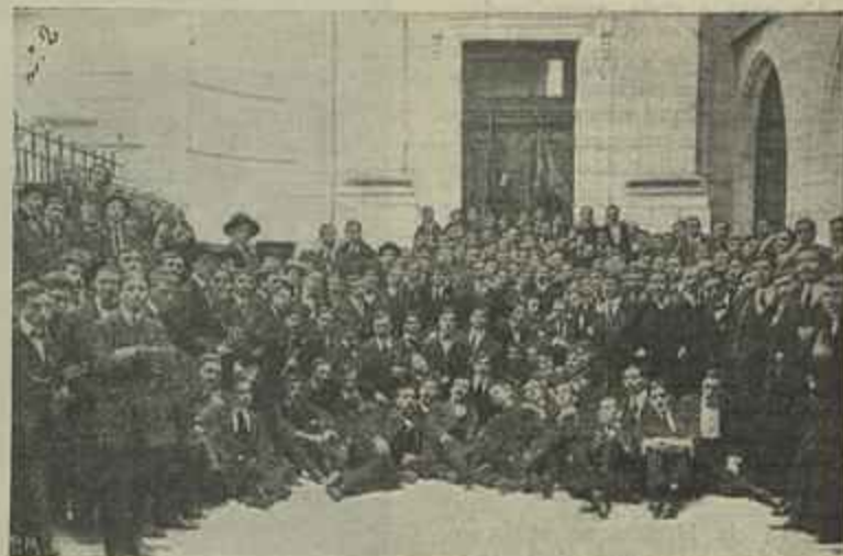
UM GRUPO DE ESTUDANTES NA TORRE EIFFEL — ESTUDANTES PORTUGUESES E FRANCESES NA ASSOCIAÇÃO ACADEMICA DE PARIS

Sobre esta visita do Orfeon Academico de Coimbra a Paris, os nossos leitores já tem conhecimento pelo que esta revista publicou a paginas 79 do numero 1162, por isso nos limitamos a reproduzir os dois instantâneos, que são mais uma prova da confraternização dos estudantes portugueses e francezes, na grande capital do mundo.