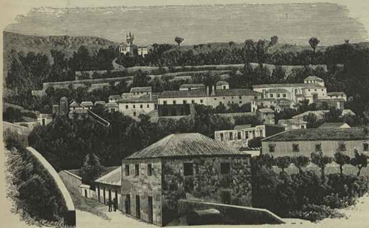
UM ASPÉTO DA VILLA DE MONCHIQUE

Sobraccero á villa ergue-se, proximo a um eucalyptal, um antigo convento de franciscânos, com a sua igreja meio arruinada, n'uma situação deliciosa como amenidade e ponto de vistas, para o que os frades, como é sabido, tinham dedo na escolha dos locais. D'aquelle sitio vê-se, na frente, a primeira alta serra, propriamente chamada de Monchique, a qual se avista de Portimão, agora d'ali observada pelo reverso e portanto interceptando, como uma cortina, o enorme panorâma pelo Algarve fóra; para gosar essa formidavel vista, necessario era acabar de subir a serra da Foia, que por ser