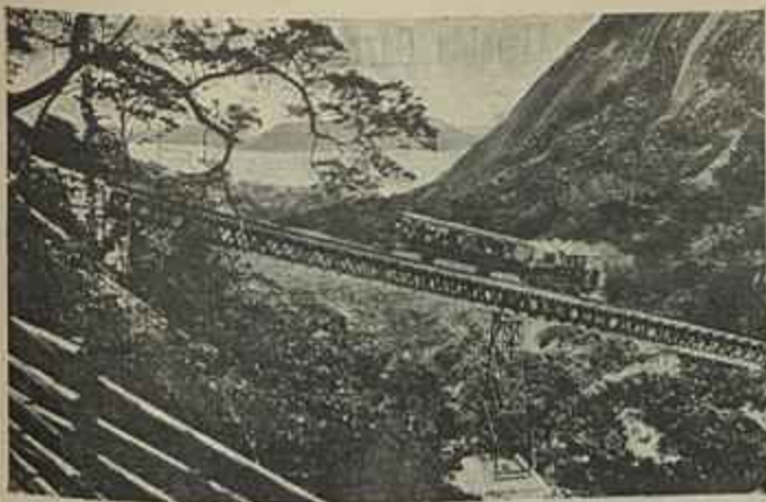
SUBINDO O CORCOVADO