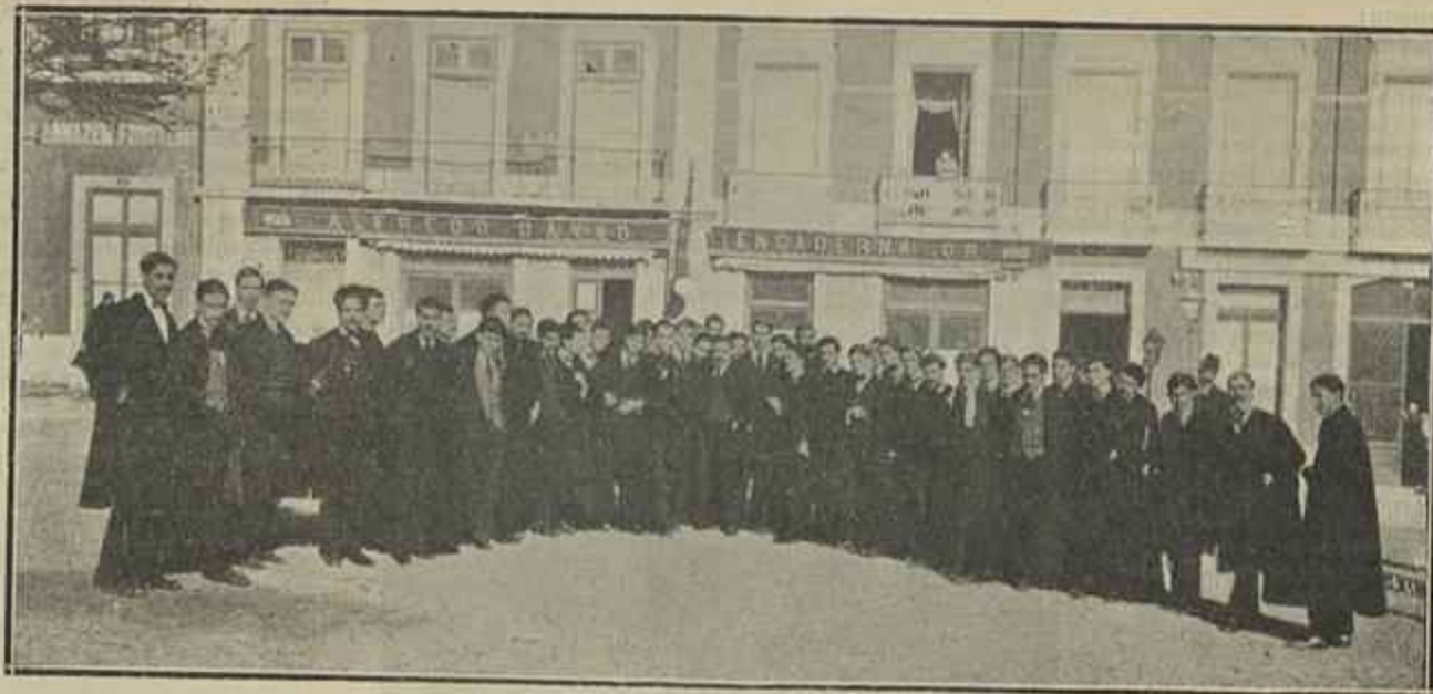
O ORFEON ACADEMICO DE COIMBRA QUE FOI A PARIS

guarda de todos os progressos, dando exemplo ás gerações novas que a buscam, que nella vêem o avançar da humanidade para a conquista de todas as perfeições.