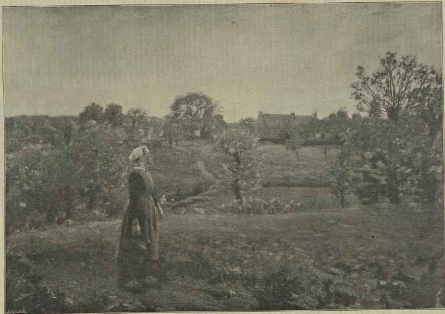
O CANTO DA COTOVIA — Quadro de Sousa Pinto — Simile-gravura de Marques Abreu.