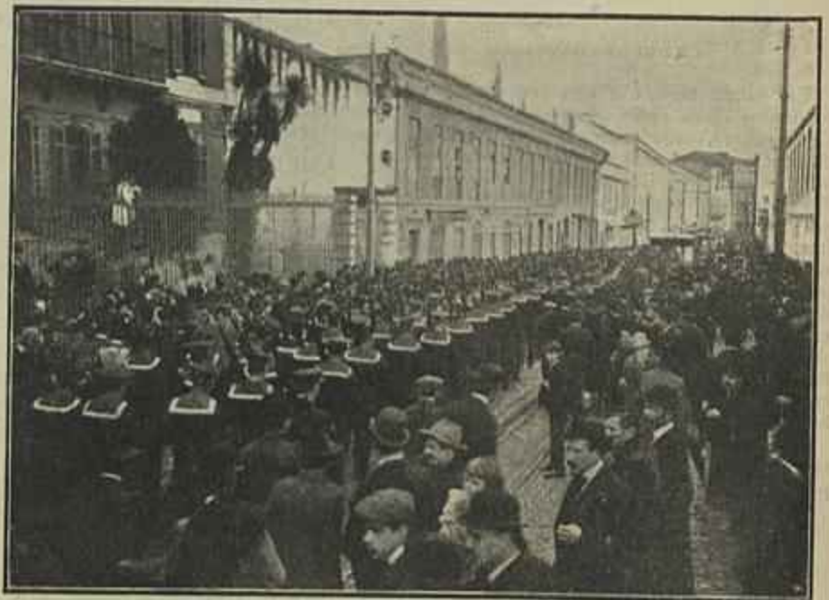
O CORPO DE MARINHEIROS QUE FEZ A GUARDA DE HONRA, NO COLISEU

A sessão solemne da Associação do Registo Civil ficará bem na memoria do povo de Lisboa, como a de uma das manifestações mais calorosas e significativas ao novo regimen.