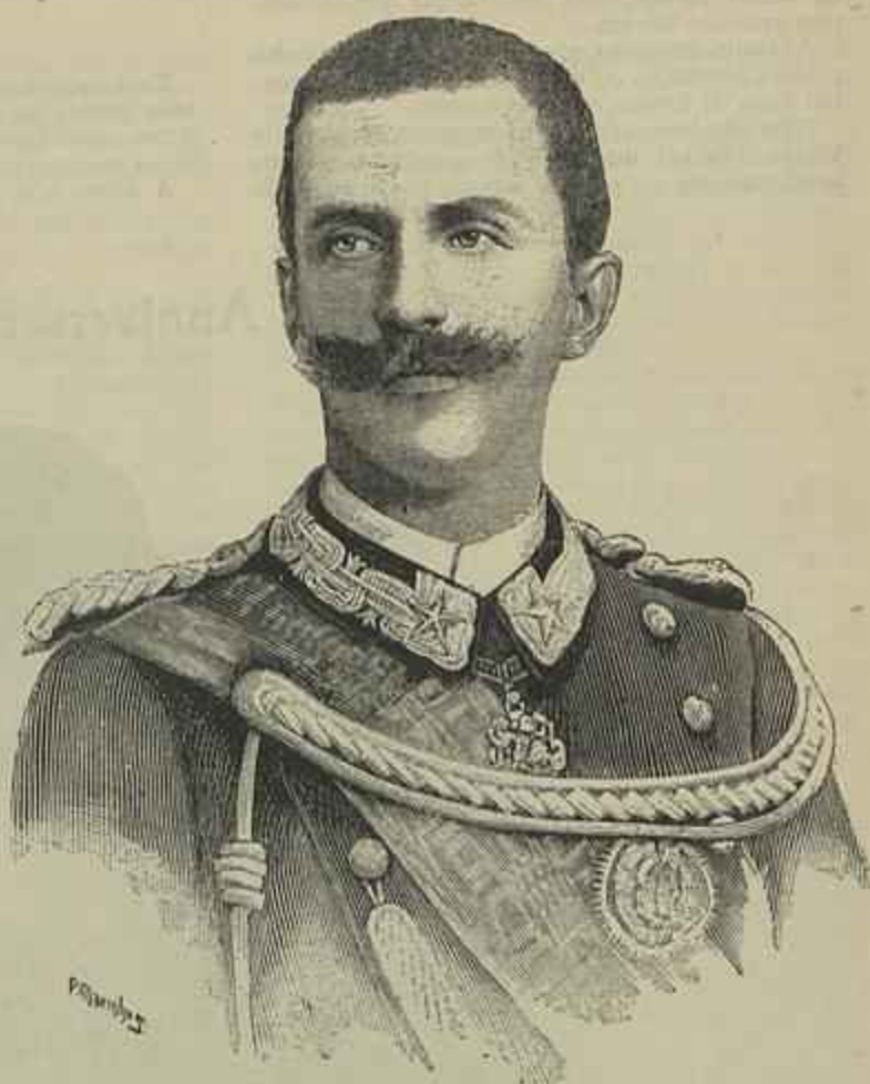
VICTOR MANUEL III

simã, nem desconhecida, fõra o sonho de uns e a aspiraçãõ dilecta de outros.