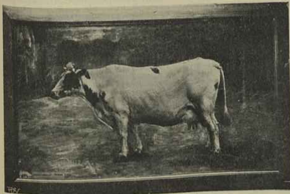
UMA VACA Quadro de G. Rendo, primeiro classificado para o premio «Anunciação»