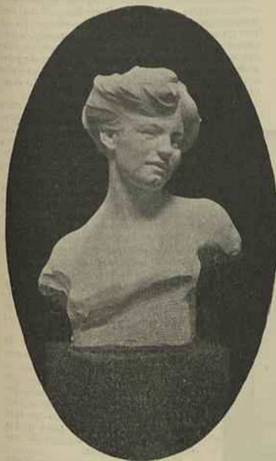
UM BUSTO DE MULHER Esculptura de Henrique Franco