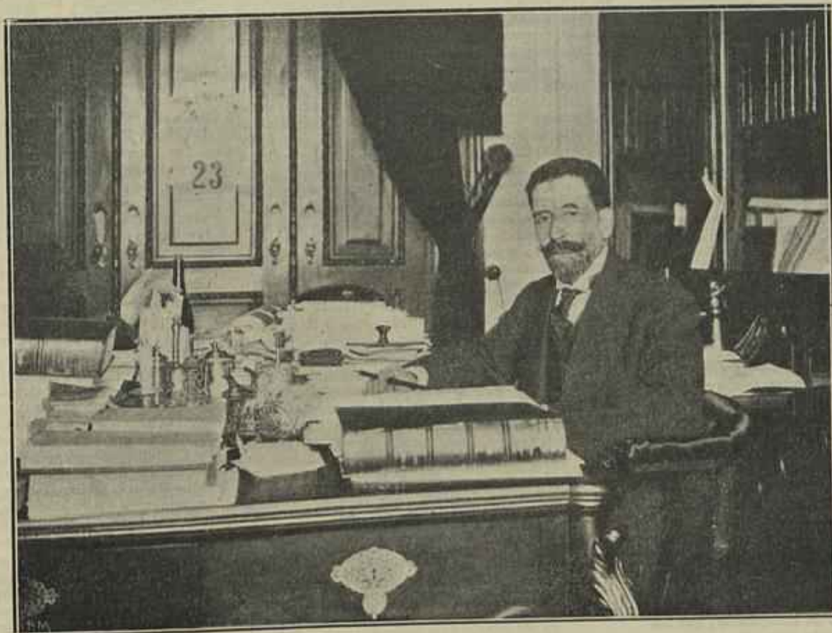
SUA EX.ª O MINISTRO DAS FINANÇAS, JOSE RELVAS, NO SEU GABINETE