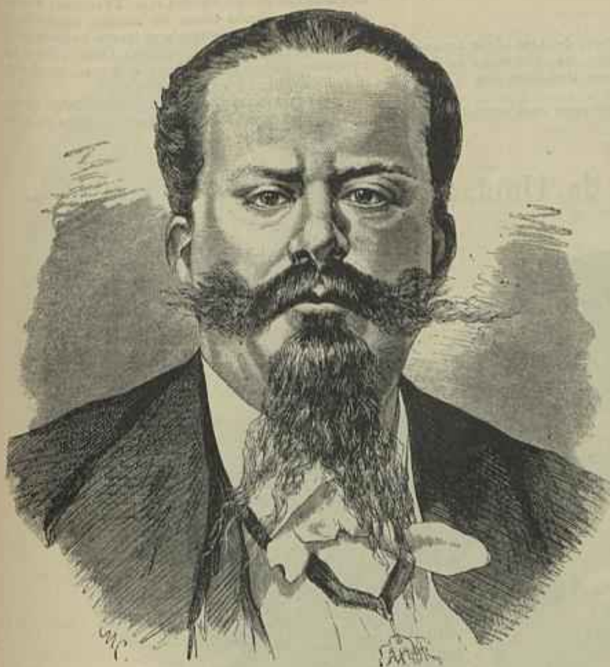
VICTOR MANUEL II