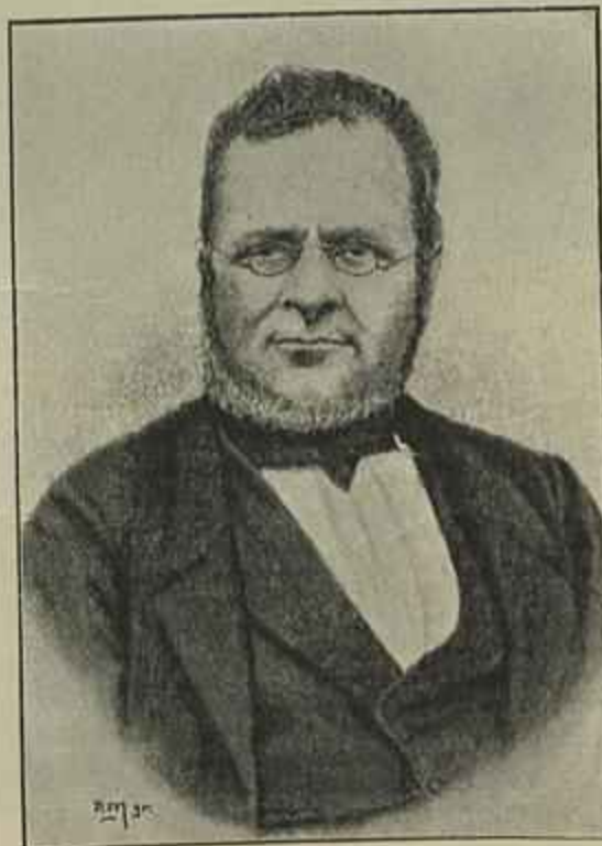
CONDE DE CAVOUR

Todas as cidades historicas da Italia são escola