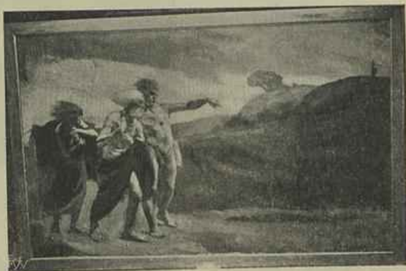
CRISTÃOS FUGINDO À PERSEGUIÇÃO DE NERO Quadro de Ricardo Ruivo

Encontrei ainda no interessante certamen alguns desenhos curiosos de «Francisco Smith» e algumas «manchas» de aspecto agradável dos pintores Francisco Cabral e Alberto Cardoso. O que porem mais me impressionou n'esta exposição de rapazes, foram duas telas: a Velha Açoreana , de Domingos Rebello, e a Natureza morta , firmada por Roberto Colin. A primeira das telas mencionadas póde ter defeitos, póde ser talvez que esteja muito longe da perfeição, mas o que não resta duvida, o que é positivo, é que é cheia de sentimento e impressiona. A expressão d'essa velha açoreana é bem a expressão da velhice talvez cansada de observar todo este sendal de mi-