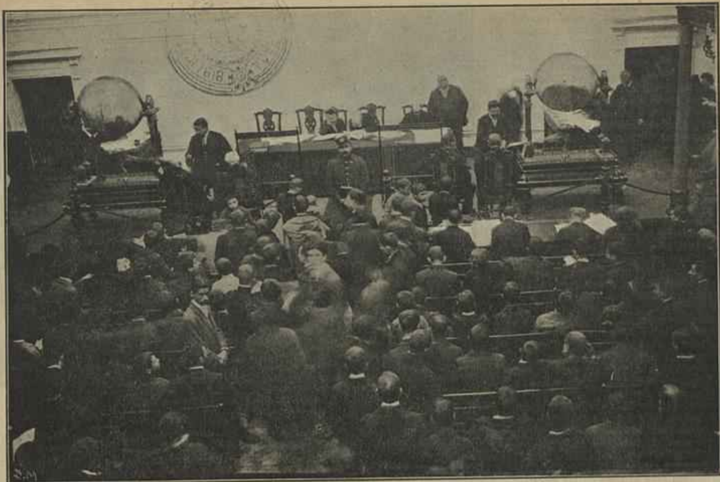
A LOTERIA DO NATAL. — EXTRAÇÃO DOS PREMIOS NA SALA DAS LOTERIAS DA CASA DA MISERICORDIA