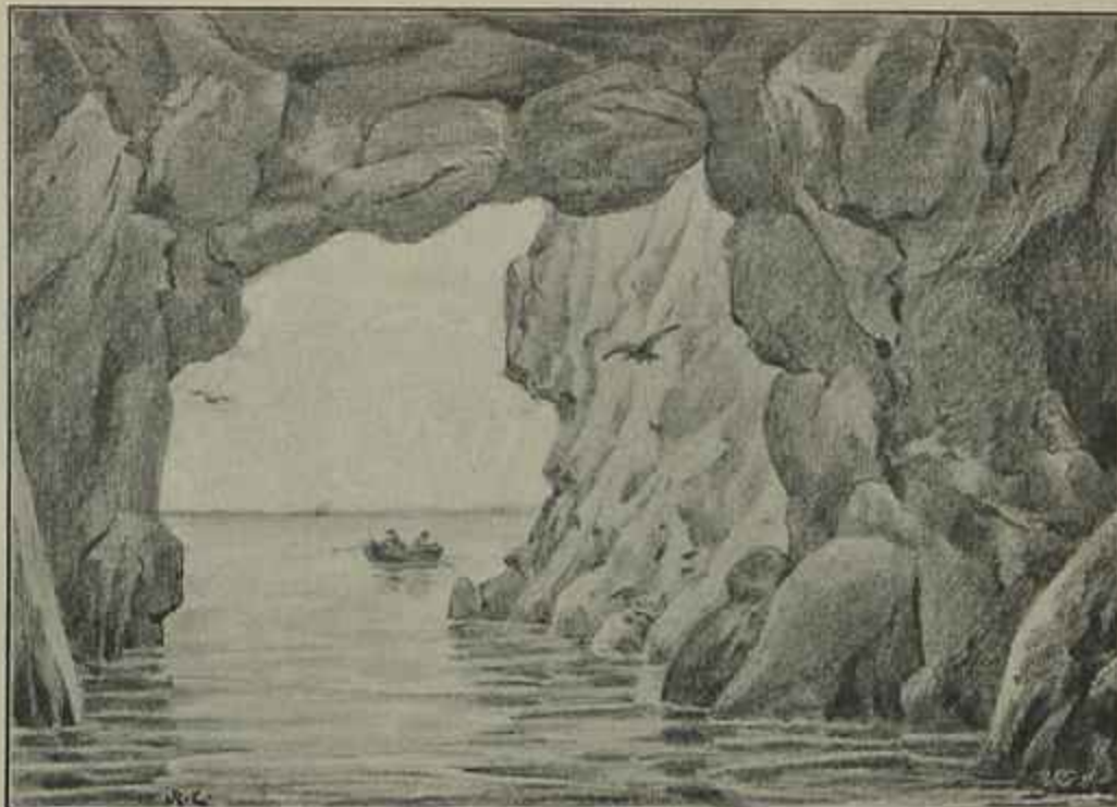
LAGOS — GRUTA DA SENHORA DA PIEDADE

Percorrêmos umas trez, sempre embarcados, entrando por uns vastos pórticos de irregulares curvas, de aspecto pouco tranquilizador e seguindo de pasmo em pasmo, por umas grandes salas, e sahindo mais adiante por outros arcos dantescos; mais adiante percorrêmos vagarosamente, no escaler, a gruta da Senhora da Piedade, esta alta e espaçosa, como um templo formado de extranha architectura, com rasgões nas assidentadas parêdes e nas maçissas abobadas; n'um, n'outro ponto, abriam-se no alto varios rótos , por onde o sol entrava a flux e se via o lindo azul do ceu e