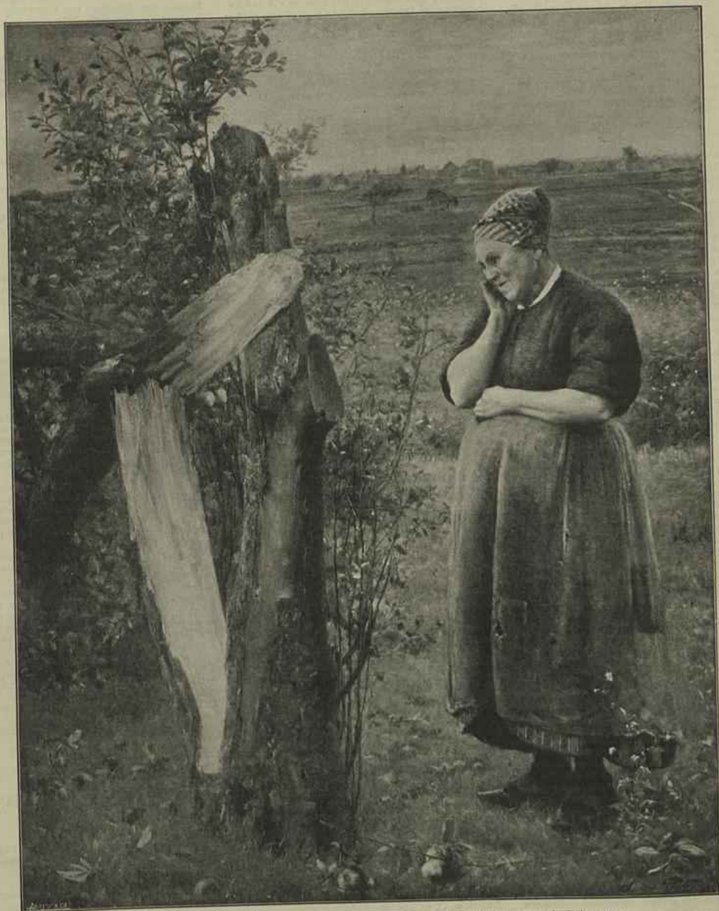
DEPOIS DO VENDEVAL — Quadro de Sousa Pinto, no Museu da Escola Portuense de Belas Artes Fotografia e simill gravura de Marques Abreu