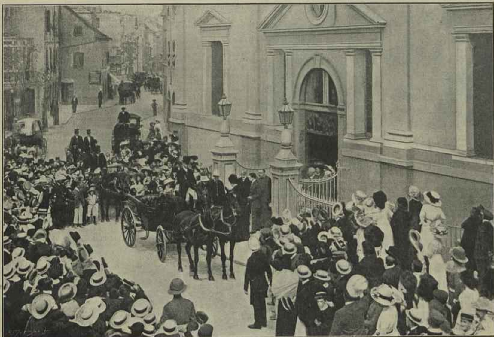
EM GIBRALTAR—O REI DESTRONADO E SUA MÃE, SAHINDO DA MISSA DA EGREJA DE SANTA MARIA COROADA

nos parques de Wood Norton. Ali os foi visitar o rei Jorge V e a rainha Maria de Inglaterra, no dia 28 do mez passado.