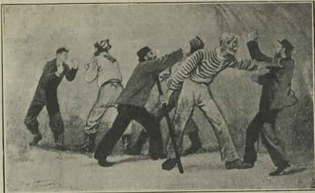
CASA SUBMARINA, CAP. XVII — Atirava-lhe tamanho sôco á cara...

— Isto — e mostrei-lhe uma das chaves de Regnarte — isto abre as portas de ferro que se encontram lá em baixo. Se me succeder alguma desgraça, váe ali direito e occupa o