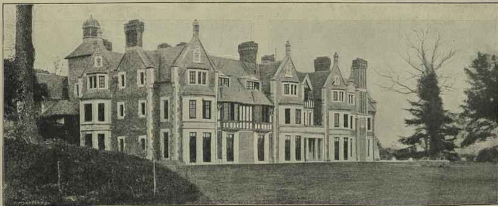
PALACIO DOS DUQUES DE ORLEANS EM WOOD NORTON, ONDE SE ENCONTRAM HOSPEDADOS O SR. D. MANUEL, SUA MÃE E O SR. D. AFFONSO

As granadas abriram grandes buracos nas paredes, chegando a penetrar no interior da casa onde destruíram muitos moveis, com grande risco de incendio e da vida das pessoas que lá estavam. A quantidade de projecteis encontrados de-