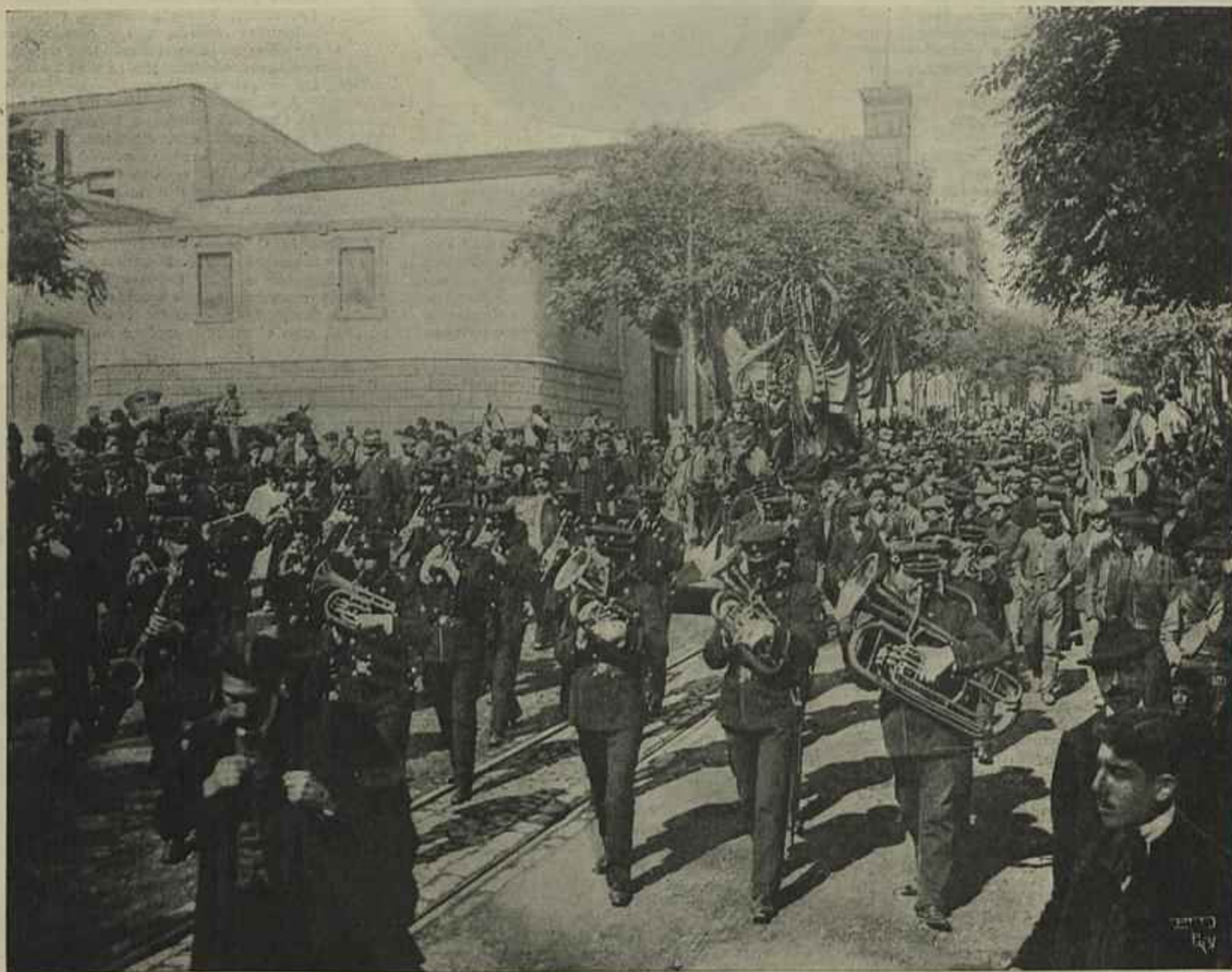
EM LISBOA — O BANDO PRECATORIO DOS ESTUDANTES

Com respeito ao sr. D. Manuel e sua mãe, hospedados no palacio dos duques de Orleans em Wood Norton, têm sido ali muito visitados pela aristocracia inglesa, procurando o rei destronado, no meio da tristeza que o invade, distrair-se com alguns passeios e caçadas