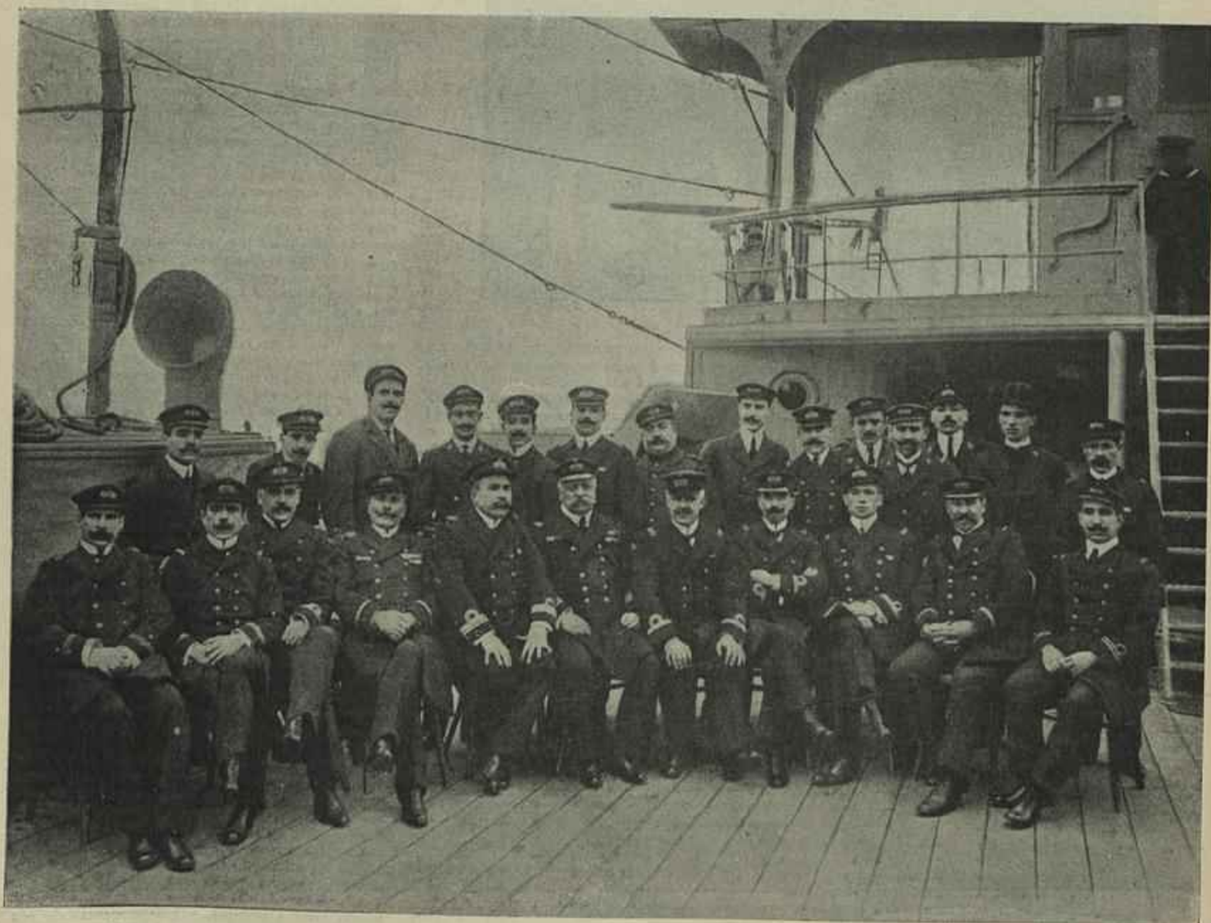
GRUPO DO COMANDANTE E OFICIALIDADE DO CRUZADOR D. CARLOS FOTOGRAFADO A BORDO, NO DIA DA PARTIDA PARA A ARGENTINA

O sol está prestes a desaparecer no horizonte. E' a hora melancolica em que a natureza apresenta um aspecto grave e solemne, que convida o poeta á meditação. O vento que sopra do oeste, sem quebrar o profundo silencio que reina na natureza, atravessa o adro da igreja, d'esse monumento legado ao povo, que escarnece das crencas religiosas dos seus antepassados, mas que não ousa combater o despotismo porque no seu coração não está profundamente radicado o amor da patria e da liberdade. O poeta dá por ironia aos seus contemporaneos o epitheto de fortes para fazer sobresaír a cobardia e o egoismo do povo, que se curvava ao jugo dos tyrannos. Este sublime poemeto foi escripto quando na alma juvenil de Alexandre Herculano existiam as aspirações mais ardentes para o proseguimento d'esse