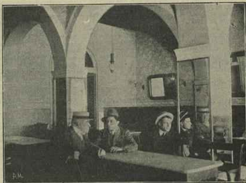
O ANTIGO CAFÉ «MARTINHO», VISTA EXTERIOR E INTERIOR