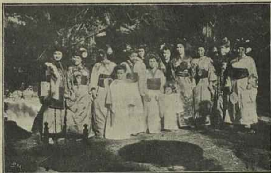
AS «JAPONESAS» QUE SERVIAM O CHÁ

E' grande o contraste do velho com o novo Martinho , quer no aspeto exterior quer no interior, como se póde vêr das gravuras que apresentamos, e que ficam sendo uma recordação, do velho cenaculo, com seus arcos em abobada, sobre pilares furrados de espelhos, toda a opulencia decorativa a que se chegava, sem arte e sem gosto. Esses espelhos a que se miraram trez ou quatro gerações, desaparecerem enfim, alguns já partidos pelo ultimo vendaval de pedradas e tiros de que foram