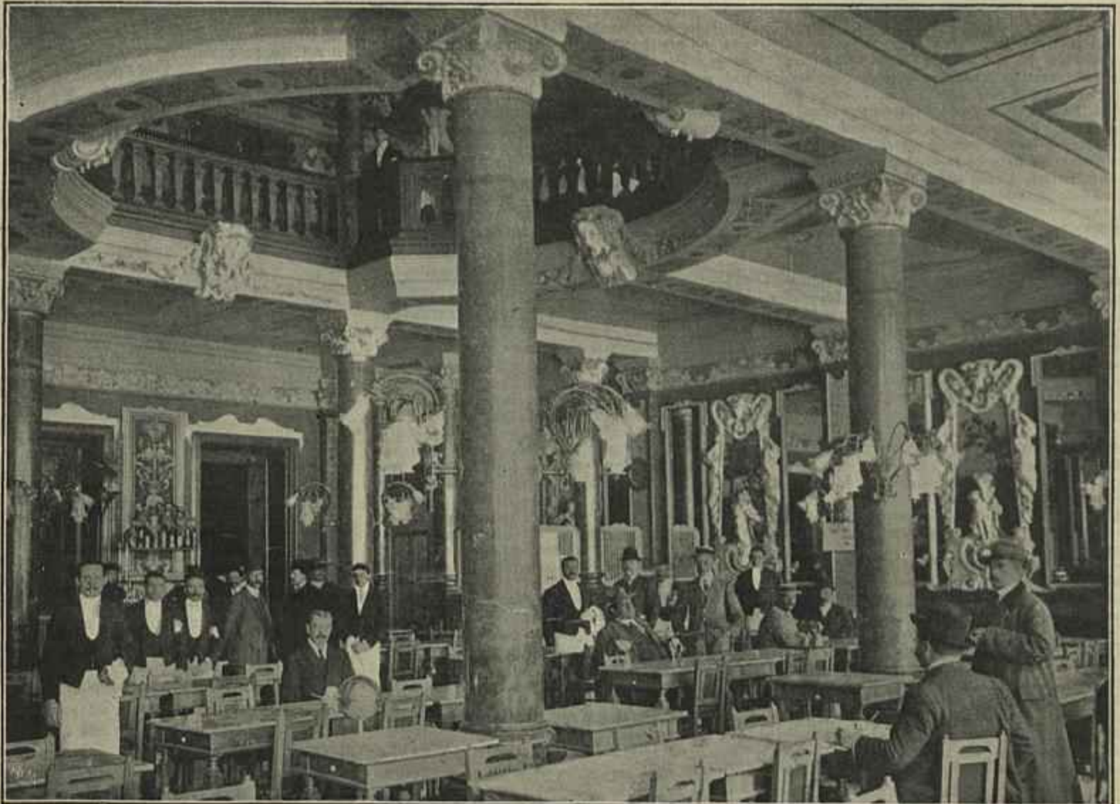
O NOVO SALÃO DO CAFÉ