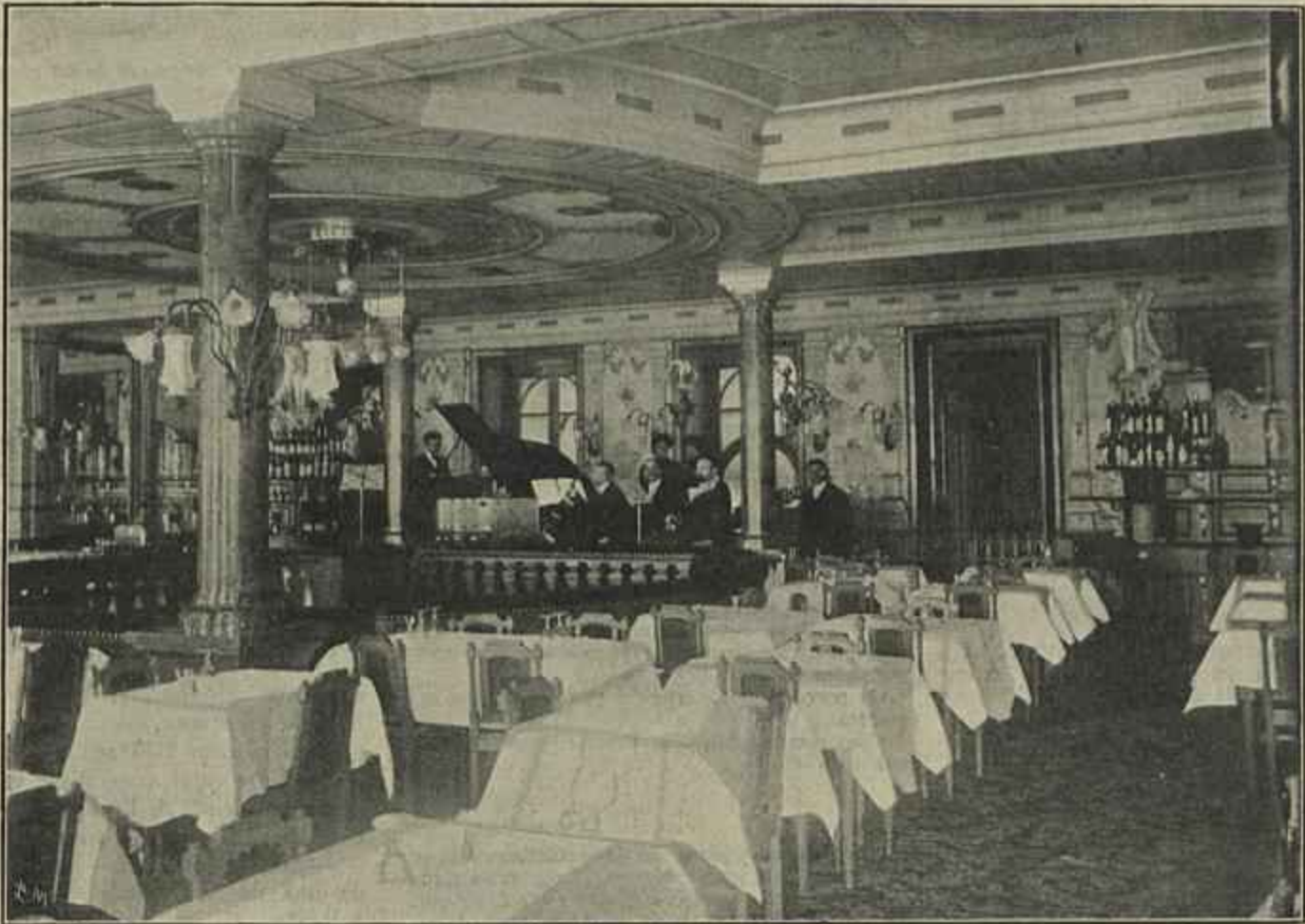
O NOVO SALÃO DE JANTAR