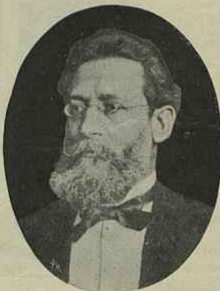
GASPAR DA SILVEIRA MARTINS

Grande tribuno e parlamentar brasileiro. Exerceu grande influencia politica na sua provincia, durante o tempo do imperio. Foi por diversas vezes ministro de estado e de uma vez presidente do conselho. Quando rufo o imperio, no dia 15 de novembro de 1889 — o Imperador mandou-lhe um telegramma, chamando-o á côrte, e pondo-se em