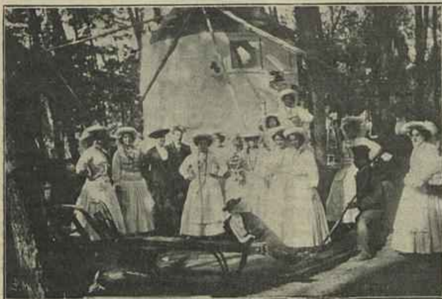
AS MOLEIRAS JUNTO AO MOINHO

testemunhas, na celebre noite de 18 de junho de 1907, em que o sr. João Franco voltava da sua visita ao Porto.