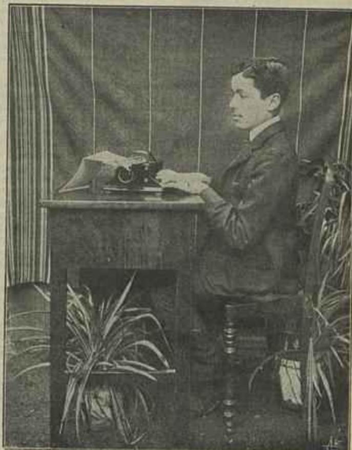
ALUMNO DA ESCOLA DE LISBOA ESCREVENDO Á MAQUINA

Por 1891 criou se em Lisboa, o Asilo-Escola Antonio Feliciano de Castilho, que se tem mantido com as maiores difficuldades, sendo asaz limi-