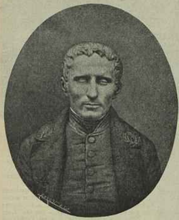
LUIS BRAILLE INVENTOR DO ALFABETO DOS CEGOS (1809)

Mas o homem faz portentos para salvar a vida, e assim, continuamos a trepar, a trepar pelas ladeiras do negro barranco, até aos pincaros azues da sua altura.