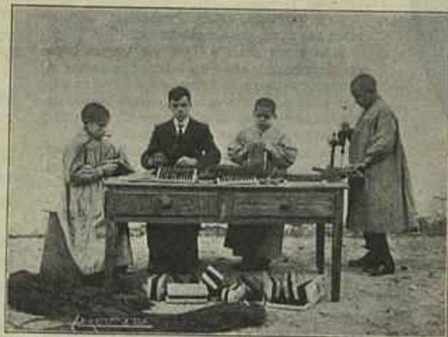
ALUMNOS DA ESCOLA DO PORTO FABRICANDO ESCOVAS

de 1834, passando nesse anno a incorporar-se na Real Casa Pia de Lisboa como medida economica, dando o governo áquelle estabelecimento, o subsidio para esse fim, de quatro contos e oitocentos mil réis annuaes, subsidio que afinal foi suprimido em 1844, de que resultou ficar o ensino dos cegos ao abandono, e por fim os proprios cegos, pois tendo-se desenvolvido as oftalmias e congitevites que se iam propagando aos outros alumnos daquelle estabelecimento, por falta de medidas preventivas que tivessem obstado a essa propaganda, foi forçoso, para acabar com o mal pela raiz, expulsar os pobres cegos, como então foi notorio e haverá