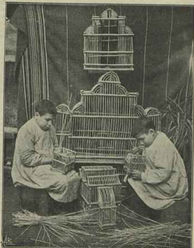
ALUMNOS DA ESCOLA DE LISBOA FABRICANDO GAIOLAS