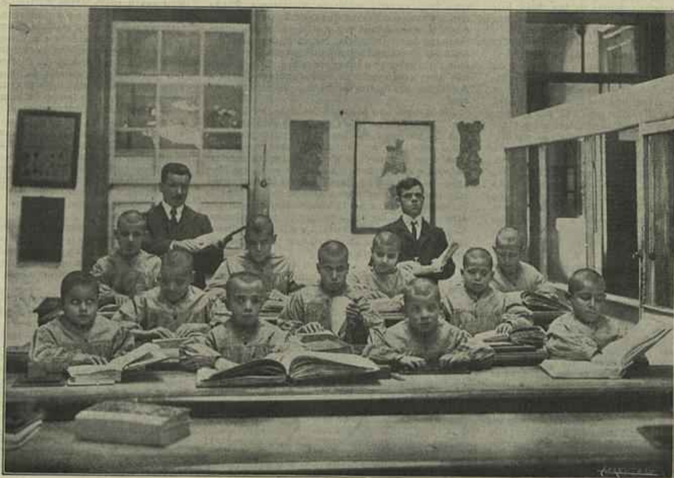
AULA DA ESCOLA DE CEGOS, NO PORTO