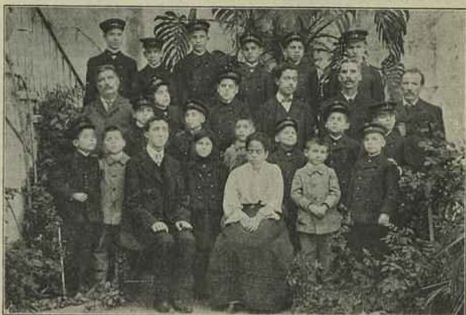
GRUPO DE ALUNNOS DA ESCOLA DE CEGOS, DE LISBOA