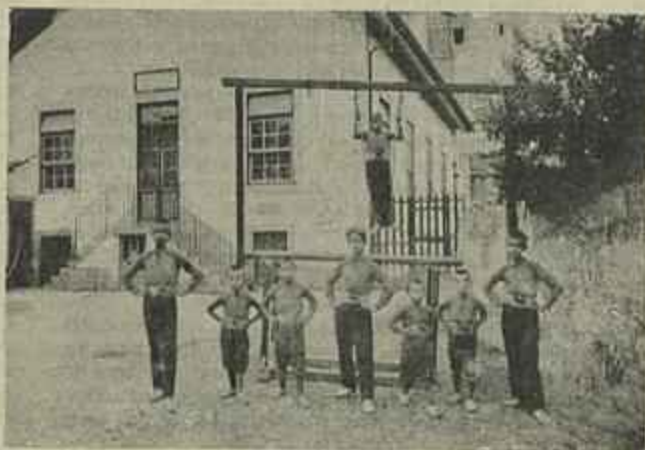
CLASSE DE GIMNASTICA DA ESCOLA DE CEGOS DO PORTO