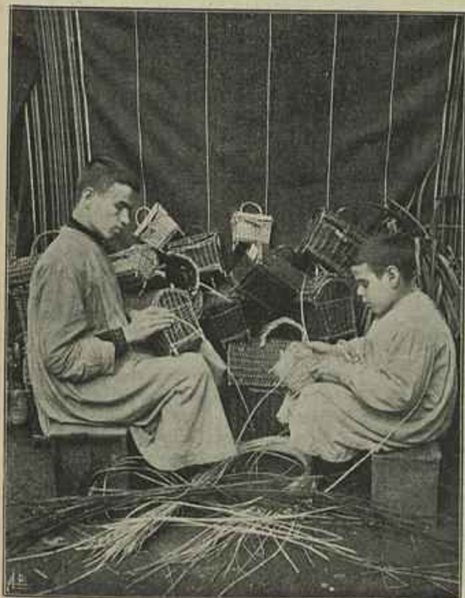
ALUMNOS DA ESCOLA DE LISBOA FABRICANDO CESTOS