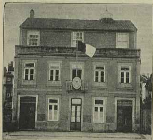
EDIFICIO DA ESCOLA DE CEGOS, NO PORTO