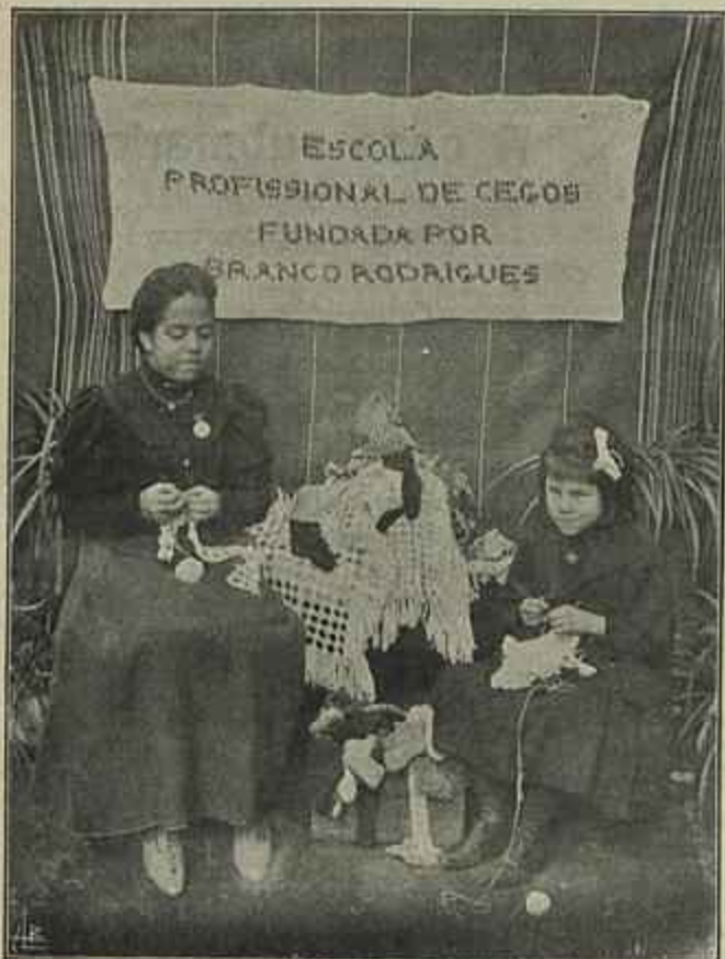
ALUMNAS DA ESCOLA DE LISBOA EXECUTANDO LAVORES