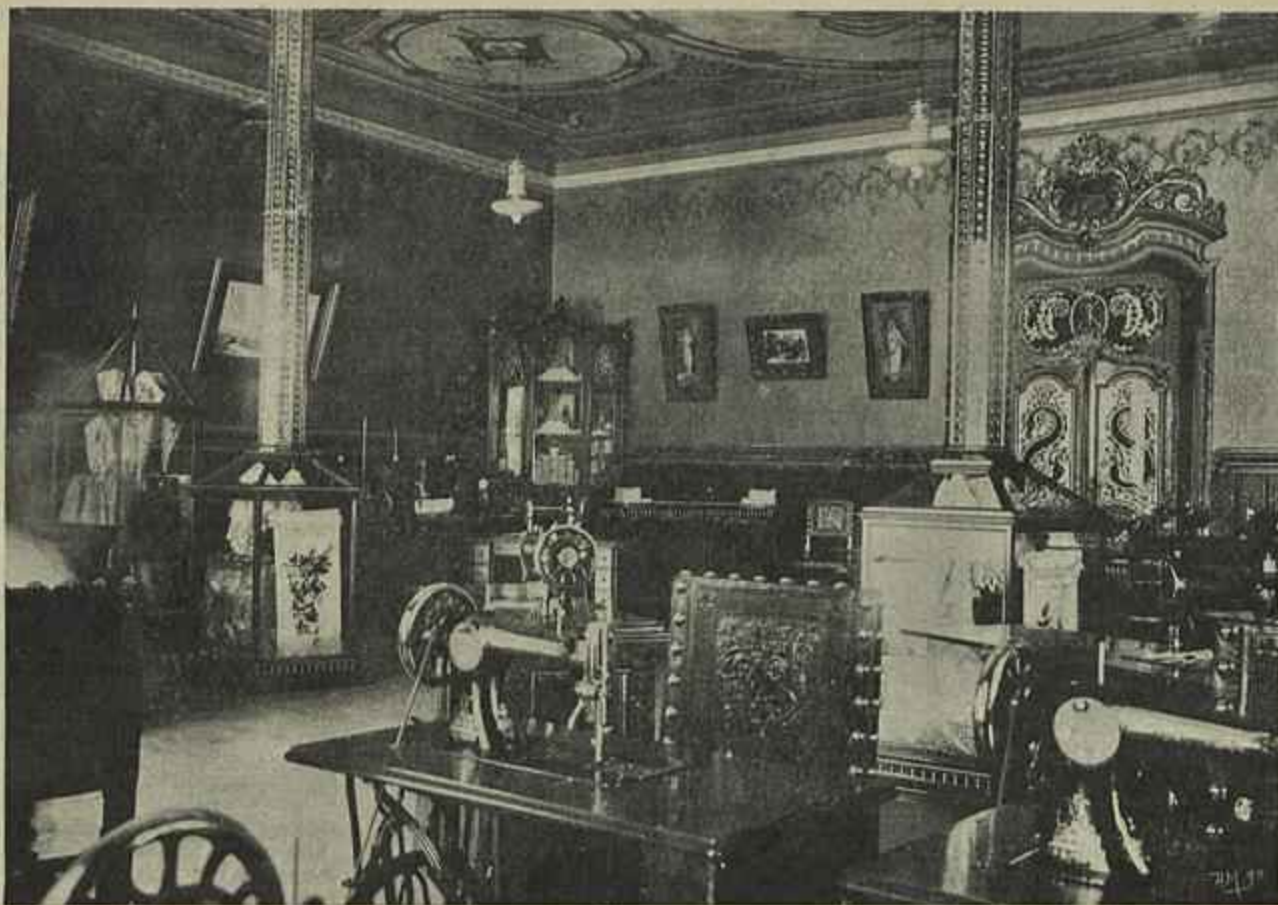
AS NOVAS INSTALAÇÕES DA COMPANHIA «SINGER», EM LISBOA SALÃO DE VENDAS, ESTILO LUIS XV, NA PRAÇA DOS RESTAURADORES, 42, B