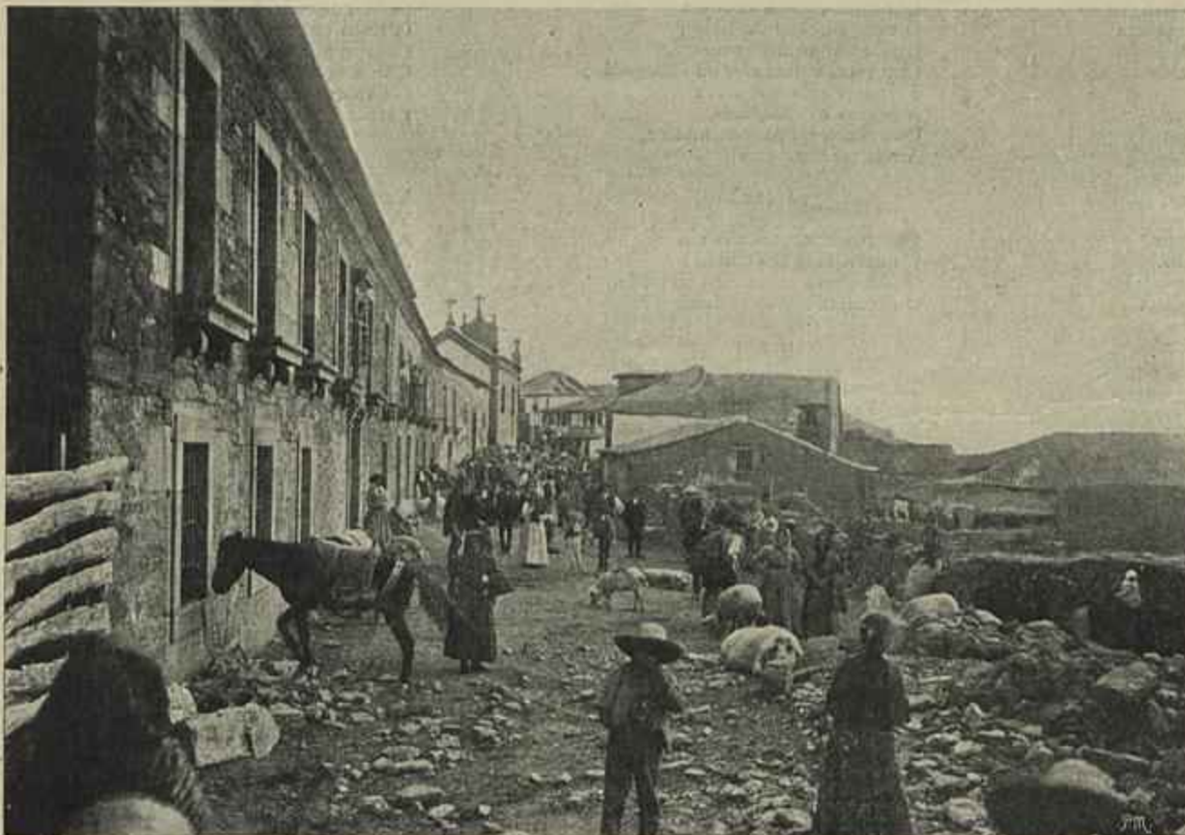
UMA FEIRA EM GUIÃES