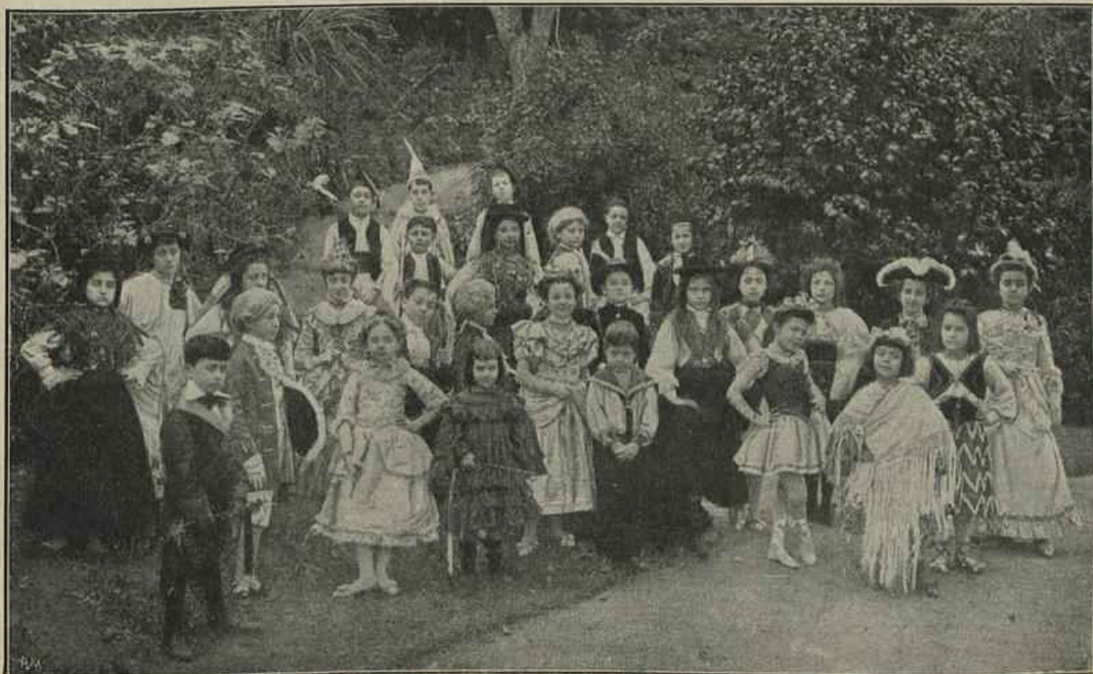
GRUPO DE CRIANÇAS AÇORIANAS QUE TOMARAM PARTE EM UMA RECITA, EM ANGRA DO HEROISMO