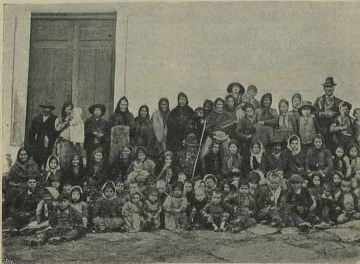
GRUPO DE FAMINTOS DA FREGUEZIA DE FAVAIS

de junho de 1755 e provisão da mesa do Desembargo do Paço de 23 de agosto do mesmo anno.