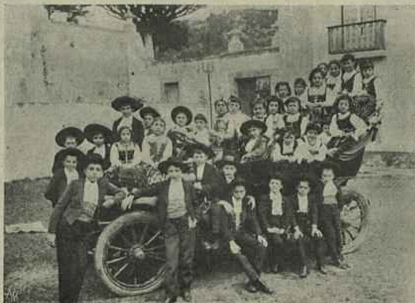
UM GRUPO DE CREANÇAS AÇORIANAS

Qualquer dos grupos que reproduzimos em nossas gravuras de hoje, são prova desta asserção, porque difficilmente se poderá reunir um punhado de creanças mais formosas do que as que figuram nesses grupos.