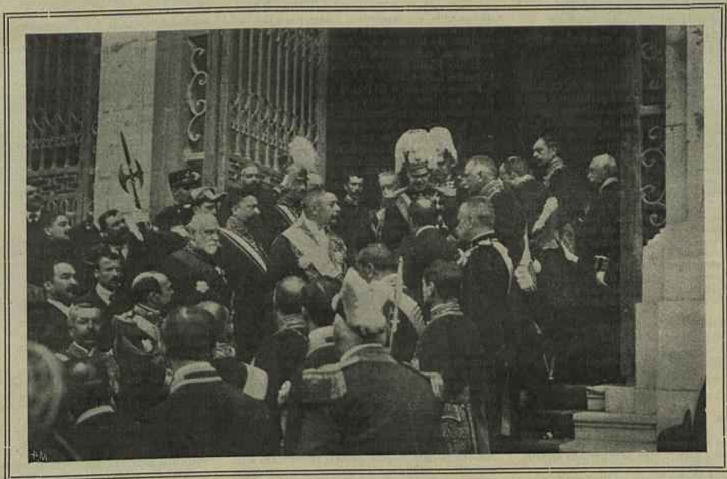
S. M. EL-REI D. MANUEL II SAHINDO DO PALACIO DAS CORTES DEPOIS DE INAUGURAR A SEGUNDA SESSÃO LEGISLATIVA DE SEU REINADO