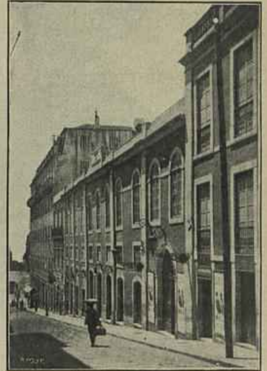
TEATRO DO GIMNASIO

Os actores não desanimaram e foram por deante com seu intento, pondo em cena a opereta de Miró A Marquês , que teve extraordinario exito, seguindo-se o Conselho dos Dez e depois A velhice namorada sempre leva surriada , também de Miró, sendo nesta ultima que Taborda mais affirmou seus grandes recursos comicos, copiando para o seu papel de Simplicio da Paixão um tipico e conhecido fiel de feitos da Boa Hora.