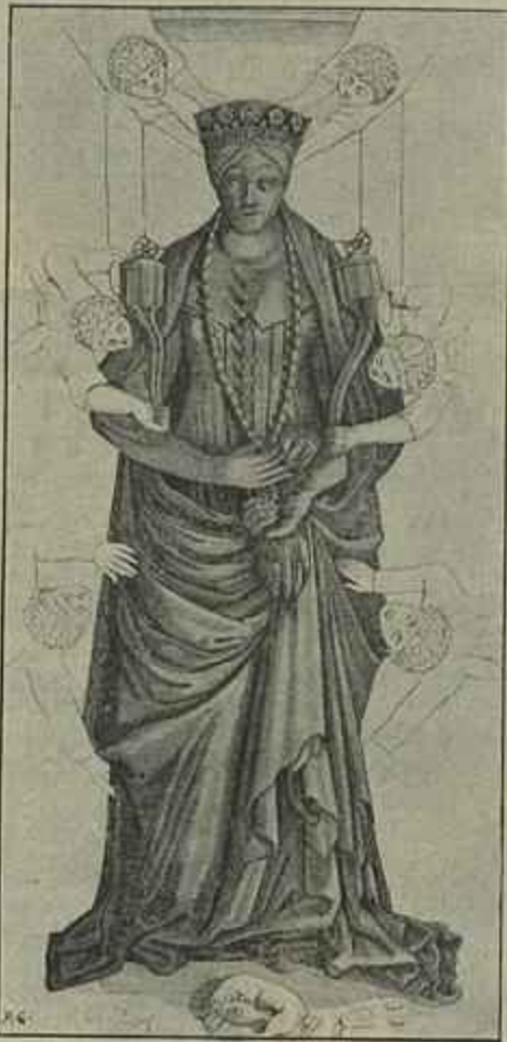
ESTATUA TUMULAR DE D. IGNEZ DE CASTRO