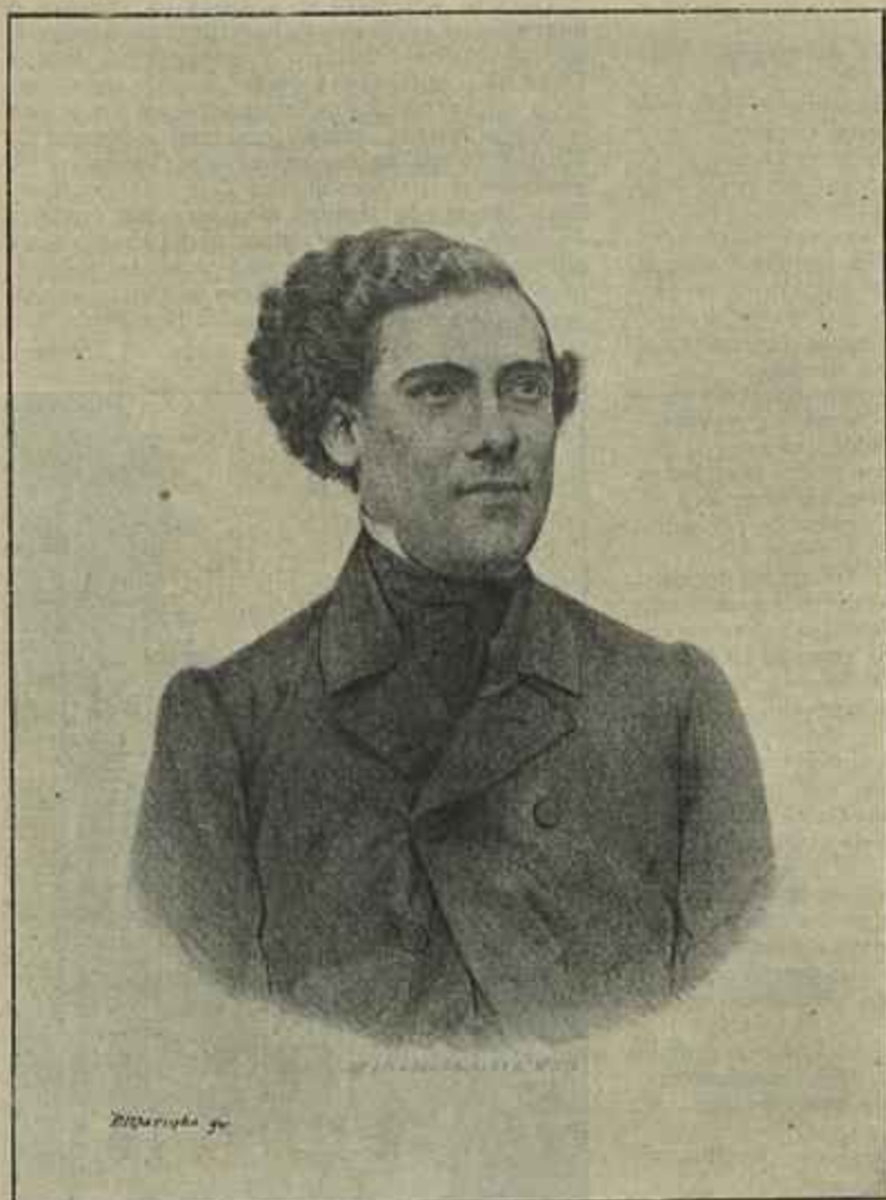
TABORDA AOS 30 ANOS (reprodução de uma litografia da época)