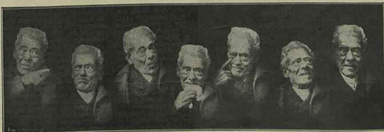
O JOGO FISONOMICO DE TABORDA