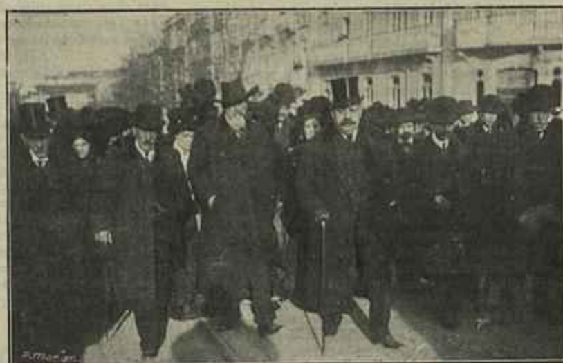
O FUNERAL — ACTRIZES, ACTORES E EMPRESARIOS NO FUNERAL DE TABORDA