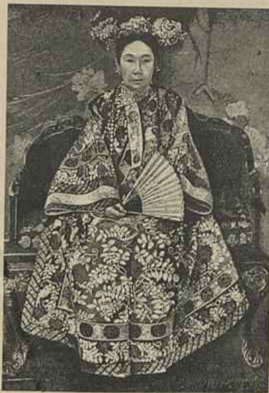
A IMPERATRIZ VIUVA TSE-HSI

Yuan-Chi-Kai inclina-se muito para o Japão a quem não terá duvida em fazer boas concessões