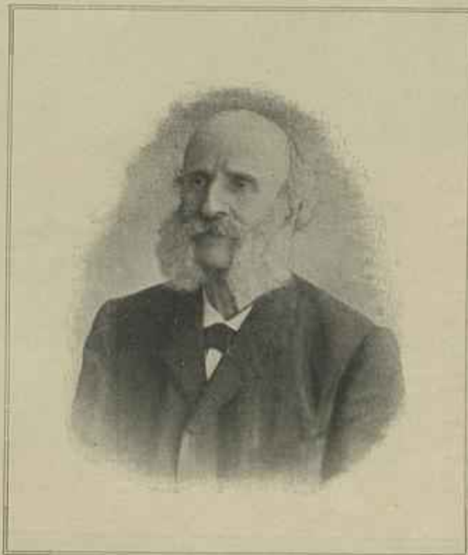
CONSELHEIRO FRANCISCO DA FONSECA BENEVIDES

Em 1880 publica Memorie sus la vitesse de propagation des flammes , e em 1882 faz uma segunda edição Elementos de balistica , cuja primeira fora dada á estampa em 1872, com gravuras demonstrativas. Está esgotada.