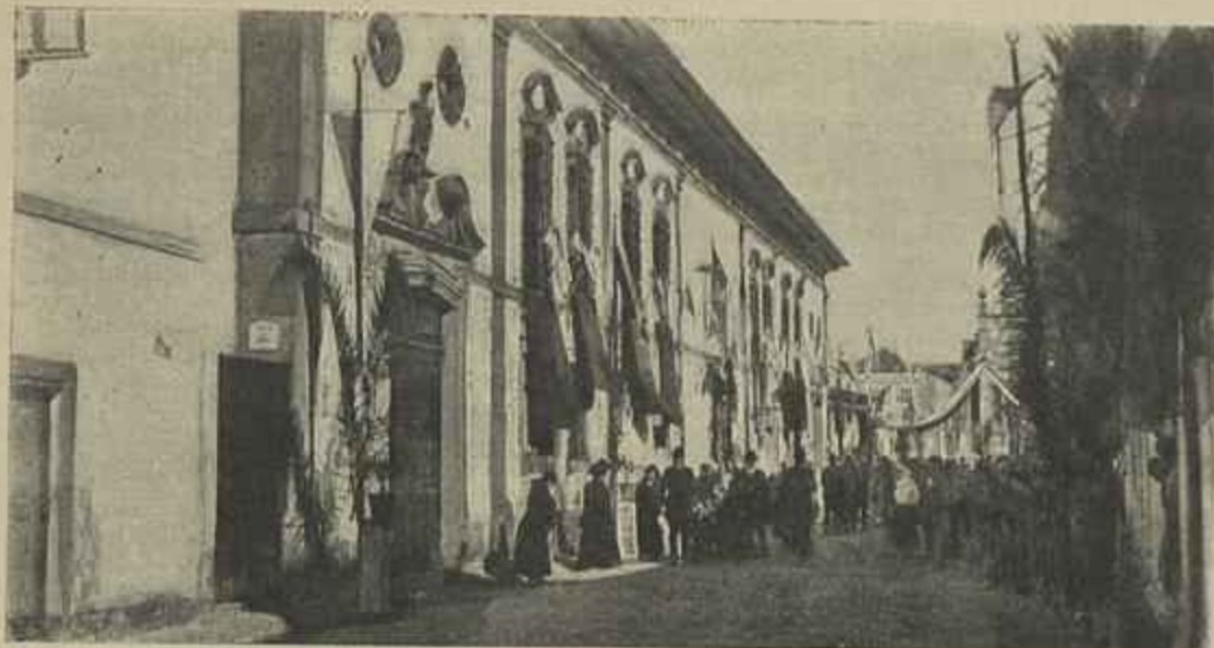
EM AVEIRO — A EGREJA DE JESUS ONDE SE CELEBROU O «TE-DEUM»

offerecendo thema ao geologo, notas ao historiadôr, estro ao poeta.