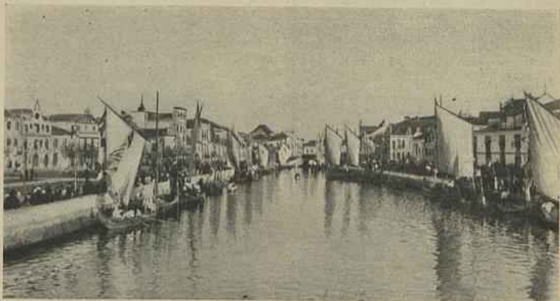
ASPETO DA RIA NO DIA DA VISITA DE EL-REI — (Clichés do sr. Granja)

Os campos como que nos estão fallando; as ruinas como que estão testemunhando o passado,