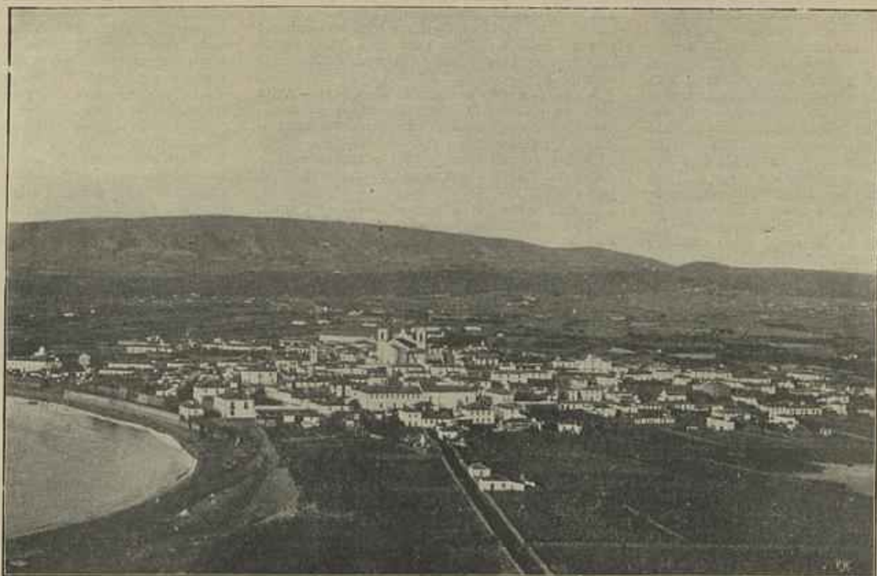
UMA VISTA DA VILLA DA PRAIA DA VICTORIA

ses, está na estatua que fizeram erigir no seio da sua villa, para recordar ao viajero — um benemerito.