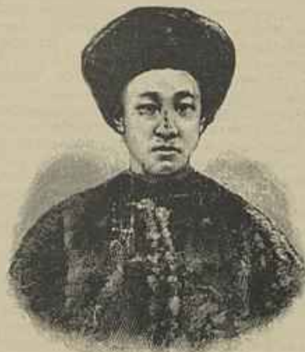
O PRINCIPE REGENTE CHUN

comerciaes, embora com isso contrarie a politica dos Estados Unidos, que em tempo declarou não consentir que a China desse quaesquer vantagens neste sentido ao Japão, sob pena de até recorrer ás armas, se tanto fór preciso.