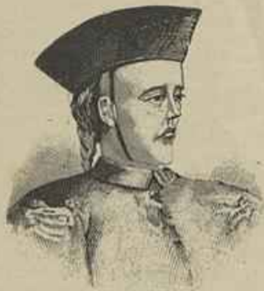
O IMPERADOR DA CHINA K'ANG-CHUN

O príncipe Chun tem dentro do seu imperio, ou antes em sua casa, um concorrente que o poderá prejudicar, e é o vice-rei Yuan-Chi-Kai, presidente do conselho do governo e com grande partido da facção liberal, — bom é saber que na China já ha partido liberal —, contando ainda grande prestigio no exercito e dispondo de uma