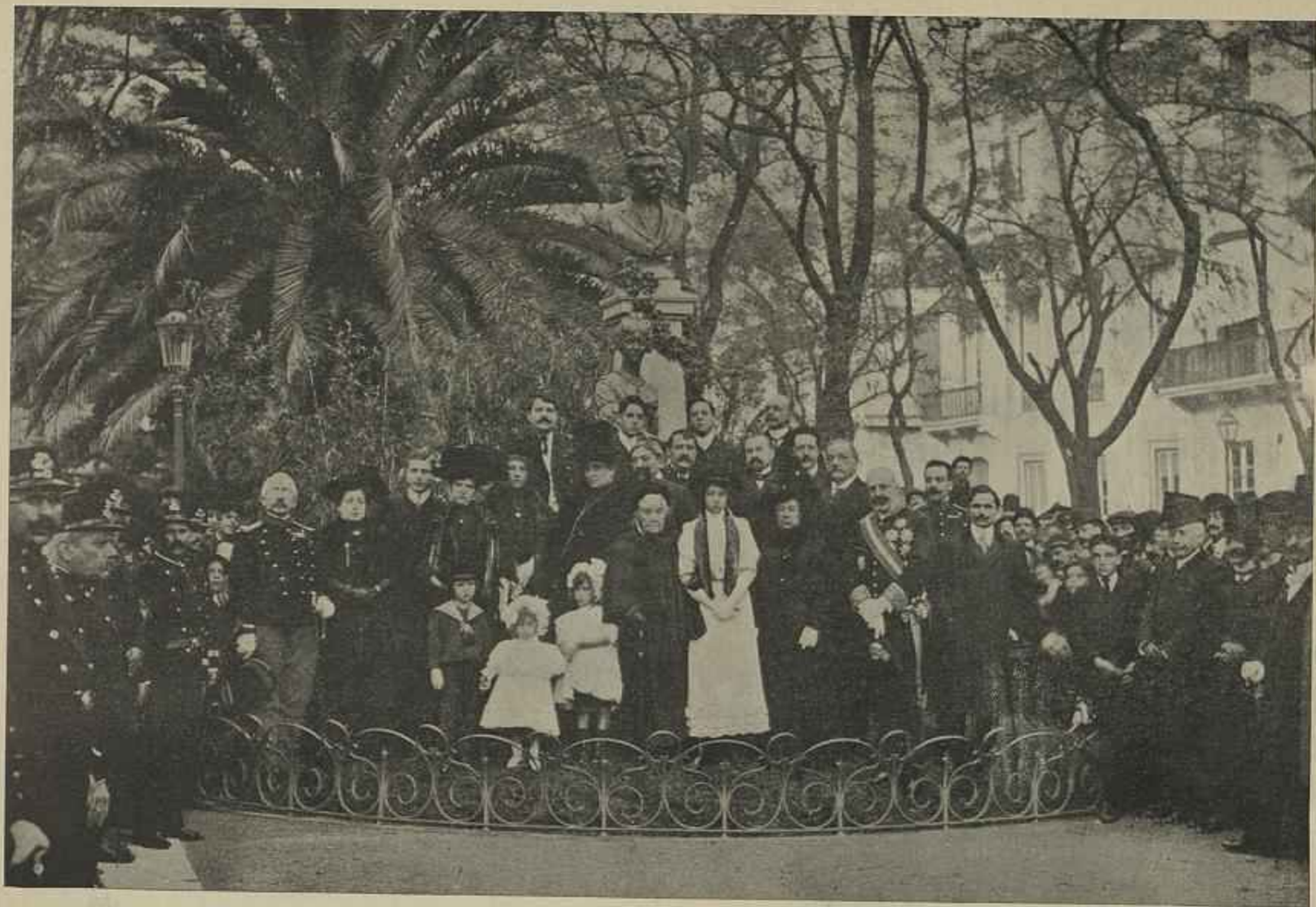
NA INAUGURAÇÃO DO MONUMENTO A PINHEIRO CHAGAS