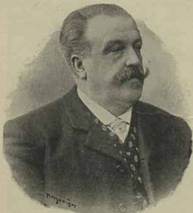
JOSÉ DE MELLO

Entretanto isso não impediu que o monumento se erigisse, simples mas bello, como é sempre a simplicidade, e que junto ao heroe que elle perpetua no bronze, nós vejamos a decorar-lhe o pedestal essa figura galante, irrequieta, caprichosa da Morgadinha de Val-Flôr , delicada criação do poeta, tipo ro-