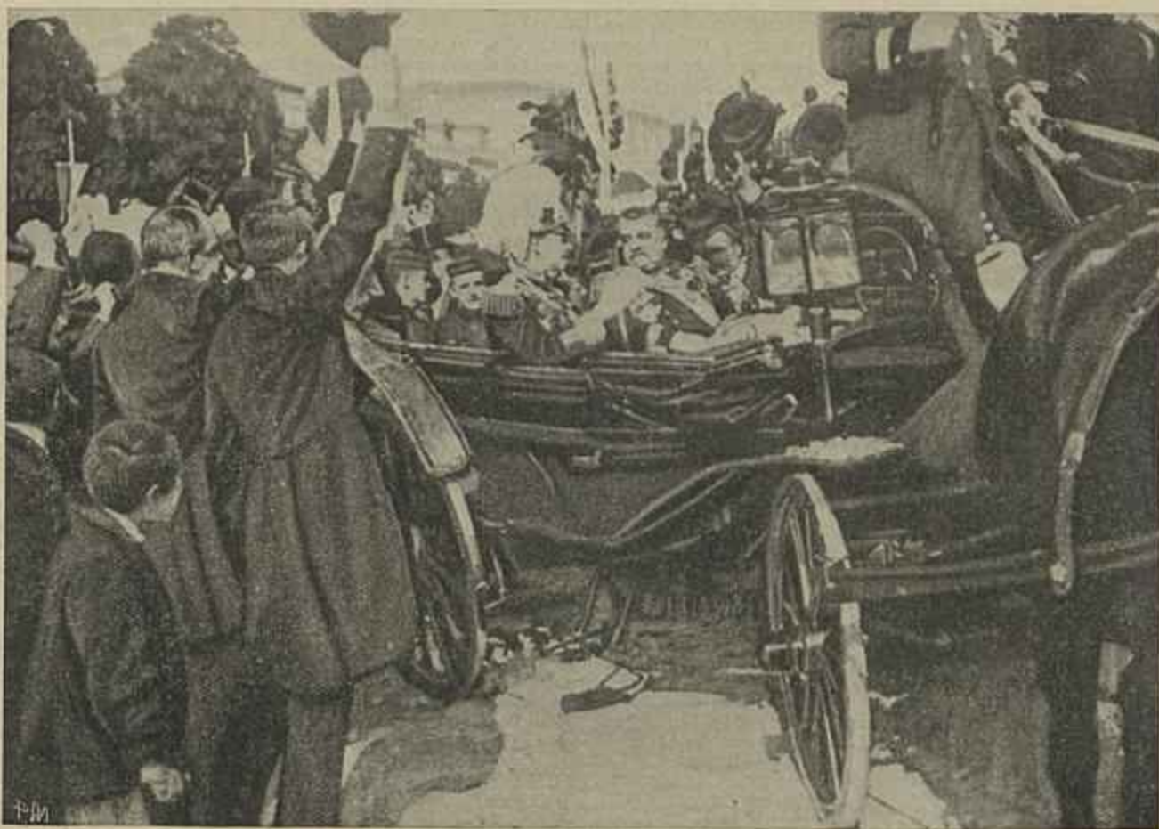
EL-REI D. MANUEL ACLAMADO À SAHIDA DA ESTAÇÃO DE CAMPANHAN