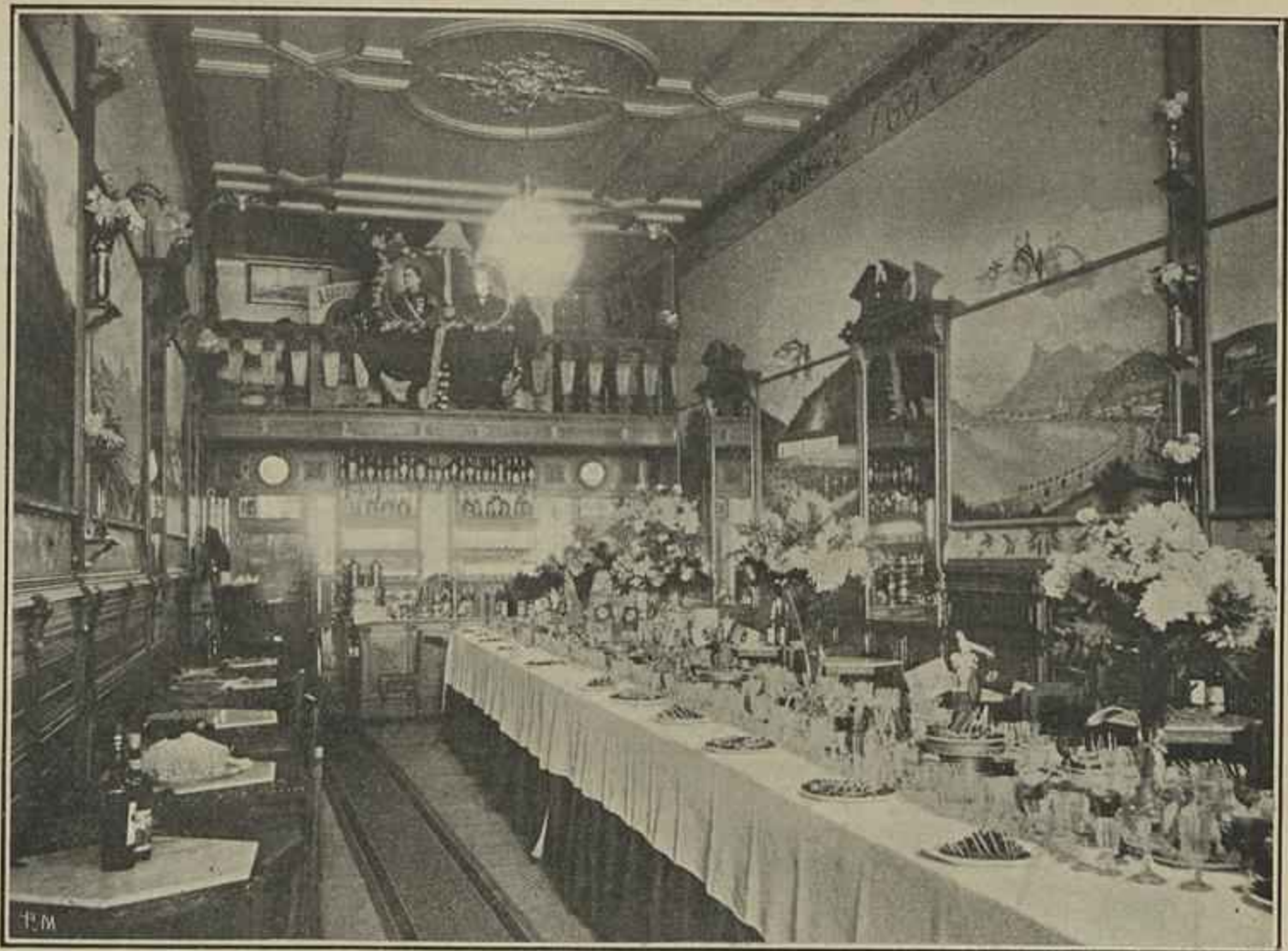
A BRAZILEIRA — O NOVO SALÃO INAUGURADO EM 15 DO CORRENTE