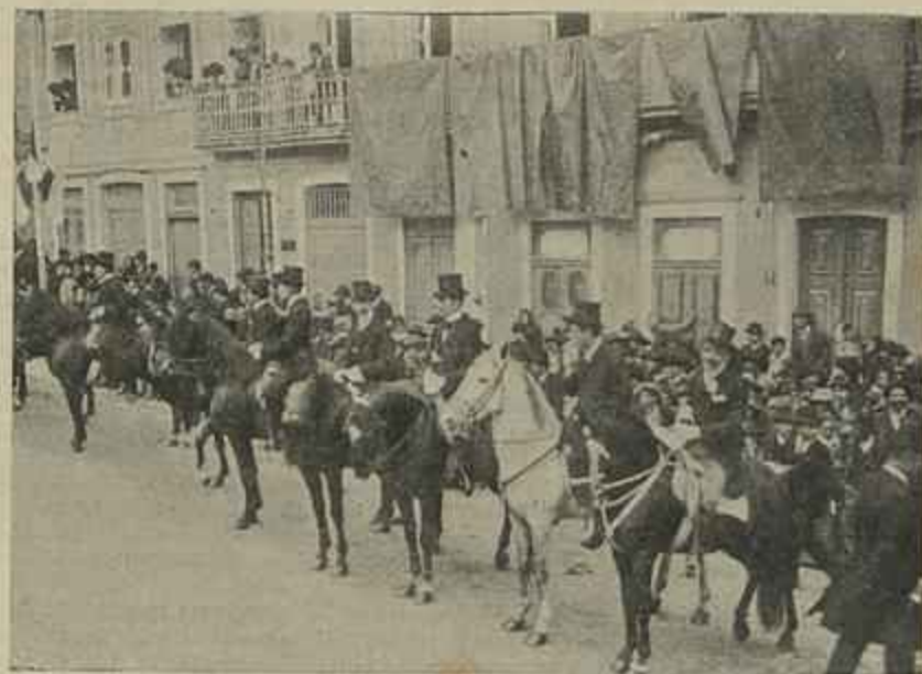
PASSAGEM DO CORTEJO REAL NA RUA FERREIRA BORGES — OS CAVALEIROS DA LEGIÃO AZUL