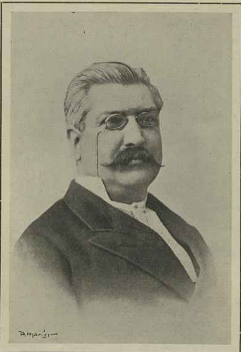
MANUEL PINHEIRO CHAGAS

Deu-se em Pinheiro Chagas o raro condão de ser um escritor e um orador. Elle teve essa dua-