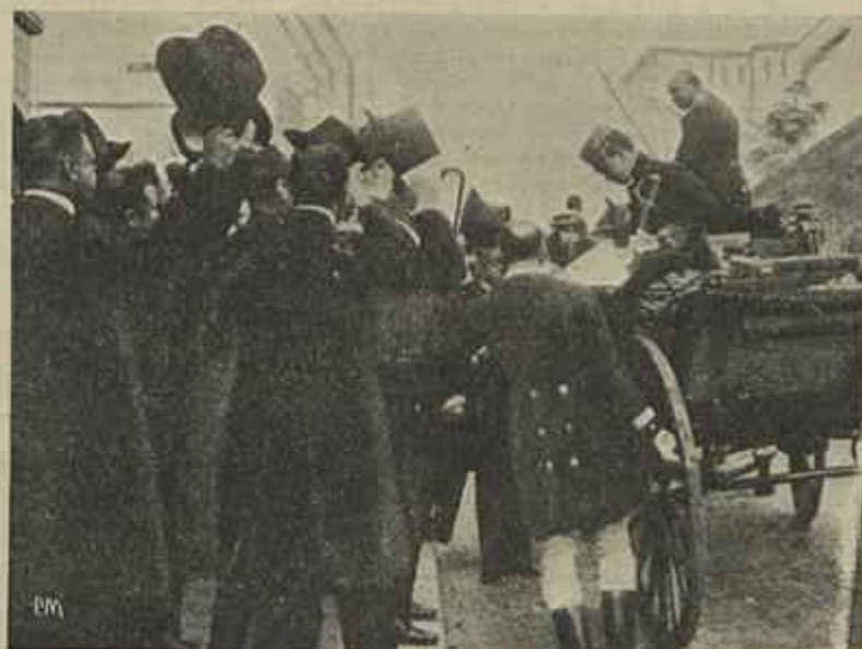
NA EGREJA DA LAPA, DURANTE O «TE-DEUM» — EL-REI D. MANUEL RECEBIDO À ENTRADA DO PALÁCIO DA BOLSA PELA DIREÇÃO DA ASSOCIAÇÃO COMERCIAL