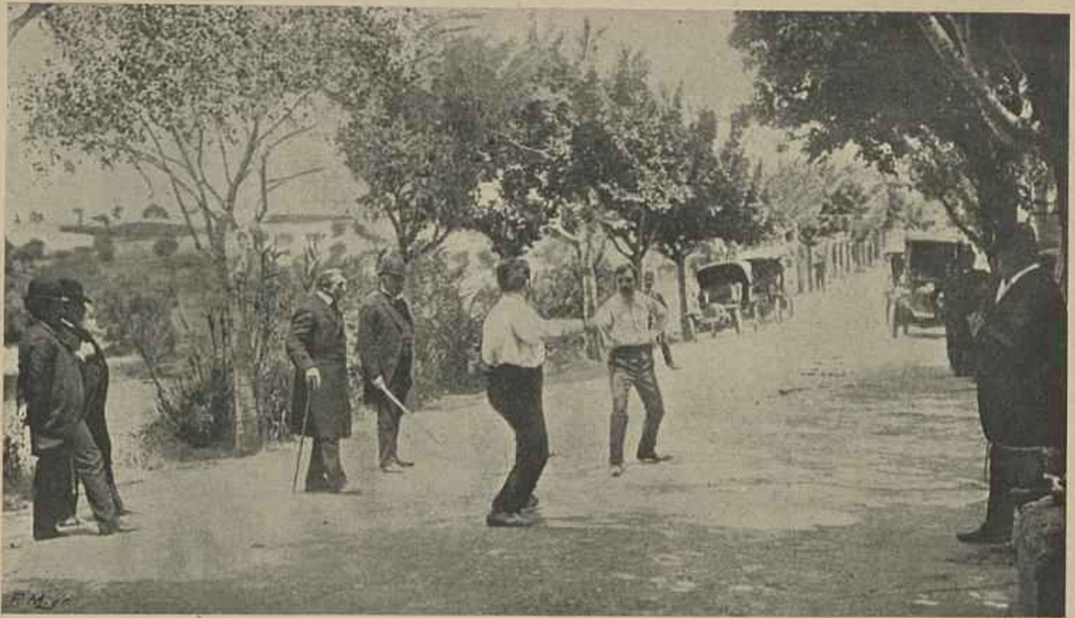
O DUELLO Á ESPADA ENTRE OS SRS. CONDE DE PENHA GARCIA E DR. AFONSO COSTA