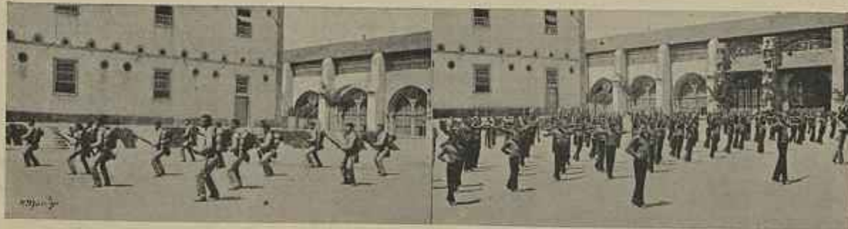
ALUNOS DA AULA DE SARGENTOS EM EXERCÍCIO