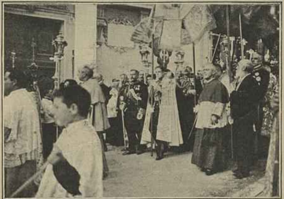
S. M. EL-REI D. MANUEL PEGANDO Á PRIMEIRA VARA DO PALIO, NA PROCISSÃO DO CORPO DE DEUS