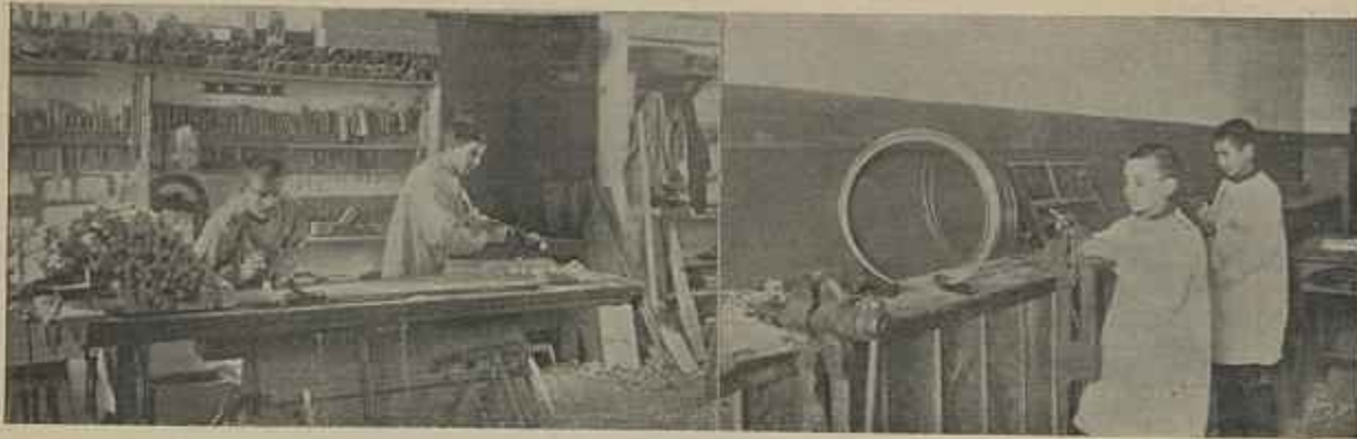
AULAS DE TRABALHOS MANUAIS DE CARPINTIRO E ARAMEIRO