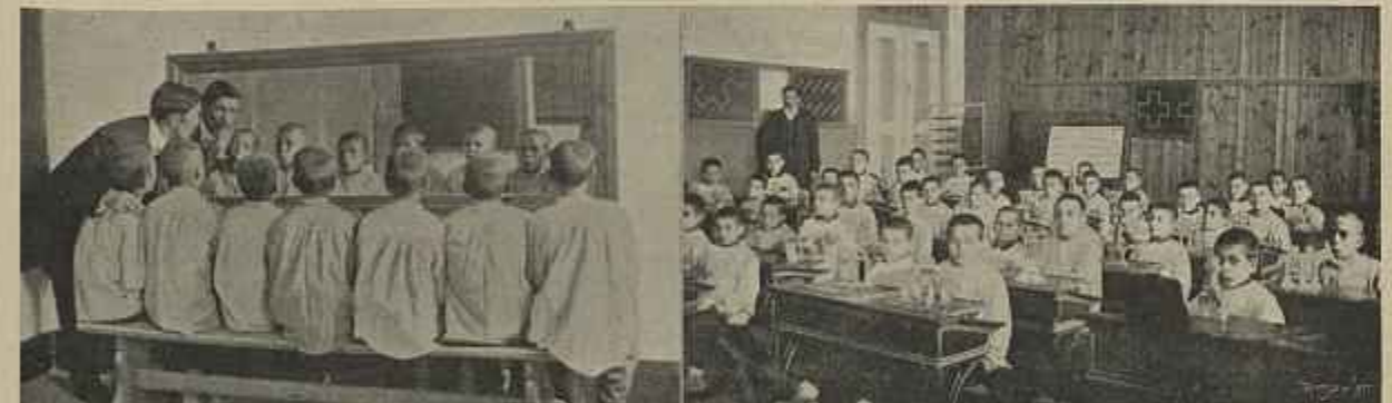
ESTUDO DE PRONUNCIÇÃO PELO MOVIMENTO DOS LÁBIOS ANTE UM ESPELHO