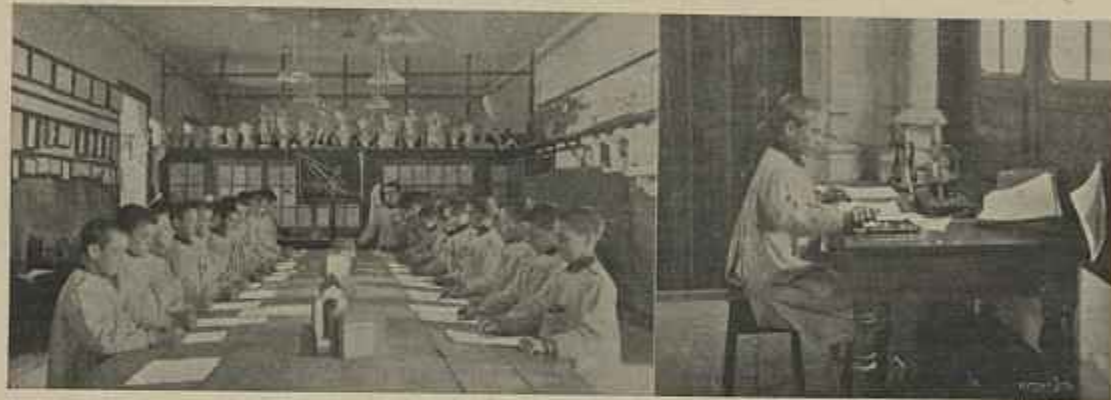
AULA DE DESENHO