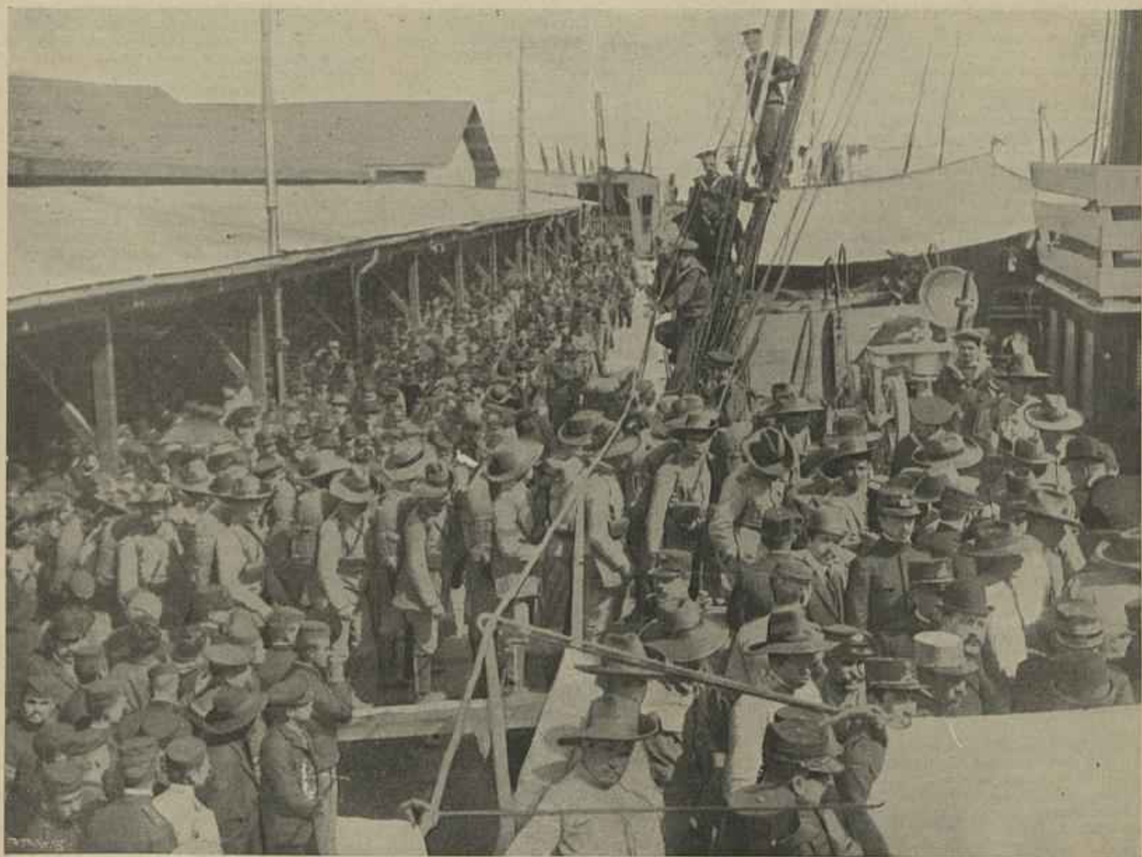
EMBARQUE DOS EXPEDICIONARIOS NO VAPOR «ANGOLA» DA EMPRESA NACIONAL DE NAVEGAÇÃO