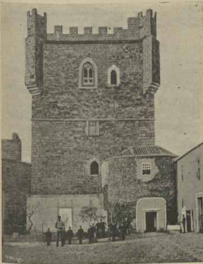
CASTÉLO DE BRAGANÇA — TORRE DE HOMENAGEM