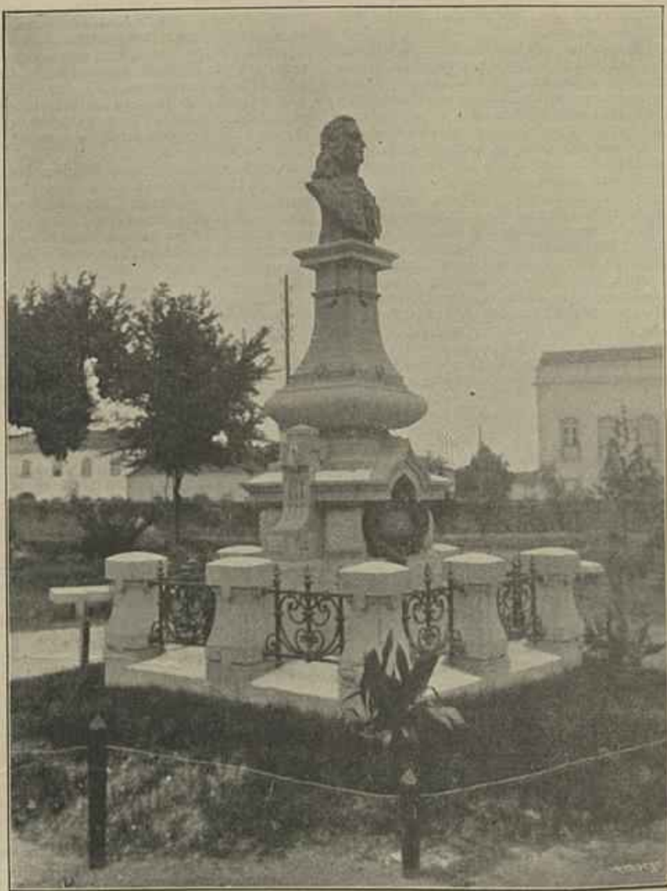
MONUMENTO AO MARQUÊS DE POMBAL, NA VILA DE POMBAL

Entre os varios e complicados problemas a cuja solução a sciencia social se entrega com ardor, nos diversos estados do mundo culto, occupa logar proeminente aquelle que respeita á habitação do pobre. O estudo do problema da habita-