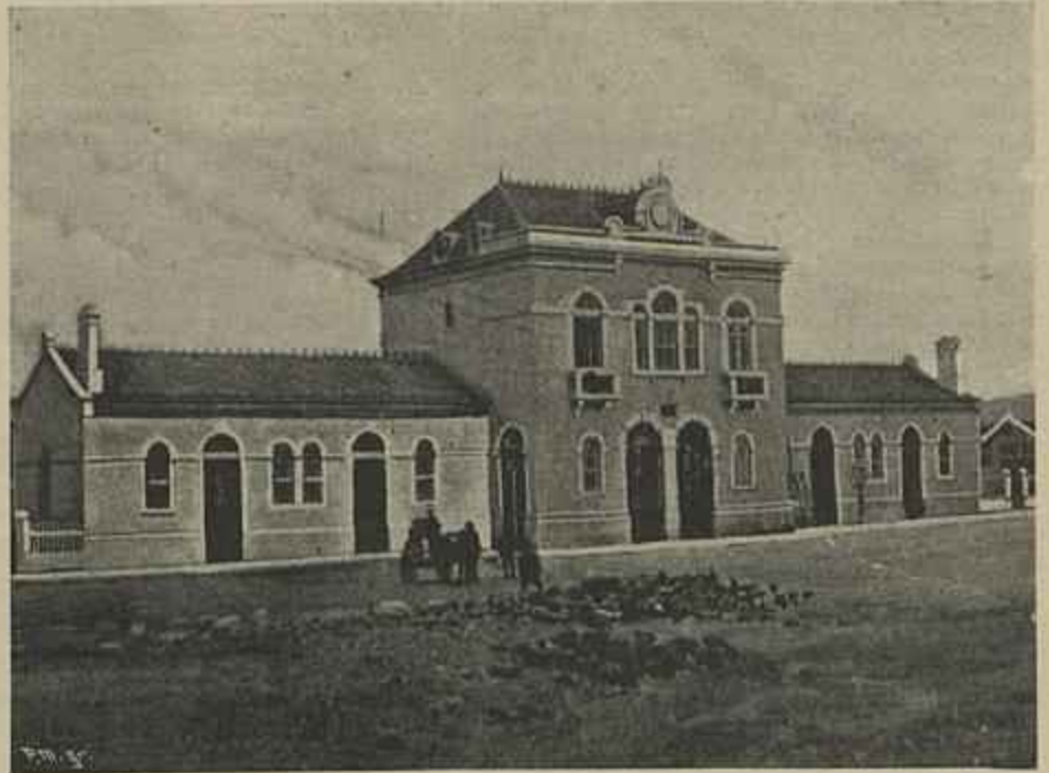
ESTAÇÃO DO CAMINHO DE FERRO EM BRAGANÇA