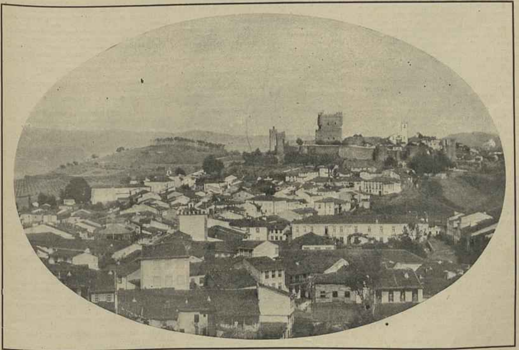
VISTA GERAL DE BRAGANÇA