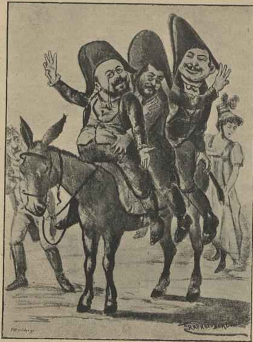
Os autores do Burro do sr. Alcaide — Gervasio Lobato, D. João da Camara e Ciriaco Cardoso

No longo curso que o funebre cortejo seguiu, desde a Junqueira até ao alto de S. João, veio passar por aquellas hortas, que foram teatro de uma das cenas da Rosa Engeitada , a peça que mais popularizou o nome de D. João da