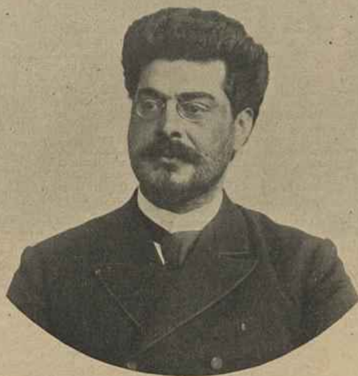
D. JOÃO DA CAMARA