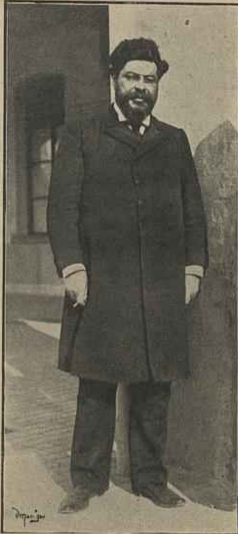
O ULTIMO RETRATO DE D. JOÃO DA CAMARA