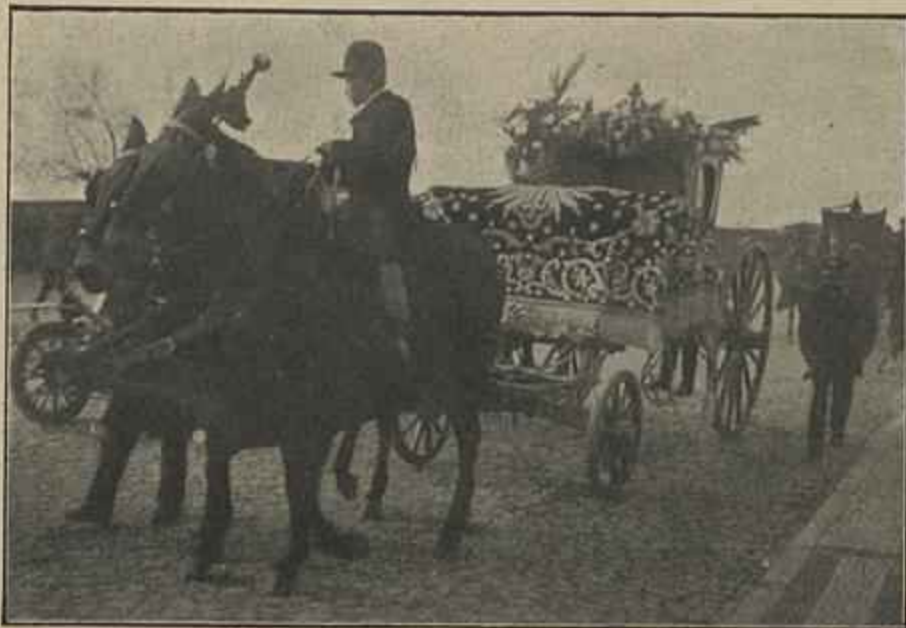
A ULTIMA JORNADA

Côco, Reineta e Facada , idem, idem em 1893. (Esta peça foi depois modificada por D. João da Camara, com o titulo Bibi & C. , e levada á scena no Porto e no Brazil pela companhia Taveira, que