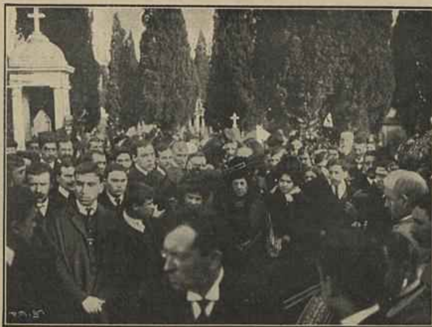
ACOMPANHANDO-O ATÉ AO TUMULO

D. Brigida , comédia em 1 acto, em verso, representada no theatro Normal em 1885.