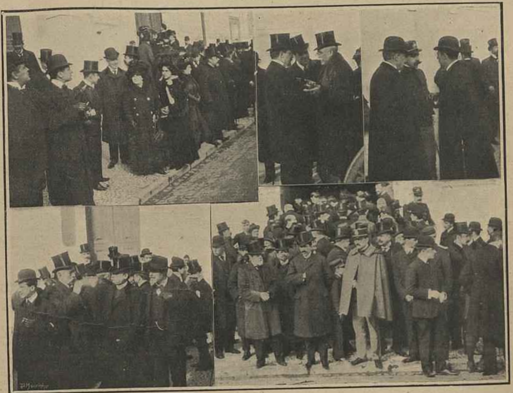
AUTORES E ACTORES NO FUNERAL DE D. JOÃO DA CAMARA