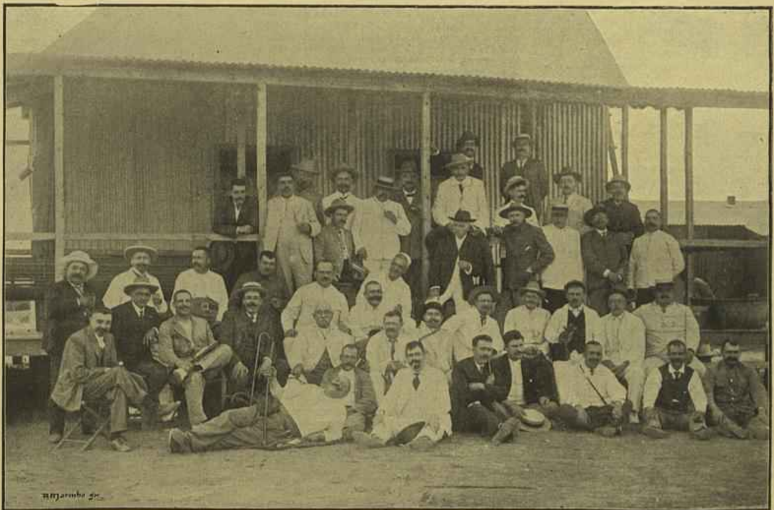
CONVIVAS DO «PIC-NIC» DE PIONEIROS DE LOURENÇO MARQUES COM MAIS DE 10 ANOS DE RESIDENCIA NA COLONIA