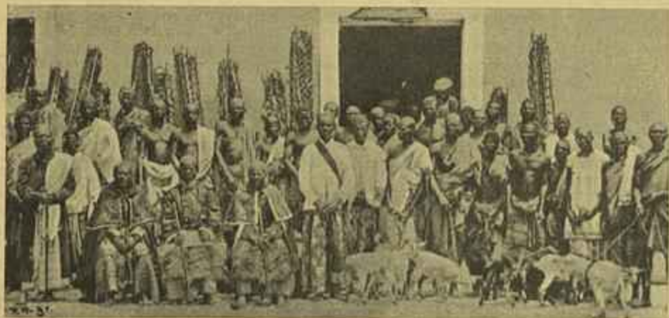
UMA EMBAIXADA DOS DEMBOS EM LOANDA