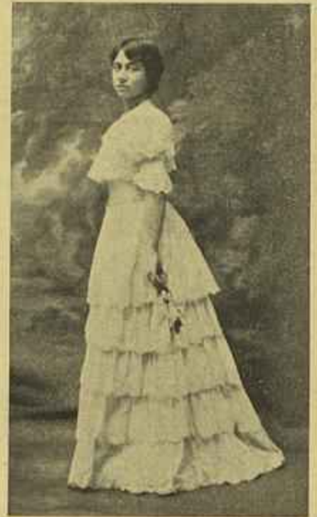
MADMOISELLE ADÈLE CLÉMENT Violoncelista