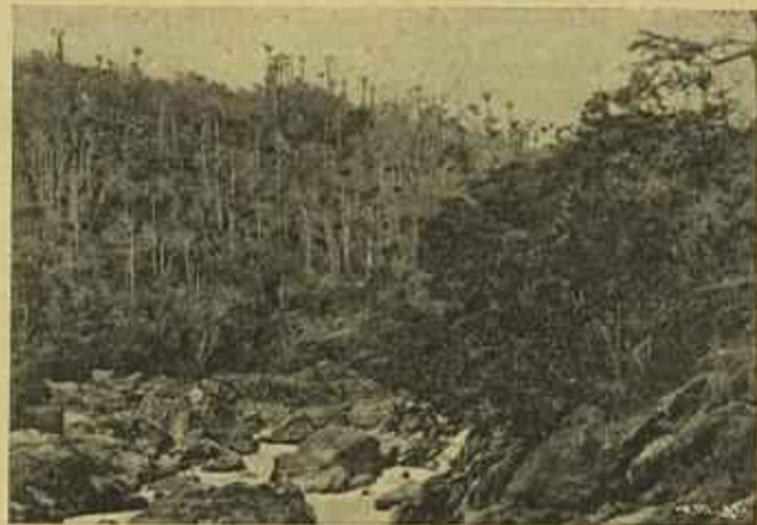
NÓ ALTO DANDE, FRONTEIRA DOS DEMBOS