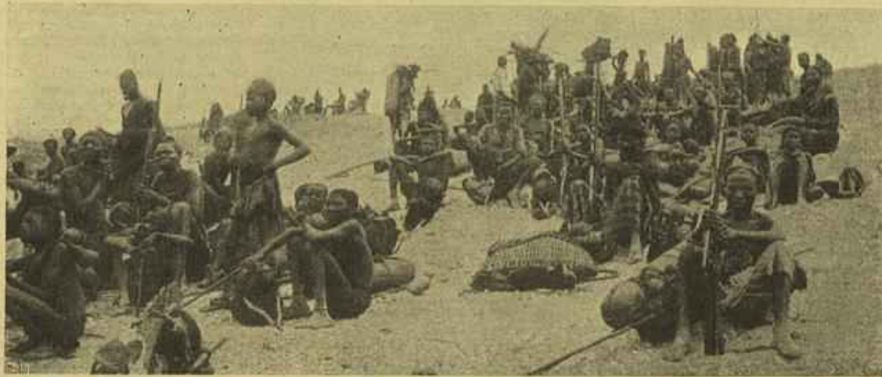
NÓ PAIS DOS DEMBOS, UMA QUIBUCA

Dissemos que ha mais de um século os Dembos combatiam o dominio dos portuguezes no seu país, internado na provincia de Angola, e de facto assim é, como consta de antigas communicações