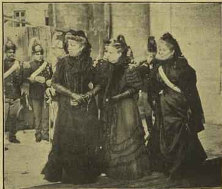
AS DAMAS DE HONOR AGUARDANDO A CHEGADA DE SUAS MageSTADES, NO ATRIO DA SÉ

NAS EXEQUIAS POR ALMA DE EL-REI D. LUIS — VID. CHRONICA OCCIDENTAL