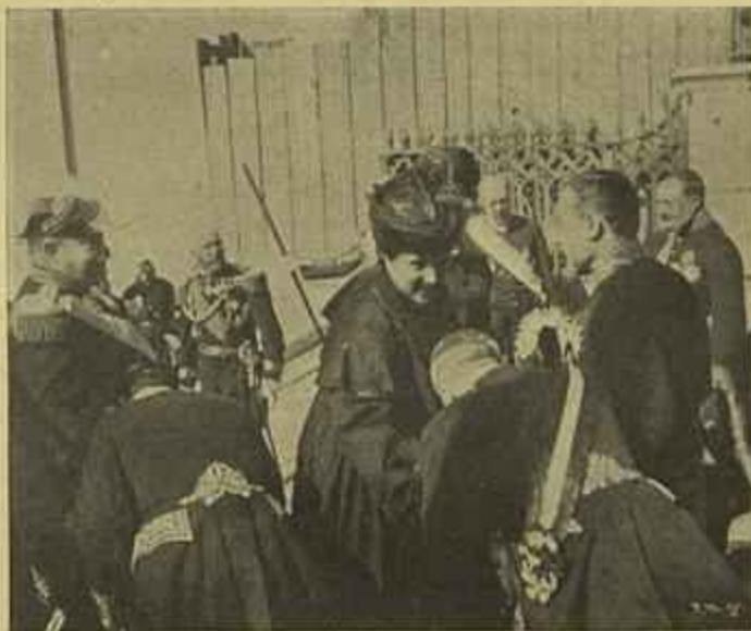
NA SÉ — CHEGADA DE SUAS MageSTADES EL-REI D. CARLOS E RAINHA SENHORA D. AMELIA

O bloco liberal continúa unido sem uma unica defeecção. O sr. José Luciano de Castro a quem pertence, pela sua idade, pelos seus serviços ao paiz, pela sua antiguidade como presidente do conselho, como conselheiro de Estado, como