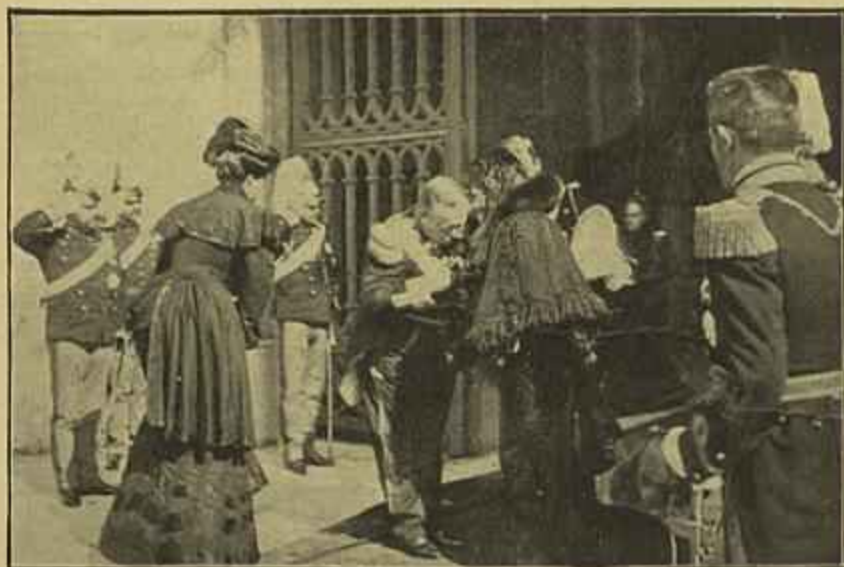
SUA MageSTADE EL-REI D. CARLOS BEIJANDO A MÃO A SUA AUGUSTA MÃE A RAINHA SENHORA D. MARIA PIA