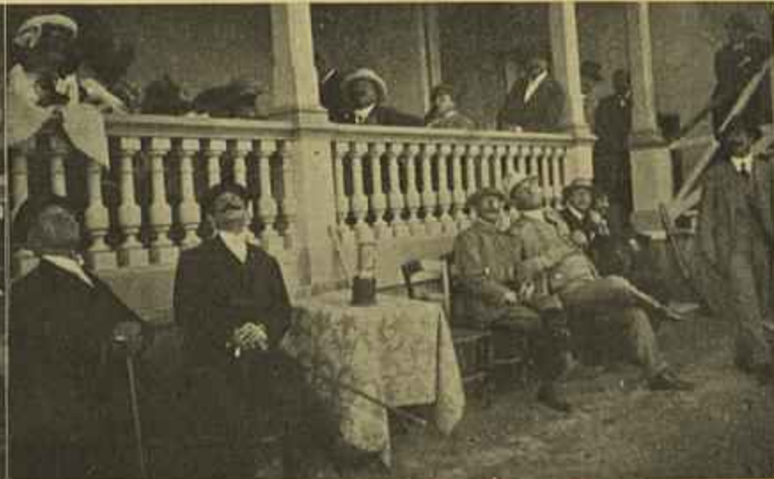
A FUGIDA DE UM PÔMO