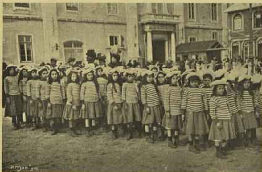
AS COLEGIAES DA CLASSE DE GIMNASTICA COLEGIAES EM FÓRMA, ENTRANDO NO ARSENAL.