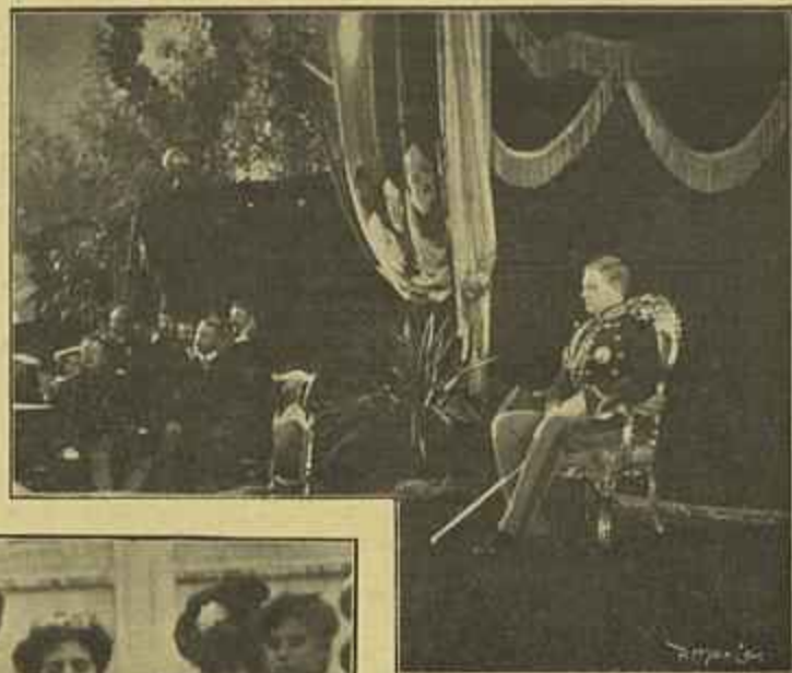
SUA ALTEZA O PRINCIPE D. LUIS FILIPE, PRESIDINDO À FESTA DAS ESCOLAS.