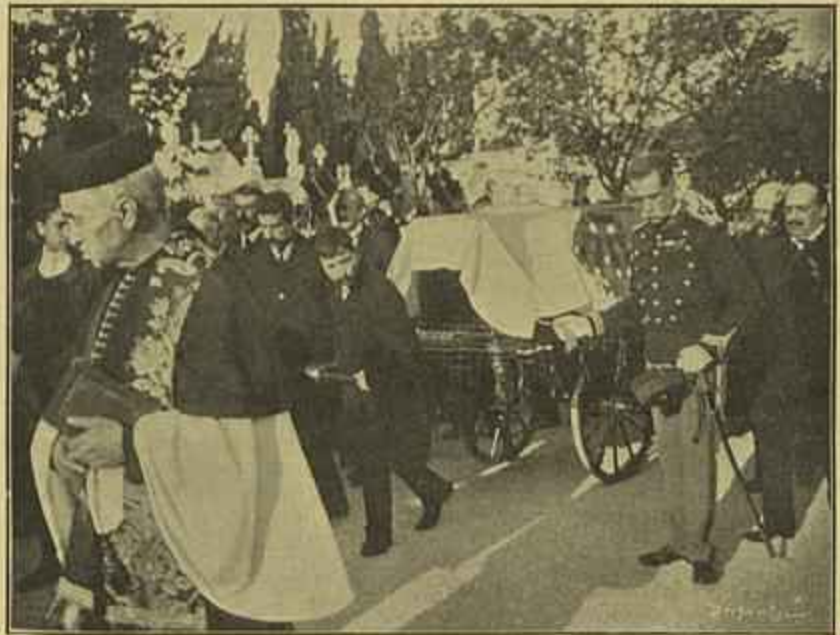
NO CEMITERIO DOS PRAZERES