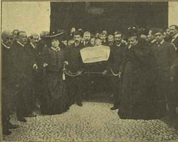
SAÍDA DO FERETRO DA EGREJA DE S. JOSÉ

— Coimbra — Edição da Livraria Moura Marques — 1907.