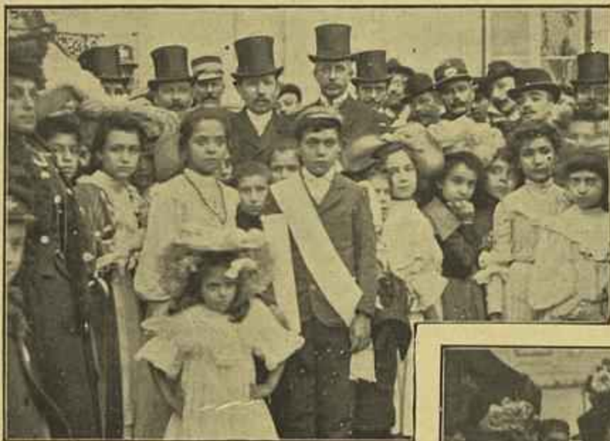
OS SRS. PRESIDENTE DO CONSELHO, MINISTRO DA GUERRA E MAIS MEMBROS DA COMISSÃO DA FESTA DAS ESCOLAS EM GRUPO COM AS CRIANÇAS PREMIADAS.