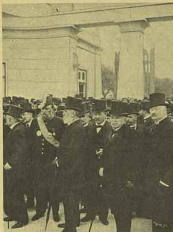
AGUARDANDO A CHEGADA DO PRESTITO A PORTA DO CEMITERIO