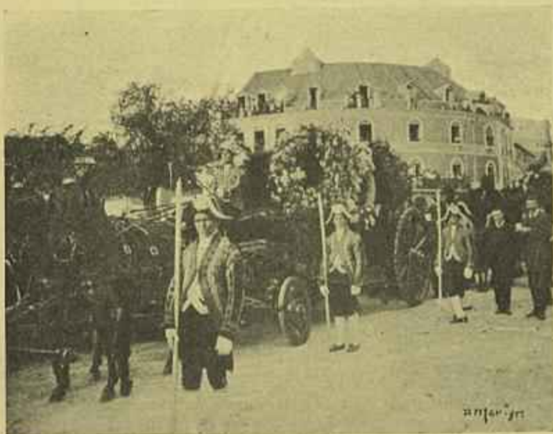
O COCHE, CONDUZINDO A URNA FUNERARIA, CHEGANDO AO CEMITERIO