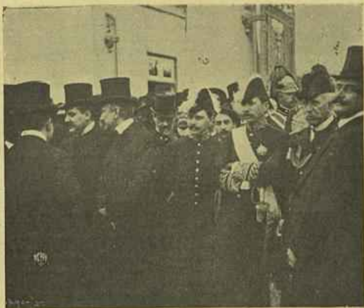
OS MEMBROS DO GOVERNO AGUARDANDO A CHEGADA DO PRESTITO A PORTA DO CEMITERIO