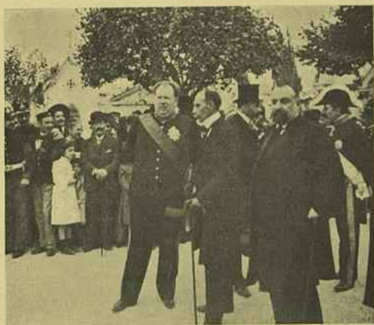
OS ORADORES — ANTES DOS DISCURSOS