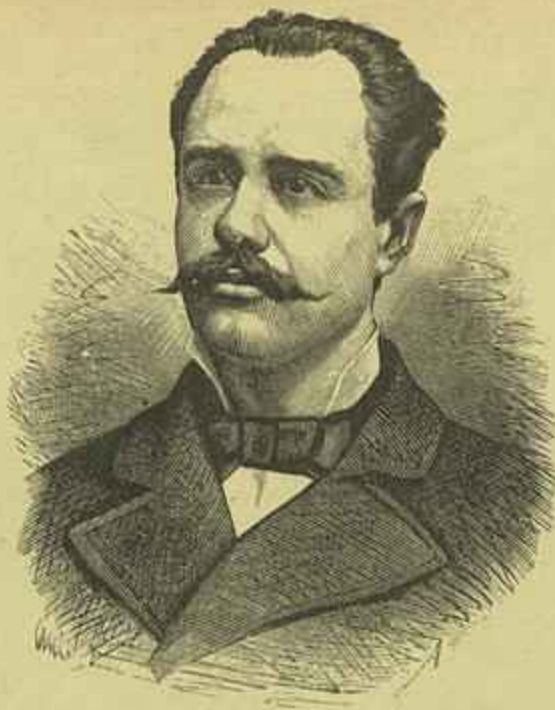
CONSELHEIRO HINTZE RIBEIRO EM 1881 QUANDO PELA PRIMEIRA VEZ MINISTRO DAS OBRAS PUBLICAS

A eloquencia é uma nobre arte; mas, sendo uma cumplicidade com as assembléas, não raro, illusão das illusões de quem escuta, e vai enlevado no timbre sympathico da voz que falla, na figura atrahente do orador, ou na sua paixão indignada, que, certamente, e muita vez desperta a paixão indignada de quem escuta; — a eloquencia porque refere de mil cousas, idéas, sentimentos e circumstancias do tempo, em que discorre o orador,