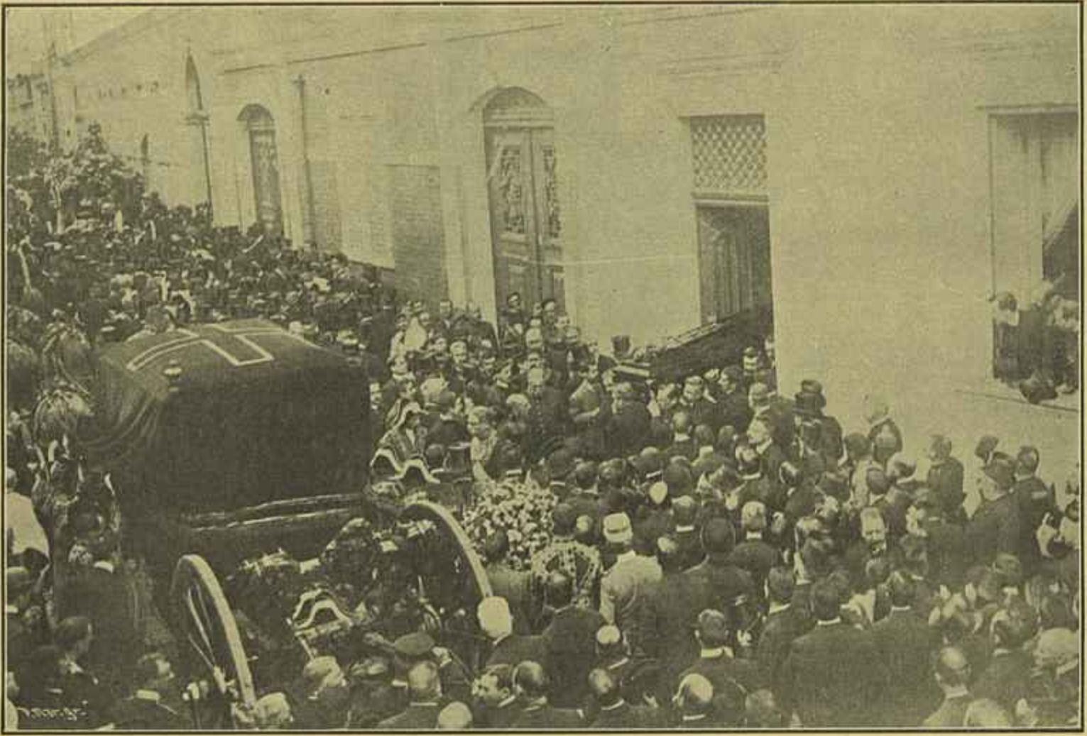
O SAHIMENTO — OS PARENTES E AMIGOS DO CONSELHEIRO HINTZE RIBEIRO CONDUZINDO A URNA FUNENARIA DE CASA PARA O COCHE.