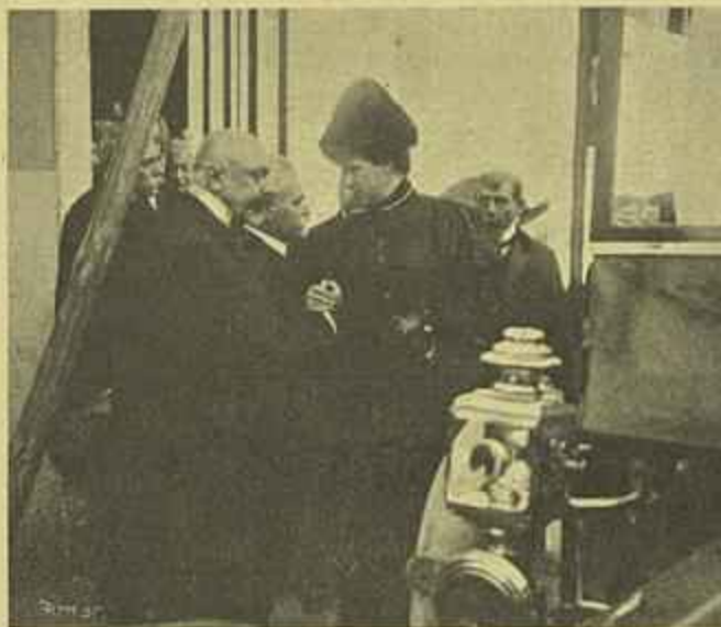
VISITA DE S. M. A RAINHA D. AMELIA Á VIUVA DE HINTZE RIBEIRO — A SAHIDA DE CASA

timentos e fizeram-se representar no enterro. Liberaes, progressistas, republicanos, pegaram ás borlas do caixão. Olhos lavados em lagrimas eram muitos n'aquelle cemiterio aonde o transportaram. Eram sem conta, na casa da rua de S. Bento, as lagrimas da esposa, que nem o beijo da despedida pudera dar em vida ao querido amigo.