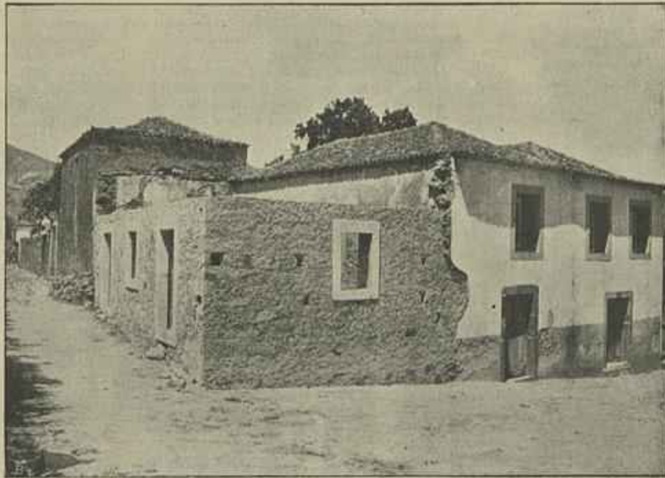
CASA DE CRISTOVÃO COLOMBO EM PORTO SANTO (De fotografia)