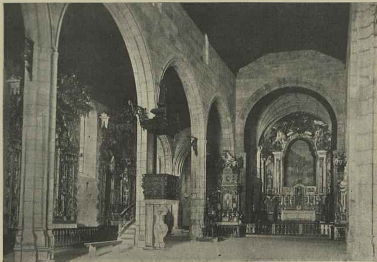
VISTA INTERIOR DA EGREJA E CAPELA-MÓR