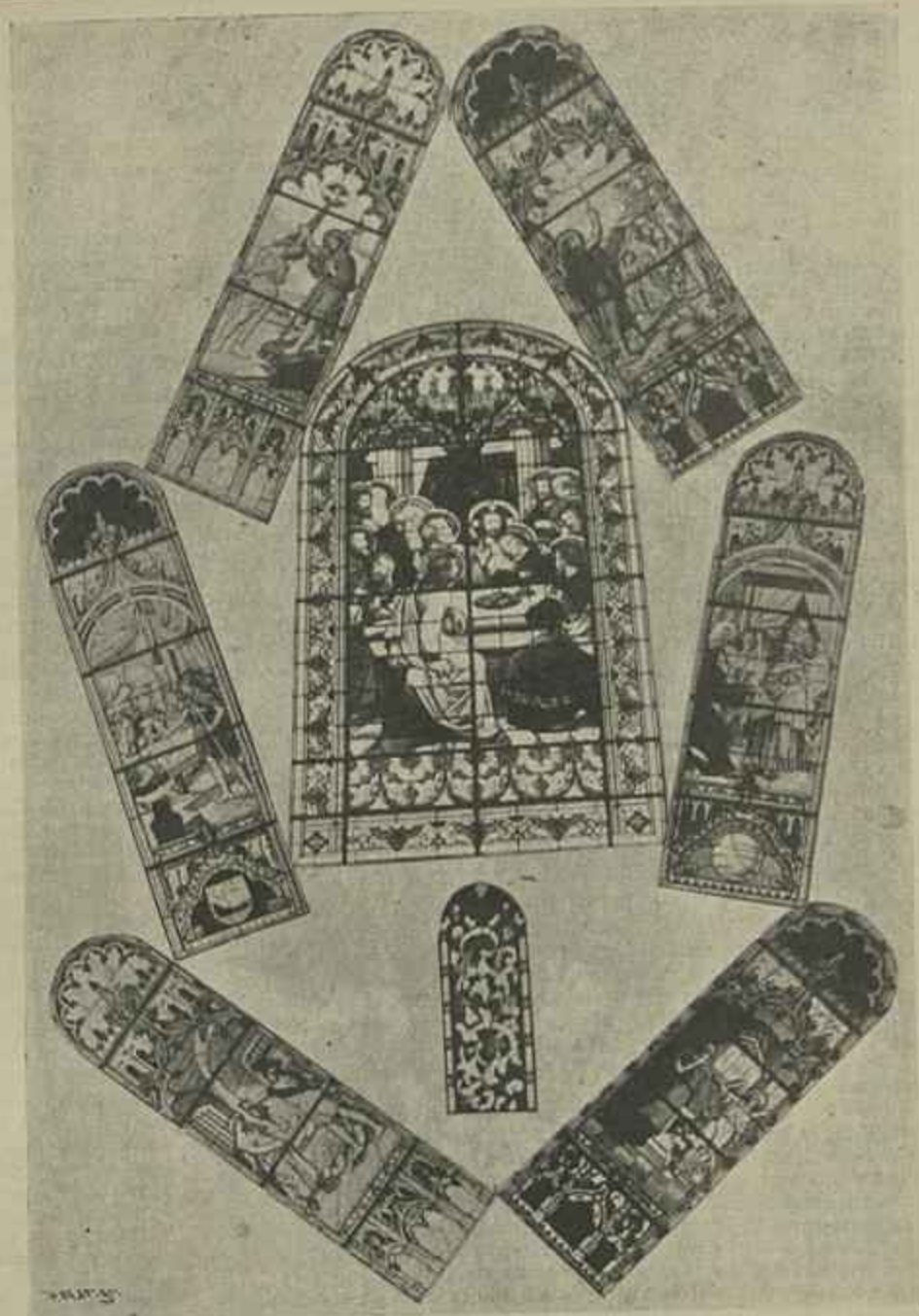
EGREJA MATRIZ DE VILLA DO CONDE — OS VITRAES

Hoje felizmente, levantou-se essa enorme vergonha, que pesava sobre esta villa, reparando os ultrajes infligidos á veneranda Matriz, que em subido grau inspira aquelle respeito melancolico e saudoso, que é um segredo das egrejas gothicas. Por melindre pessoal, como é facil de