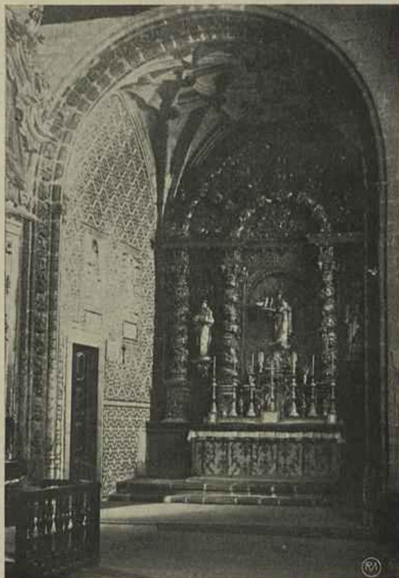
CAPELA DE NOSSA SENHORA DA BOA VIAGEM