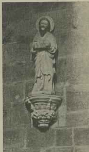
S. JOÃO BAPTISTA

No clerestory ha oito janellas mais pequenas,